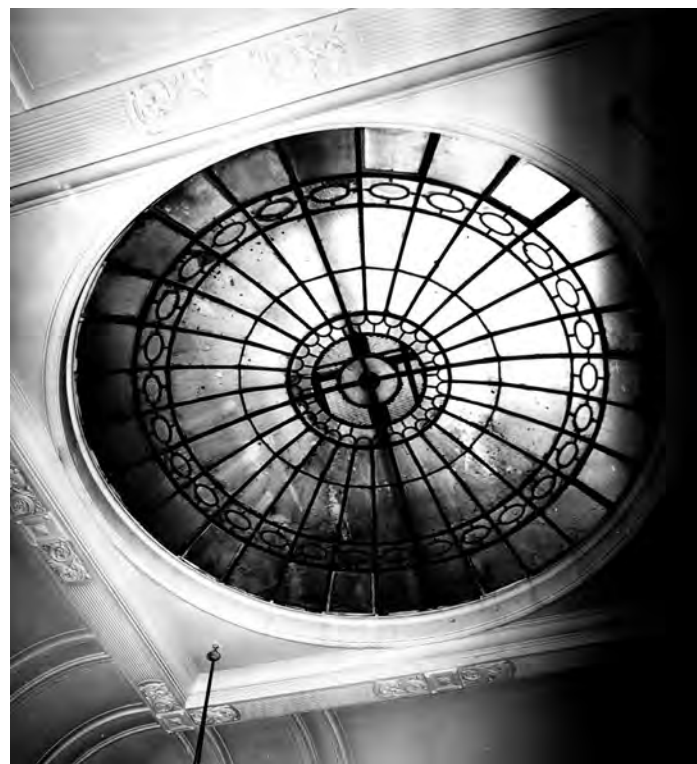
Сл. 6. Таваница шалтер сале

После рата, у новим друштвеним околностима, престао је рад Прометне банке. Њен дом је 1949. године постао општенародна имовина, па је коришћен за смештај различитих установа (Институт за изучавање радничког покрета, Уред за заштиту југословенске имовине у иностранству, Удружење банака СФРЈ, Архив Југославије, Југословенски институт за економска истраживања). У мањим дућанима смењивале су се разне продавнице, а у великом дућану на углу папирница „Шумадија“ одржавала је доскора континуитет продаје