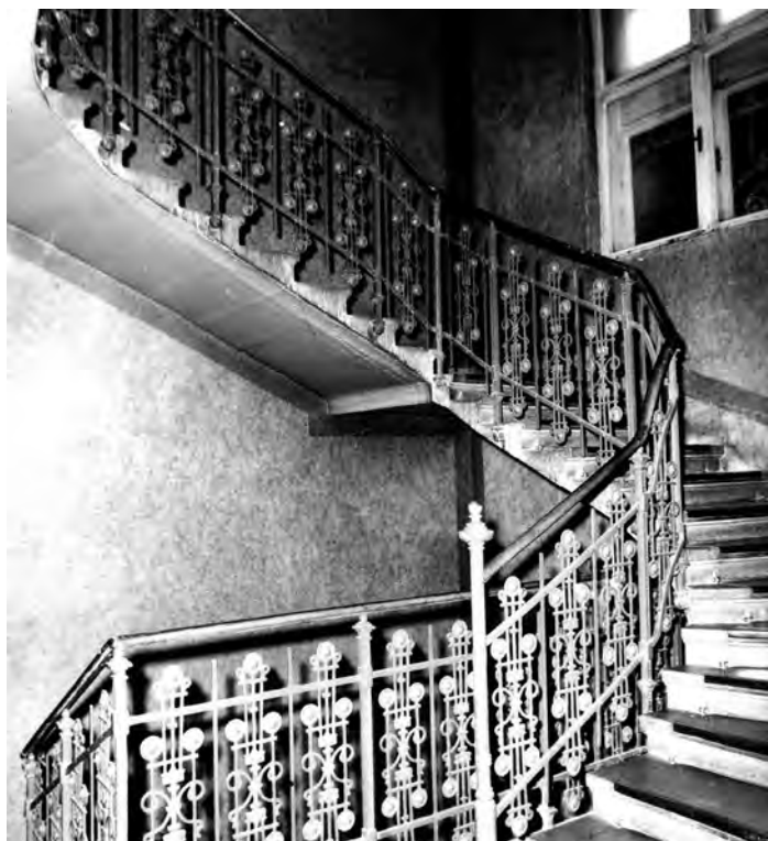
Сл. 5. Детаљ сџејенишија