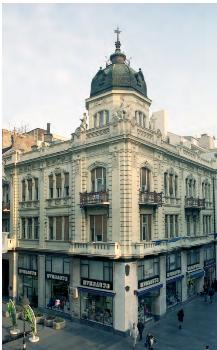
Сл. 1. Дом Прометне банке, садашње стање

саграђене за време аустријске владавине (1717–1739), а порушене када су Турци поново заузели Београд. Ова велика грађевина протезала се од данашњег Обилићевог венца до Змај Јовине улице, па су њени остаци налажени приликом изградње кућа у Кнез Михаиловој улици. 7