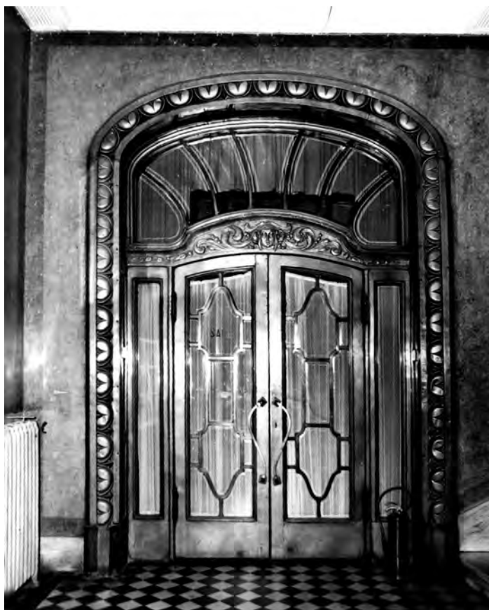
Сл. 4. Улаз у шалтер салу