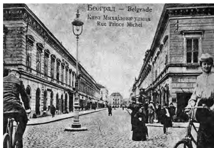
Сл. 6. Палаћа „Слоја“, прва зграда са десне стране

Списак имања у Београду, почетна цена, редослед и време њихове распродаје на јавним лицитацијама, Управитељство вароши Београда објавило је у додатку