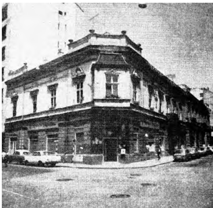
Сл. 10. Кућа првровца Павловића (на месту куће Николе Предића), Вука Караџића 14 (извор: „Кнез Михаилова улица, заштитна наслеђа – уређење простора“, каталоги из 1975, Београд, стр. 106)