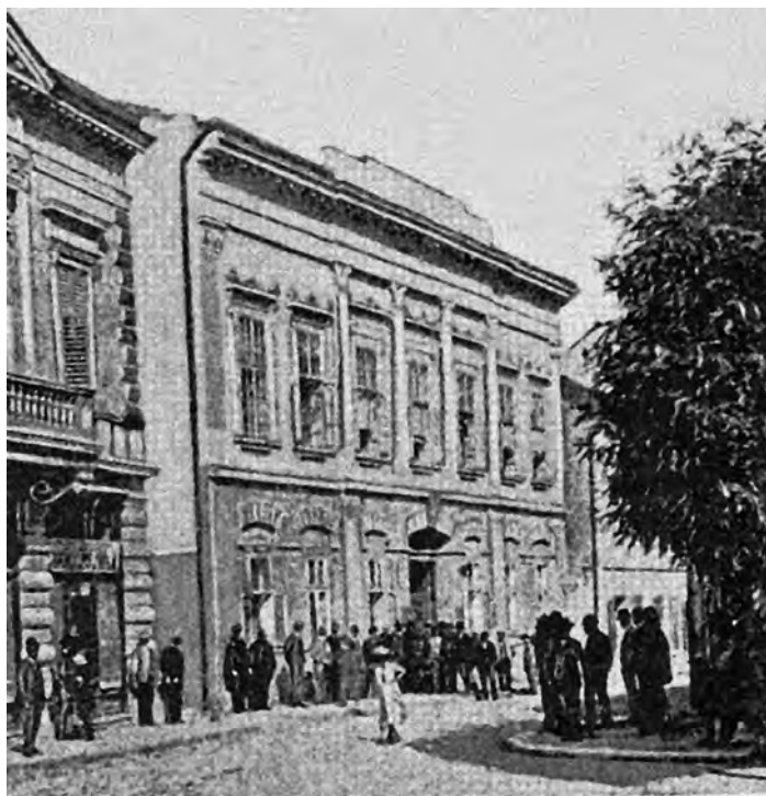
Сл. 8. Гостіоница „Срїска круна“, Узун Миркова 1; излєд из 1894.

кнежевих поседа, могла започети етапа модерне урбанизације, промене власништва и почетак нове ере. Продаја турских имања у Србији одвијала се у три фазе, са дужим временским прекидима. Започета је у време Првог српског устанка, делимично се одвијала након Хатишерифа из 1830, а настављена је после турског