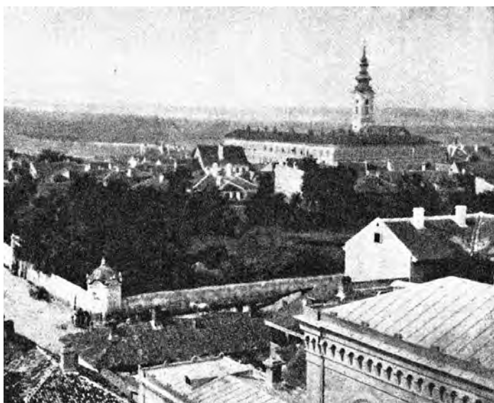
Сл. 3. Карађорђевића башиџа; снимак А. Јовановића из 1865. (извор: Дивна Ђурић-Замоло, Небојша Бојновић, „Београд са старијих фототографија“, Београд, 1997, сир. 12)

навести извори. Не само у Београду и Србији, имања А. Карађорђевића била су веома велика и веома скупа и у Румунији и Мађарској. Само у Румунији (Чокина, Хирлешти Марлеса, Хергушка, Крашан), имања за која је српска влада тражила продају била су процењена на суму од 80.000 дуката. 6