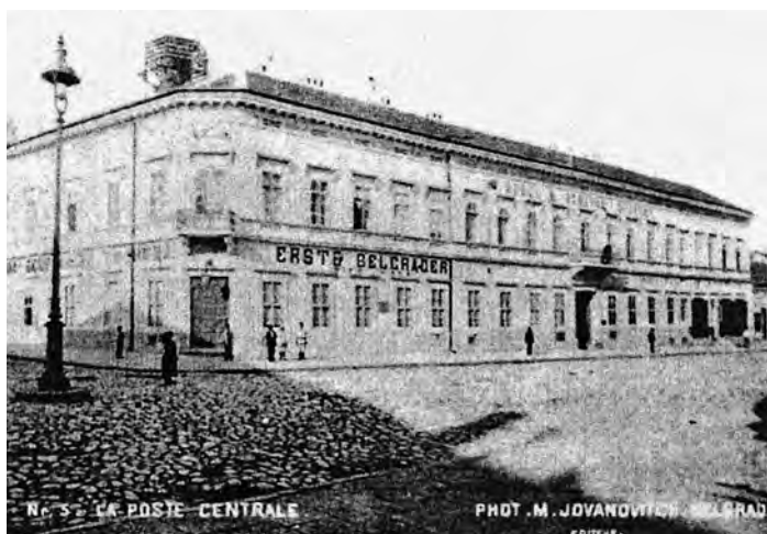
Сл. 7. Палаћа „Слоја“, снимљена као „Грађанска Касина“