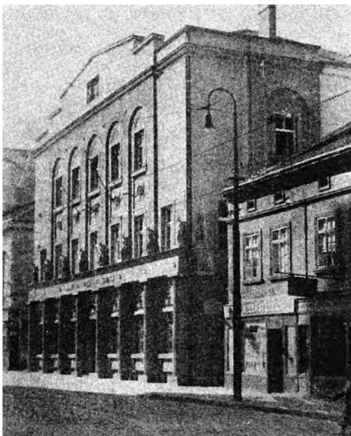
Сл. 9. Зграда Београдске општине (раније „Српска круна“), Узун Миркова 1; изглед из 1939. након реконструкције (извор: БОН, 10, 1939, стр. 609)