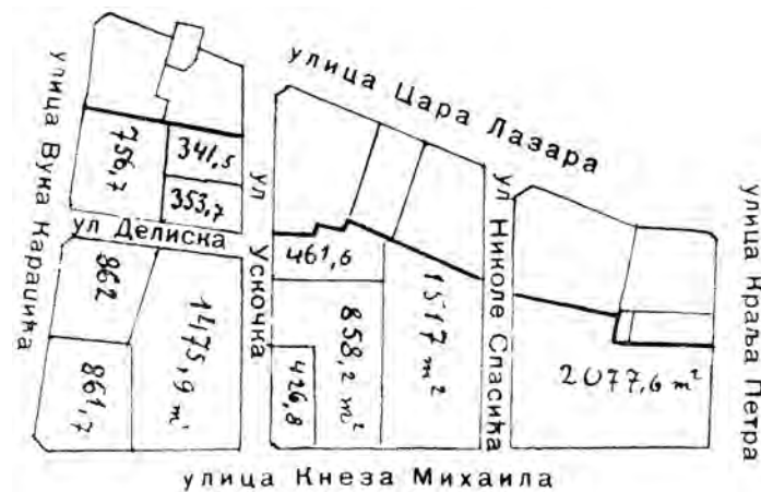
Сл. 2. Карађорђевића башта; ситуациони план из 1935. (без кућа); подела на грађевинске њлаце (извор: Илија Ђукановић, „Убиство кнеза Михаила и догађаји о којима се није смело јаворити“, књига 1, Београд, 1935, стр. 205)

под једним редним бројем поседа налази се више дућана, или више других објеката. Сама Кнежева башта имала је девет пописних јединица за продају, иако под једним бројем и иако је на свакој од њих подигнут најмање по један објекат. Имања ван Србије предмет су неке друге студије, и неће бити третирана у овом приказу, изузев што ће се за заинтересоване истраживаче