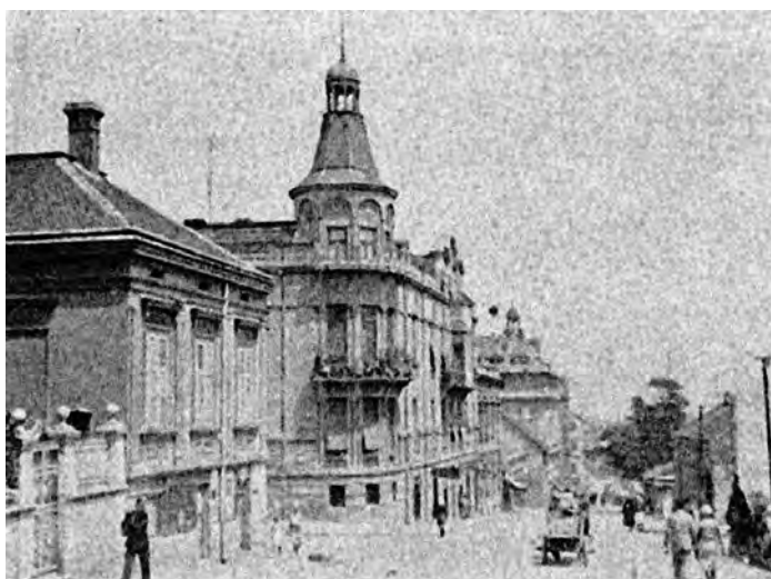
Сл. 14. Место куће Николе Крсћића (данас Загужбина „Кики“), где су били дућани А. Карађорђевића.