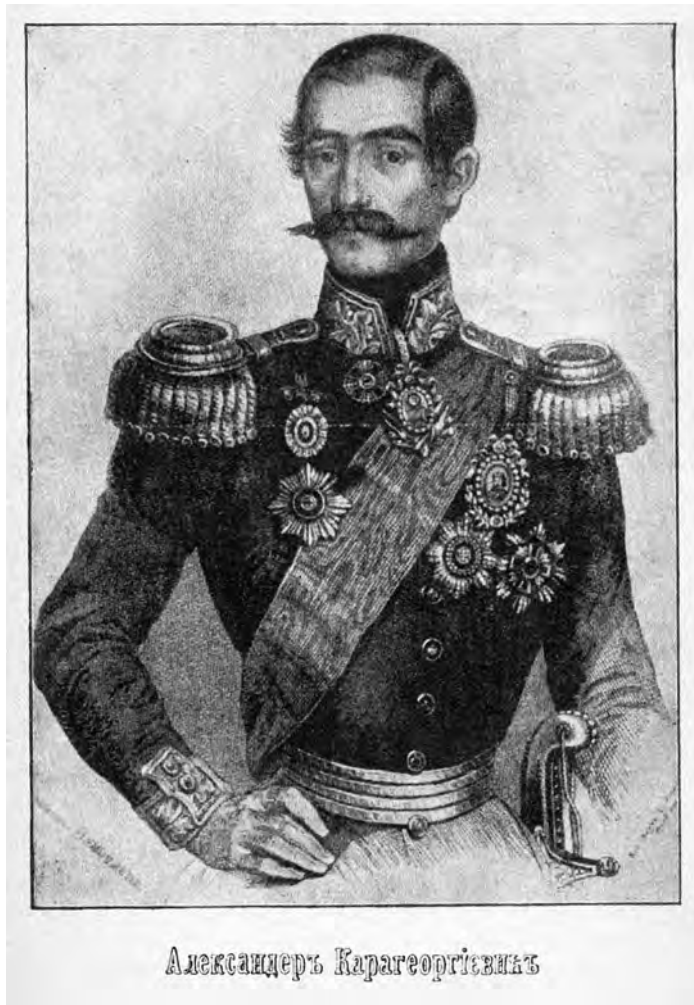
Сл. 4. Портрет Александра Карађорђевића; рад Анастаса Јовановића из 1848.

садашње Народне банке ћошак, где је сад Касина; пак даље ћошак код Делијске чесме па наниже одприлике да садашње куће Радуловића 16 . „Тај Делијски конак је био по обично турски зидан и већ склон паду а (кад је) порушен буде то врло велико место, доцније поклоњено књазу Карађорђевићу, који је доцније претворио у башчу и сазидао кућу на оном месту гди је била Татарска кафана.“ 17