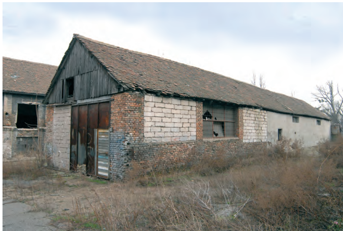
Сл. 6. Водена барака, саграђена 1950. године на месту где су подигнута вешала за егзекуцију логораши, између објеката 1 и 2

предвиђао је рушење свих затечених објеката на том простору. Тим поводом стручњаци Завода за заштиту споменика културе града Београда израдили су елаборат конзерваторских услова за овај простор. На стручном већу ЗССКГБ поводом пројекта станице „Југ“ била су изражена два става: