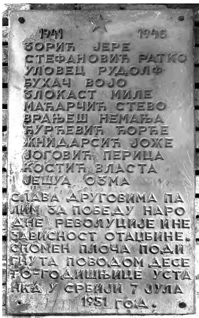
Сл. 3. Спомен-обележје на објекту 1