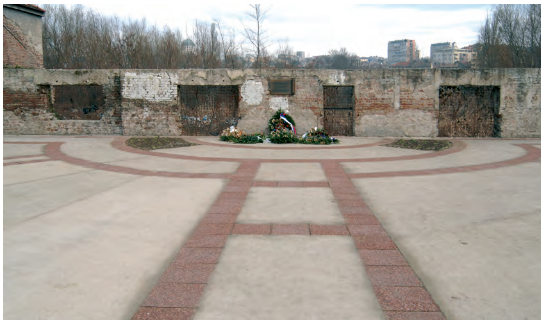
Сл. 4. и 5. Меморијал и спомен-обележје страдалим Јеврејима и Ромима