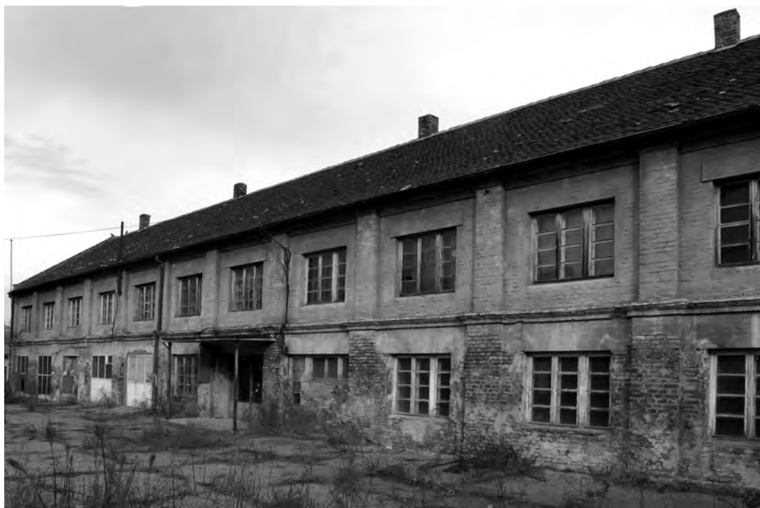
Сл. 2. Логорски објекат 1

стратишта симболишу ово време страховладе и масовне насилне смрти. Према досадашњим истраживањима, на тлу Краљевине Југославије у Другом светском рату организован је 71 концентрациони и сабирни логор, 329 истражних и других затвора, а држављани Краљевине Југославије били су у 69 логора и њихових подручних логора ван земље.