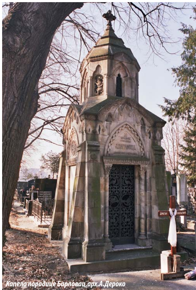
Капела породице Барловаци, арх. А. Дероко

Због готово немерљивих свеукупних вредности, Ново гробље у Београду има статус споменика културе од великог значаја за Републику Србију.