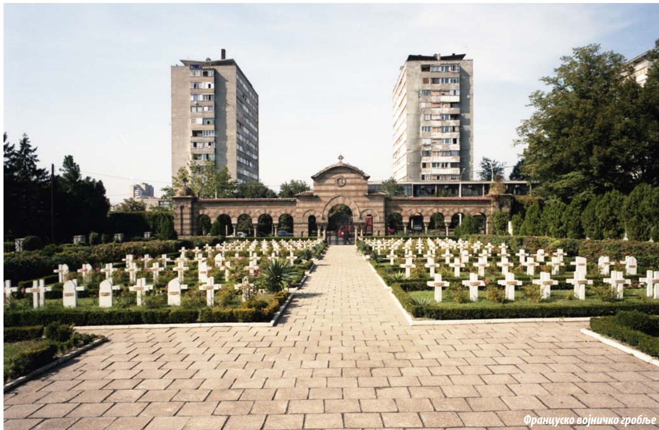
Француско војничко гробље

„Гробља и гробна места су одувек била култна места. Места за сахрањивање, без обзира на различитост епохе и цивилизације, била су препозната као табуисани простори. Реакција човека на гробља је одувек имала двојако значење. Гробље као простор са апотропејском наменом и гробље као место језе и страха, постали су део наслеђа колективне свести човечанства“