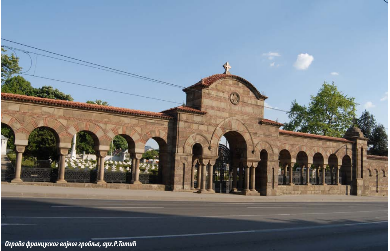
Ограда француског војног гробља, арх.Р.Татић

“Cemeteries and burial places have always been cult places. Places for burial, regardless of the diversity of epoch and civilization, were identified as tabooed spaces. The response of man to the cemeteries has always had a dual meaning. Cemetery as a place with apotropaic purpose and cemetery as a place of terror and fear have become part of the heritage of collective consciousness of mankind”(1)