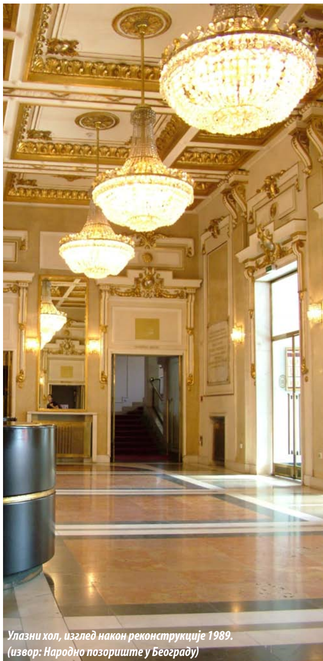
Улазни хол, изглед након реконструкције 1989.

Међутим, недовољно велики простор позорнице, као и низ техничких потешкоћа, допринели су да је већ 1912. године отпочела реконструкција објекта, која је због избијања Првог светског рата трајала све до 1921. године. Према замисли архитекте Јосифа Букавца, прочишћеност и хармоничност првобитне зграде замењена је наглашено необарокним изгледом фасада, чију улазну партију истичу две угаоне куле за степеништа. Том приликом, ентеријер здања додатно је украшен декоративним и гипсаним радовима на зидовима гледалишта и улазног хола, као и сликаним декорацијама које је на таваницама извео руски сликар Стјепан Фјодорович Колесников. Занимљиво је да се уметник, иако васпитан у традицији руског академског реализма, определио за