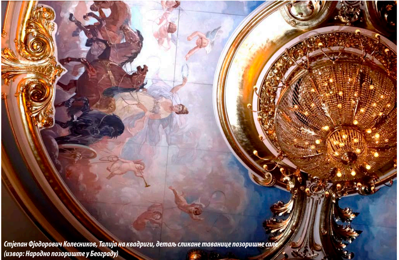
Стјепан Фјодорович Колесников, Талија на квадриги, детаљ сликане таванице позоришне сале

One of the richest and largest palaces in Belgrade in the second half of the nineteenth century - National Theatre – is located at the corner of Vasina and Francuska Street. With the raising of this building as well as with the implementation of the Regulations Plan of Town in Trench by Josimović from 1867, the conditions were made for the formation of today's main Republic Square in Belgrade. Built back in 1868, the National Theatre, following the