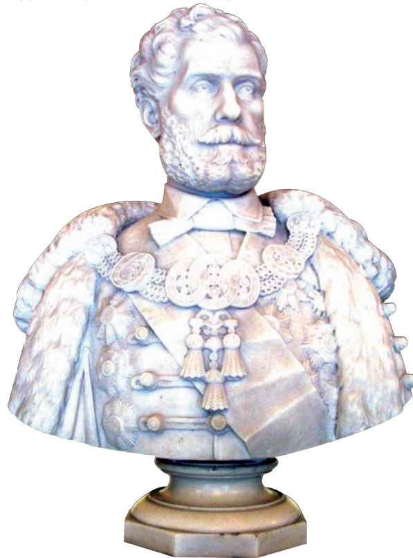
Енрико Паџи, Кнез Михаило Обреновић, 1872.

културе и традиције, али и као стварни светионик српске духовности у будућности. Због својих културних, историјских, архитектонских, урбанистичких, уметничких и естетских вредности, Народно позориште у Београду утврђено је за културно добро од великог значаја 1983. године.