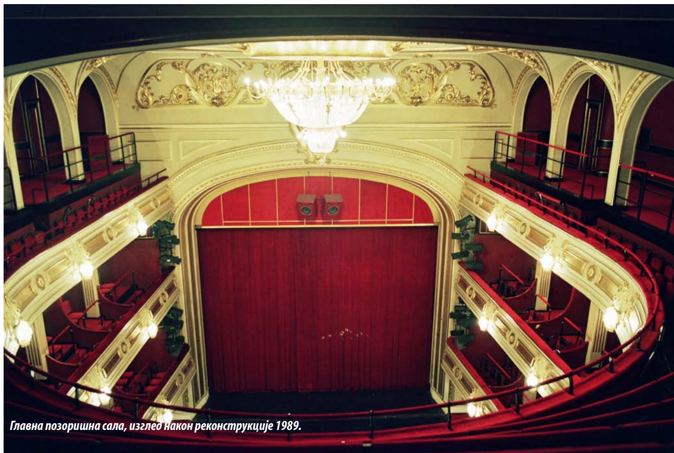
Главна позоришна сала, изглед након реконструкције 1989.

of the audience contributed the light of the "chandelier with hundreds of candles." Painted stage curtains, made according to the designs of renowned local artists, which themselves were a kind of artwork, represented a special segment of the theatrical decor. The lighting of the stage and of the entire theater was provided by a gas station - gasara , located in an abandoned Kara Mosque at the corner of Dositejeva and Braće Jugovića Street.