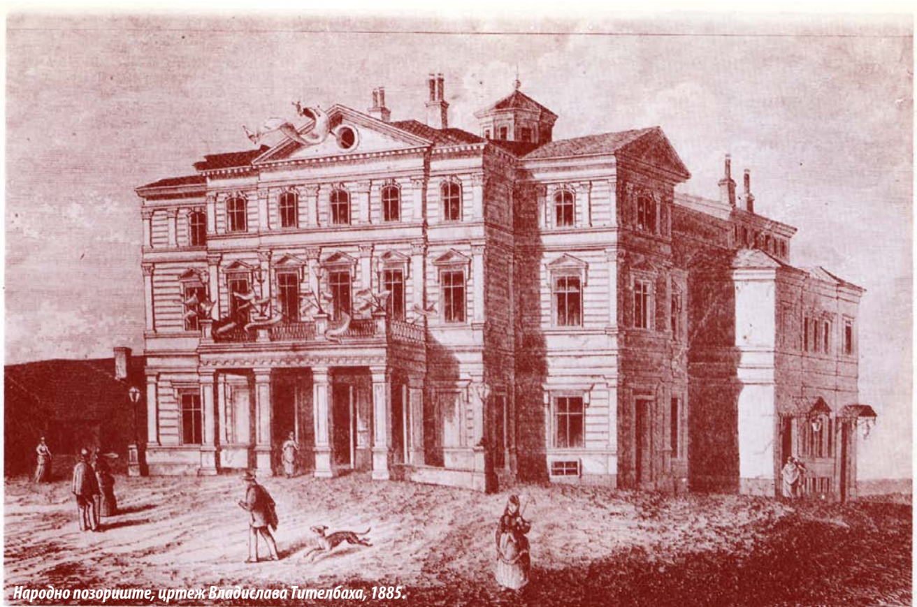
Народно позориште, цртеж Владислава Тителбаха, 1885.

Једна од најраскошнијих и највећих београдских палата из друге половине деветнаестог века – Народно позориште – смештена је на углу Васине и Француске улице. Подизањем овог објекта и реализацијом Јосимовићевог Плана регулације вароши у шанцу из 1867. године створени су услови за формирање данас главног београдског трга, Трга републике.