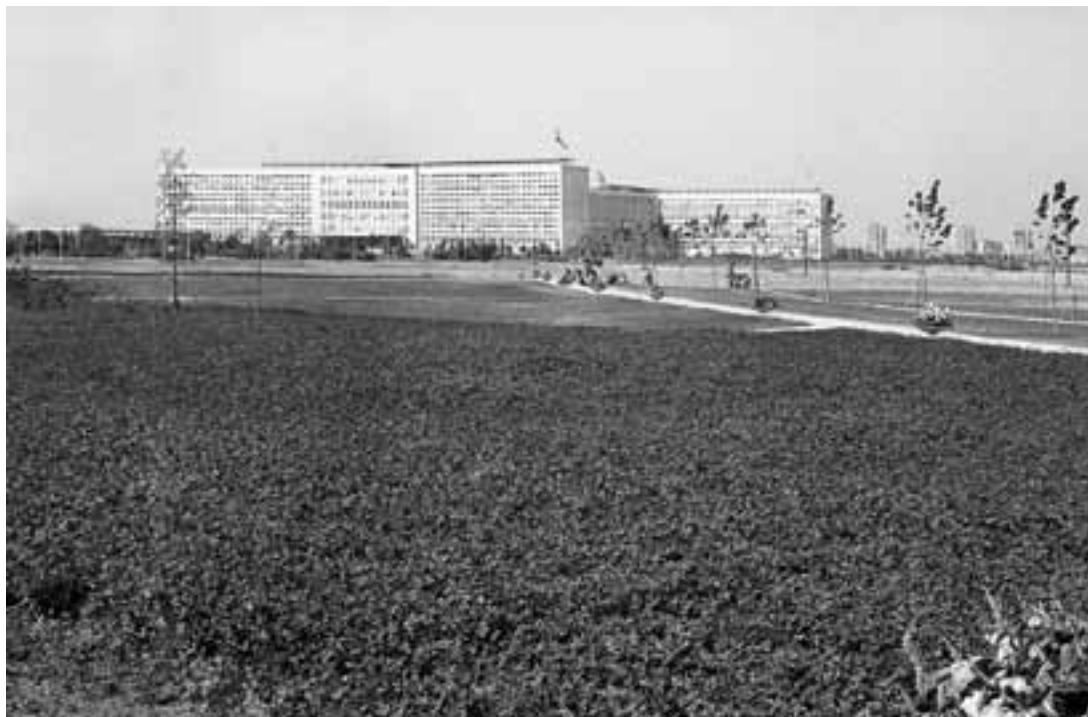
Сл. 1. Парк пријатељства, млади јорани са засађеним илаианима

и тежњи модерниста да подигну савремен град по мери човека са друге стране, с временом постао спецификум послератног урбанизма тесно везан за један политички систем и идеологију.