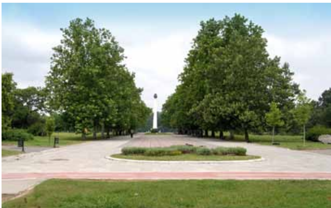
Сл. 5. Данашњи изглед Парка пријатељства са Алејом мира

конференције засадили су исту биљку – платан. Избор платана лежи у њиховој дуговечности, што потенцира идеју о успостављању трајног мира у свету. Поред сваког засађеног дрвета постављена је плоча са именом државника и земље из које долази, годином сађења и латинским називом дрвета Platanus acerofolia . Саднице платана су постављене на удаљености од осам метара да би се на одређеној висини свог раста спојиле и тако формирале јединствен зелени низ који је такође носио симболику о повезаности свих народа кроз заједничку идеју. 46 Од конкурсног решења до данас реализовано је само 9,5 ха парковске површине. Иако је од оригиналне замисли архитекте Палишашког мало тога изведено 47 , у основи се и данас сагледава специфичност у формирању једног модерног парка.