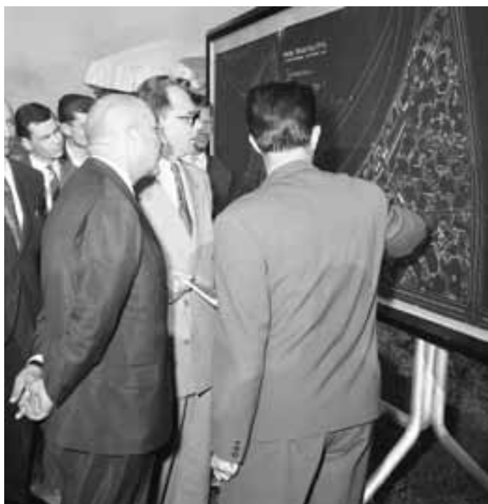
Сл. 2. Стиране делегације које у Парку посматрају идејно решење Владете Ђорђевића 1961. године

архитеката и градитеља након Другог светског рата. 8 Године 1947. на левој обали Саве, испред ушћа рукавца Саве у Дунав, формирана је мања шума од различитих врста високог дрвећа. 9 Рад на озелењавању је започет на простору између будућег хотела „Југославија“ и Бранковог моста, као и простора око будуће зграде СИВ-а. Неколико година касније отпочело је уређивање Парка уметности, где је 1965. године изграђен Музеј савремене уметности.