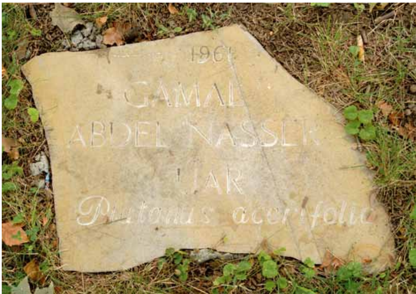
Сл. 6. Плоча државника исјод илалана

бронзи, у којем је на дан откривања споменика запаљена ватра. 50 Свечаности и церемонији паљења ватре и откривања обелиска присуствовали су тадашњи представници државне и војне власти и бројни грађани. 51 Том приликом Парк је добио централно обележје, а постављене су и дрвене клупе дуж Алеје мира.