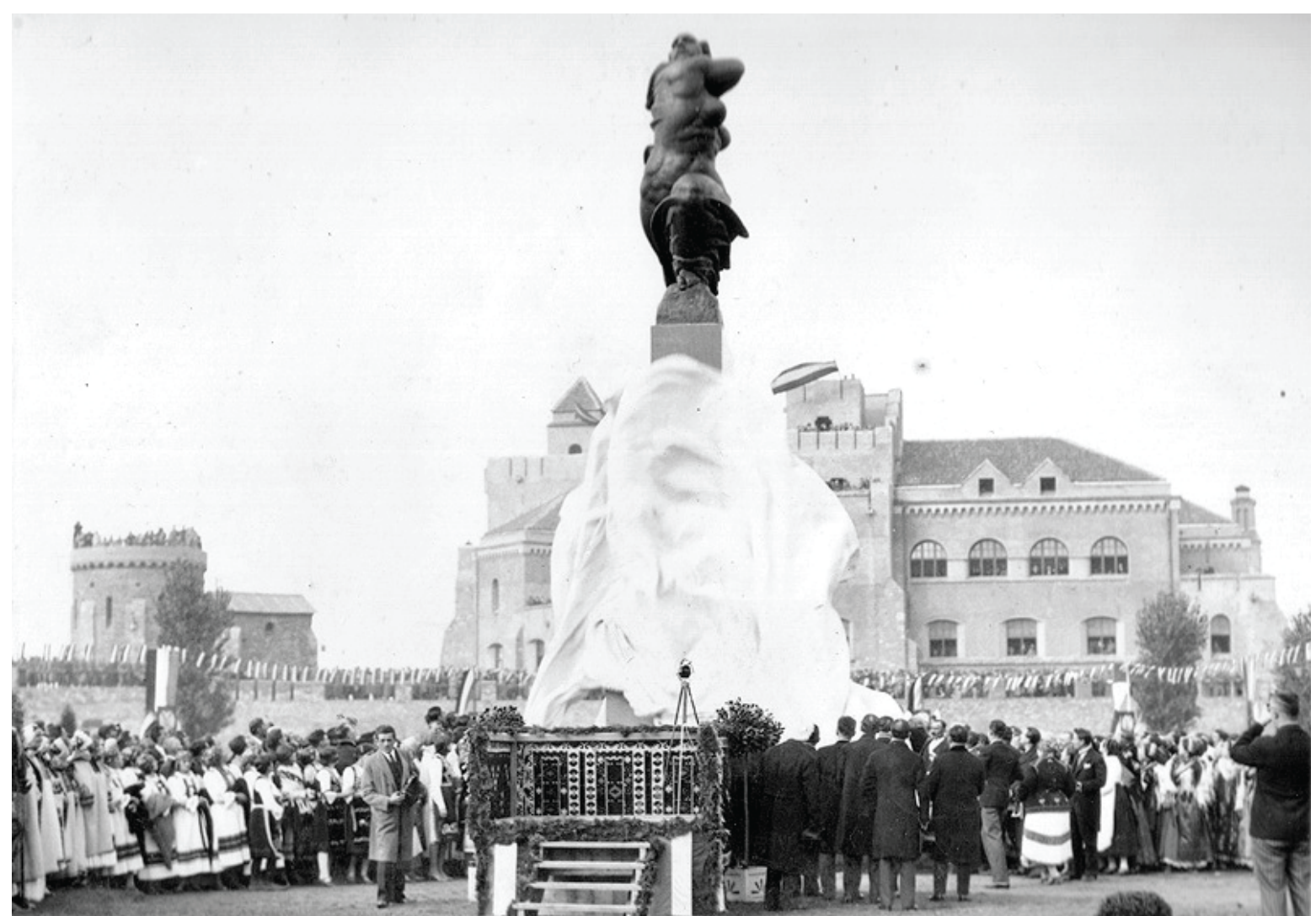
1930. ГОДИНА YEAR 1930