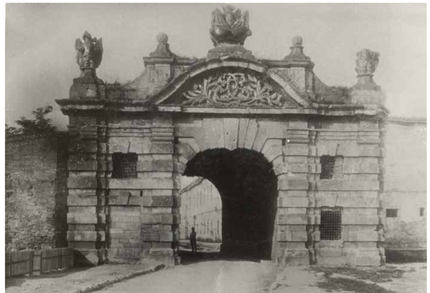
ПОЧЕТАК 20. БЕКА BEGINNING OF THE 20TH CENTURY