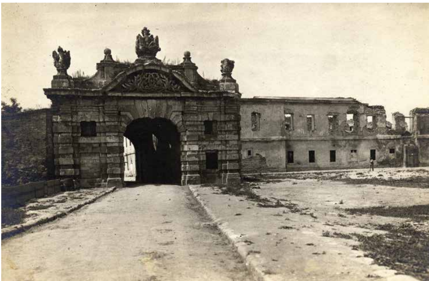
1917. ГОДИНА YEAR 1917

THE FAÇADE'S CENTRAL ORNAMENT IS FLANKED BY THE KNIGHTLY ARMOUR OF GLORY, INSIGNIA OF VICTORY AND THE ACHIEVED PEACE, AND IN THE CENTRAL AXIS THERE IS A SUIT OF ARMOUR WITH FLAGS AND WAR DRUMS. THE INNER FAÇADE, LEADING FROM THE FORTRESS TO THE TOWN, SIGNIFIED THE HABSBURG CLAIMS TO RULE OVER SERBIA: ABOVE THE DOORWAY THERE IS A CARTOUCHE WITH THE COAT OF ARMS OF SERBIA AS AN AUSTRIAN CROWN COUNTRY - A BOAR'S HEAD PIERCED WITH AN ARROW.