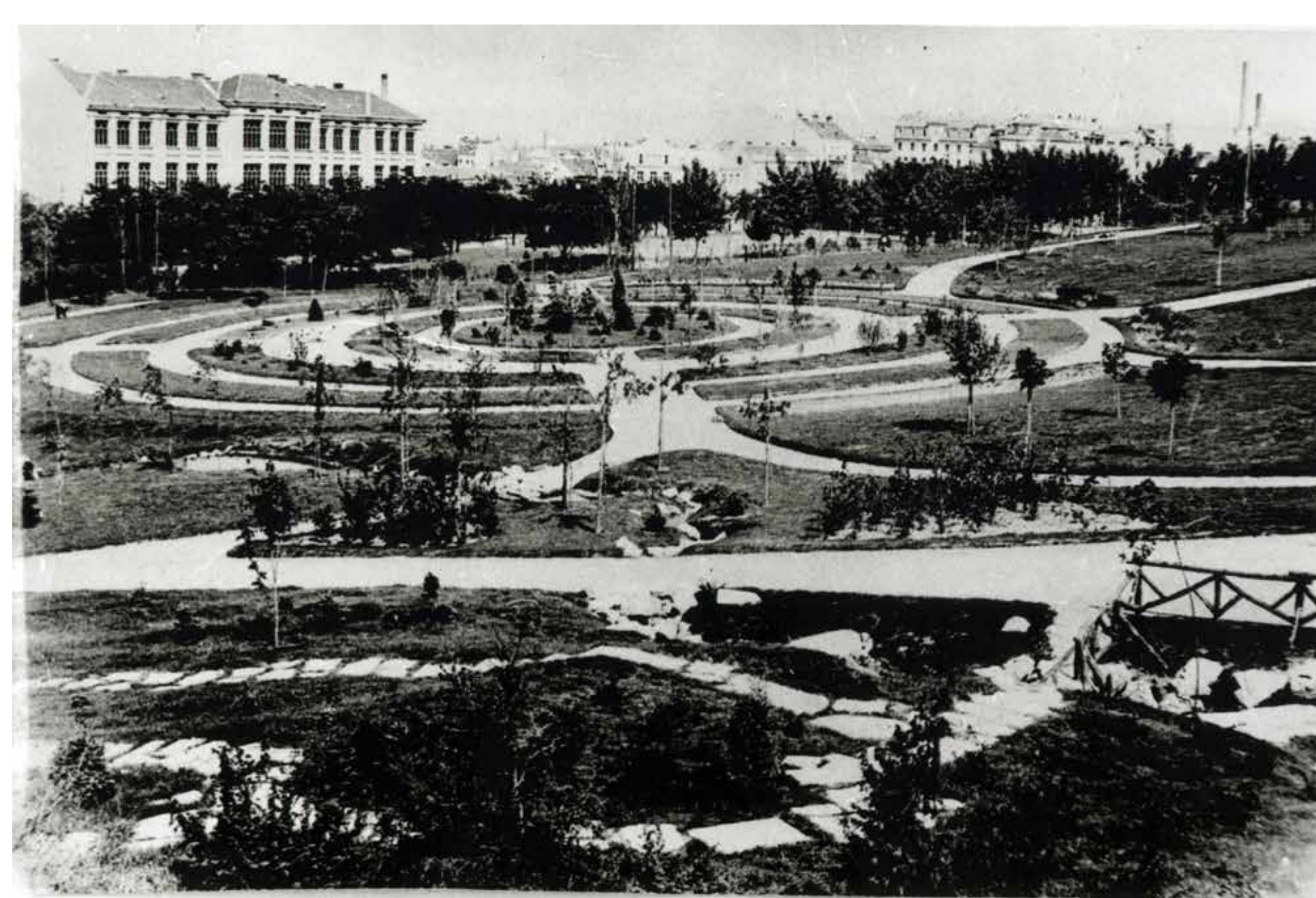
■ ПЕРИОД ИЗМЕЂУ ДВА РАТА ■ PERIOD BETWEEN TWO WARS