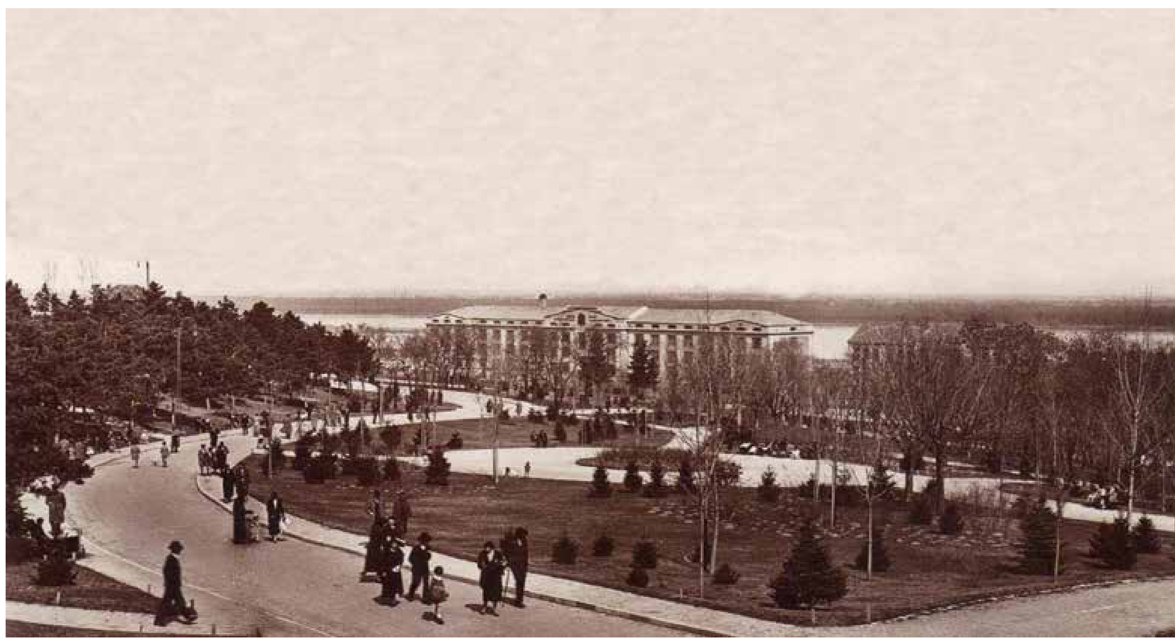
■ ПЕРИОД ИЗМЕЂУ ДВА РАТА ■ PERIOD BETWEEN TWO WARS