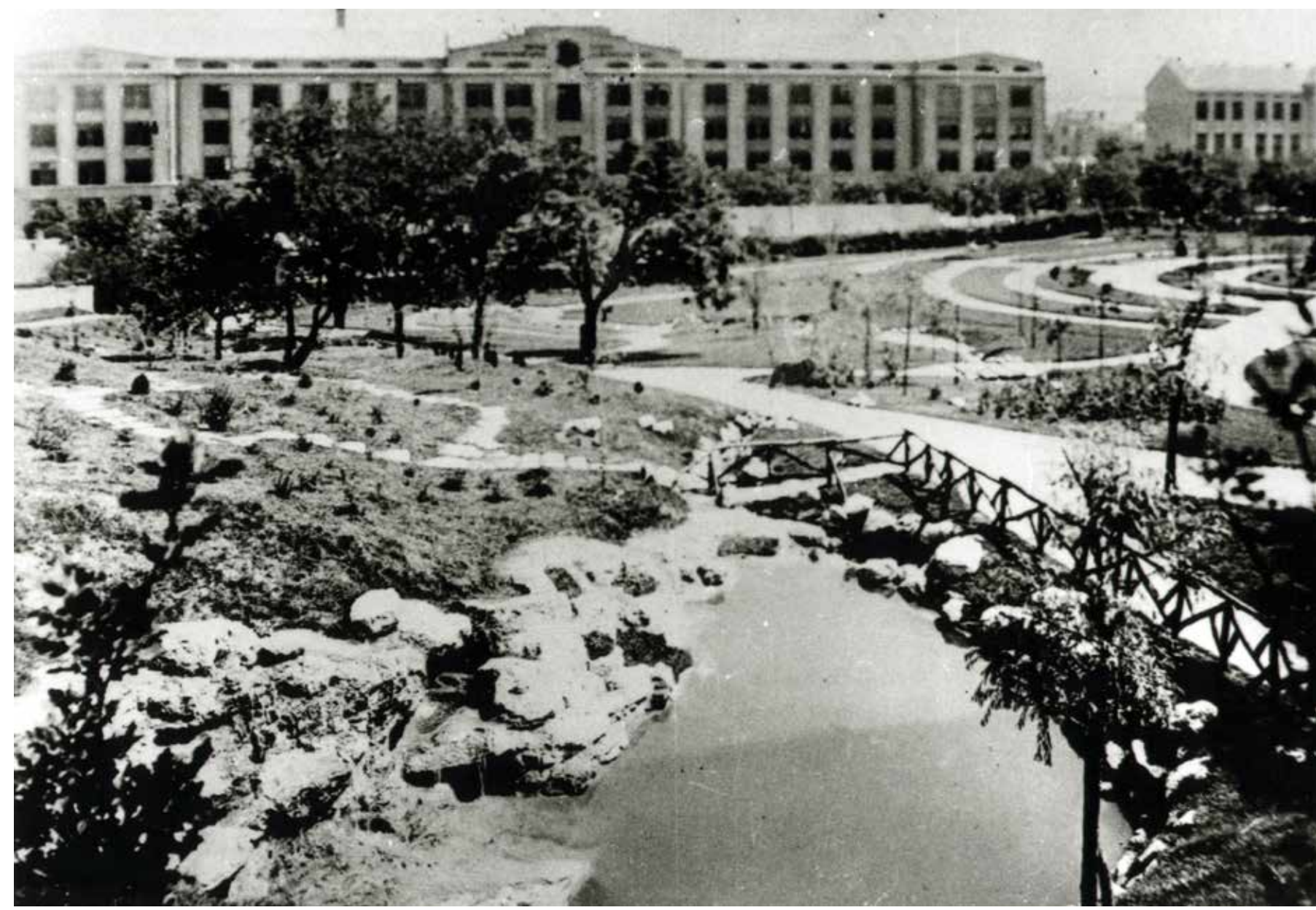
■ ПЕРИОД ИЗМЕЂУ ДВА РАТА ■ PERIOD BETWEEN TWO WARS

THE SPATIAL CONCEPT OF THE PARK'S DESIGN RESTED ON UTILISING THE TERRAIN SLOPES, WITH ARBORED WALKS IN THE PARK AND THE FORTRESS AND THE PROMINENT WIDE SPACE WITH A CIRCULAR FLOWER BED IN THE MIDDLE OF IT. THE ARTIFICIAL RIVER WITH THE LAKE MADE THIS AREA PARTICULARLY ATTRACTIVE. FROM THE 1910 PLAN OF THE FORTRESS AND THE PARK IT CAN BE SEEN THAT THE LATTER WAS ARRANGED MOSTLY IN LINE WITH LEKO'S ORIGINAL SPATIAL CONCEPTION. IN THE ORGANISATION OF THE PARK AFTER WORLD WAR I, THE AREA OF THE PRESENT-DAY ZOO SERVED AS A MUNICIPAL NURSERY GARDEN. IN 1928-29 THIS PART OF THE PARK SAW THE CONTINUATION OF INTENSIVE WORKS, NOW ACCORDING TO THE PROJECT BY THE ENGINEER ALEKSANDAR KRSTIĆ. IT WAS MADE A CHILDREN'S PLAYGROUND, TO BE REPLACED WITH A ZOOLOGICAL GARDEN IN 1936. ESPECIALLY IMPORTANT ELEMENTS IN THE PARK ARE PUBLIC SCULPTURAL MONUMENTS, SUCCESSIVELY ERECTED IN THE 20TH AND 21ST CENTURIES. THE MOST SIGNIFICANT BUILDINGS ARE THE CVIJETA ZUZORIĆ ART PAVILLION, BUILT IN 1928 AFTER THE PROJECT OF THE ARCHITECT BRANISLAV KOJIĆ, AND THE ADMINISTRATIVE BUILDING OF THE PARK'S MANAGEMENT (PRESENT-DAY SEAT OF THE COMMUNAL COMPANY 'ZELENILO - BEOGRAD'). POSTDATING THE GREAT KALEMEGDAN PARK BY SEVERAL DECADES, THE AREA OF LITTLE KALEMEGDAN REFLECTS A SOMEWHAT MORE MODERN CONCEPTION OF PARK DESIGN.