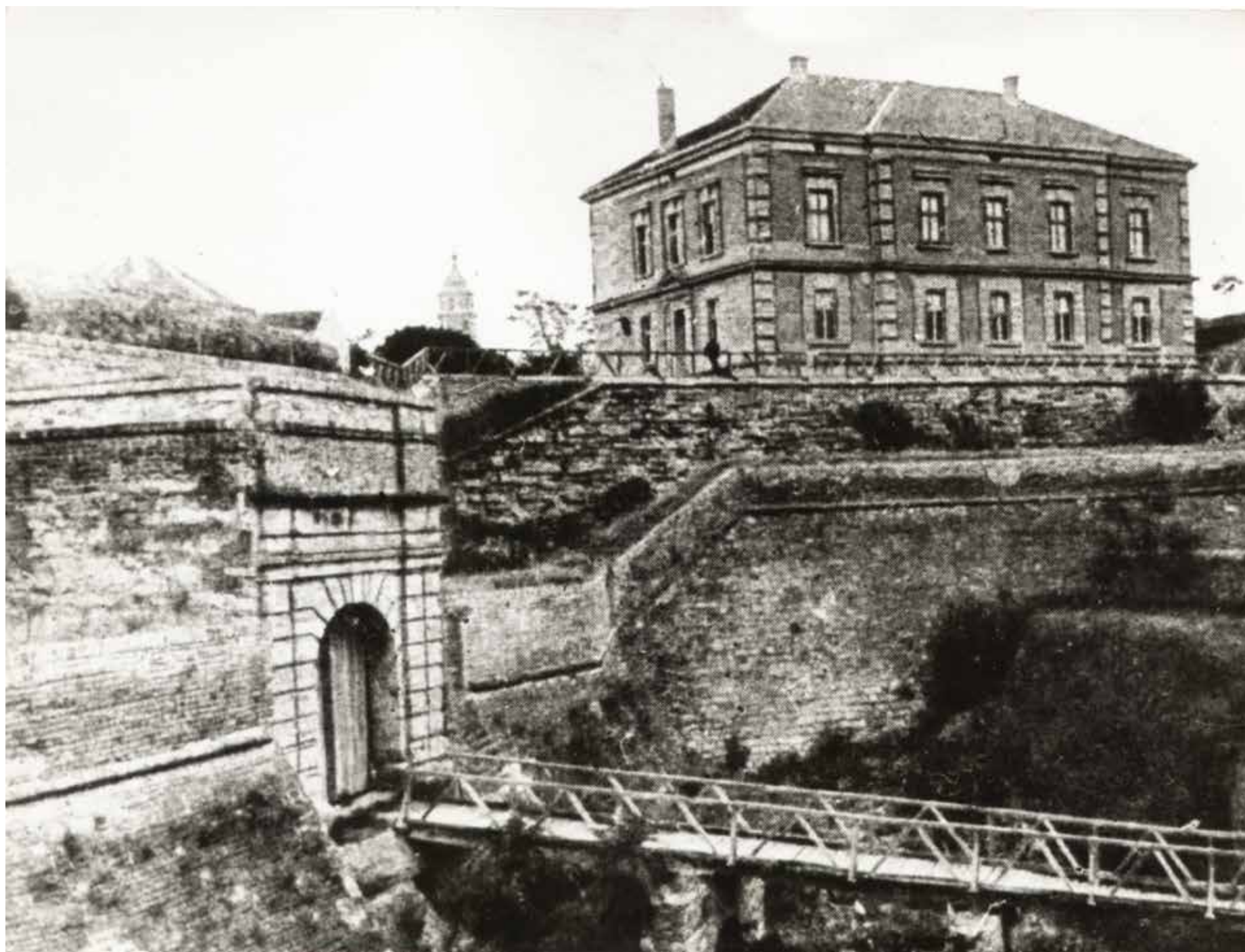
■ ПРЕ 1904. ГОДИНЕ ■ BEFORE YEAR 1904

THE ORIGINAL BUILDING WAS CONSTRUCTED IN THE STYLE OF ACADEMICISM, WITH A CHARACTERISTIC THREE-PART DIVISION OF SPACE, RUSTICALLY FINISHED CORNER STONES AND DISCRETE ELEMENTS OF ARCHITECTURAL SCULPTURE. AFTER THE 1919-20 RECONSTRUCTION IT ASSUMED THE STYLE OF A TRADITIONAL 19TH-CENTURY BALKAN TOWNHOUSE, BUILT AS A HALF-TIMBERED STRUCTURE.