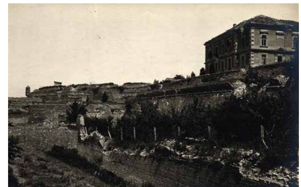
■ 1916. ГОДИНА ■ YEAR 1916