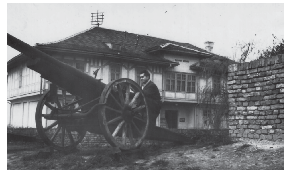
■ 1937. ГОДИНА ■ YEAR 1937