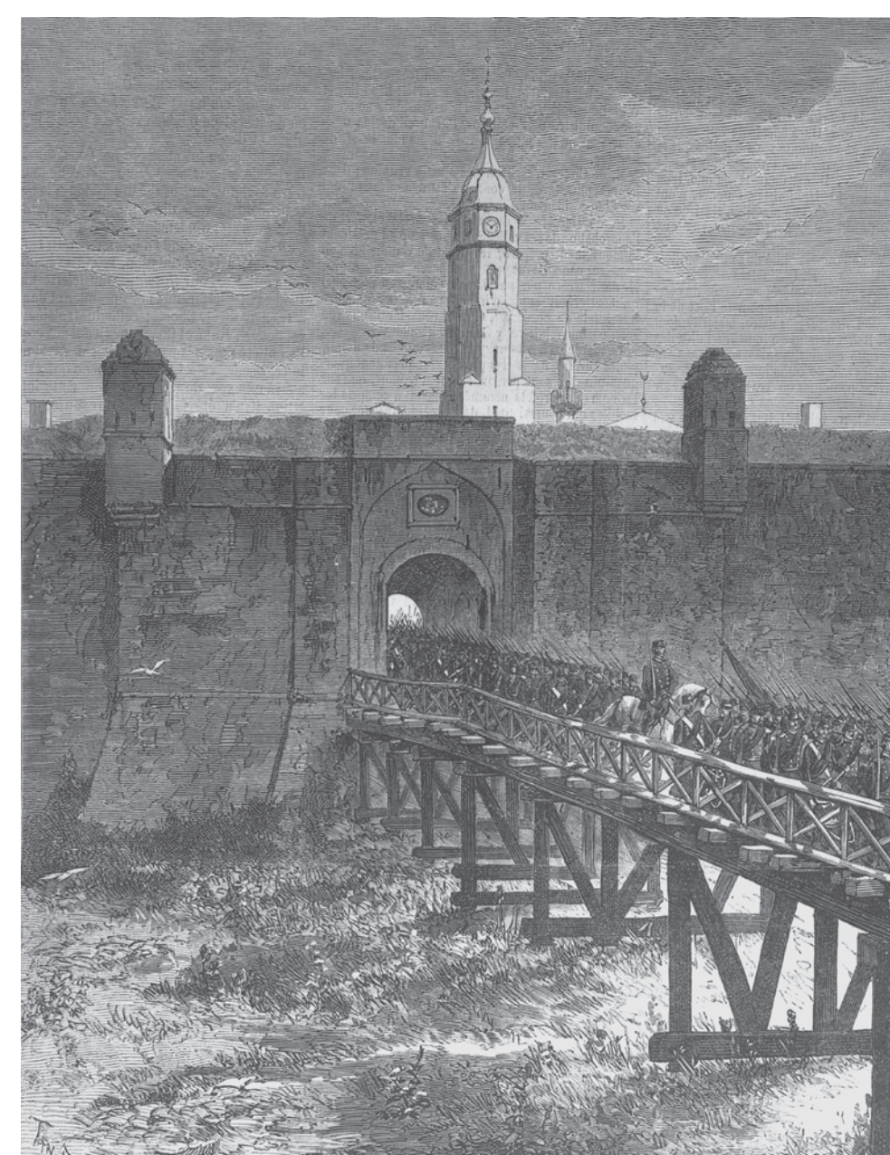
ЦРТЕЖ, 1876. ГОДИНА DRAWING, YEAR 1878