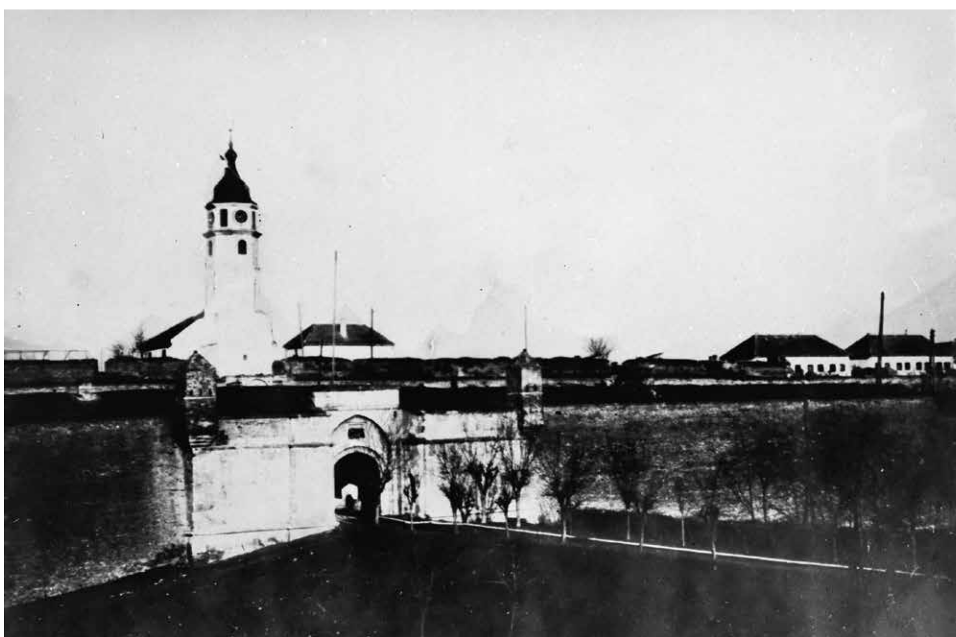
1920. ГОДИНА YEAR 1920

БАСТИОНИ I И II ЈУГОИСТОЧНОГ ФРОНТА НАЛАЗЕ СЕ У ГОРЊЕМ ГРАДУ БЕОГРАДСКЕ ТВРЂАВЕ. ИЗГРАЂЕНИ СУ У ТОКУ ТРЕЋЕ РЕКОНСТРУКЦИЈЕ БЕОГРАДСКЕ ТВРЂАВЕ, У ПЕРИОДУ ОД 1740. ДО 1791. ГОДИНЕ, КАДА ЈЕ ТВРЂАВА ПРЕШЛА ПОД ТУРСКУ УПРАВУ. НАКОН ПОТПИСИВАЊА УГОВОРА О ПРИМИРЈУ 1739. ГОДИНЕ, ТУРСКА ЈЕ ЗАДРЖАЛА СТАРУ ОДБРАМБЕНУ КОНЦЕПЦИЈУ, УСТАНОВЉЕНУ ТОКОМ БАРОКНЕ РЕКОНСТРУКЦИЈЕ 1717–1739, ТАКО ДА СУ ПОНОВО ПОДИГНУТА ДВА СИМЕТРИЧНО ПОСТАВЉЕНА БАСТИОНА, ПОВЕЗАНА КУРТИНОМ, СА ОРИЉОНИМА И ПОЛУКРУЖНО УВУЧЕНИМ ФЛАНКАМА. НА ОРИЉОНУ БАСТИОНА I ЈУГОИСТОЧНОГ ФРОНТА НАЛАЗИЛА СЕ ОСМАТРАЧНИЦА, А ДУЖ ФАСА И ФЛАНКЕ БАСТИОНА БИЛЕ СУ ТОПАРНИЦЕ. БАСТИОН I ОЧУВАН ЈЕ У ИЗВОРНОМ СТАЊУ СВЕ ДО ПОСЛЕДЊИХ ДЕЦЕНИЈА 19. ВЕКА. ЗБОГ ВЕЛИКИХ ОШТЕЋЕЊА У ТОКУ БОМБАРДОВАЊА 1915. ГОДИНЕ, БАСТИОН ЈЕ У РАЗДОБЉЈУ ИЗМЕЂУ ДВА СВЕТСКА РАТА ОБНАВЉАН. НАЈВЕЋЕ ТРАНСФОРМАЦИЈЕ ДОЖИВЕО ЈЕ СРЕДИНОМ ДВАДЕСЕТИХ ГОДИНА ПРОШЛОГ ВЕКА, КАДА ЈЕ САГРАЂЕНА ЗГРАДА ВОЈНО-ГЕОГРАФСКОГ ИНСТИТУТА КРАЉЕВИНЕ СХС.