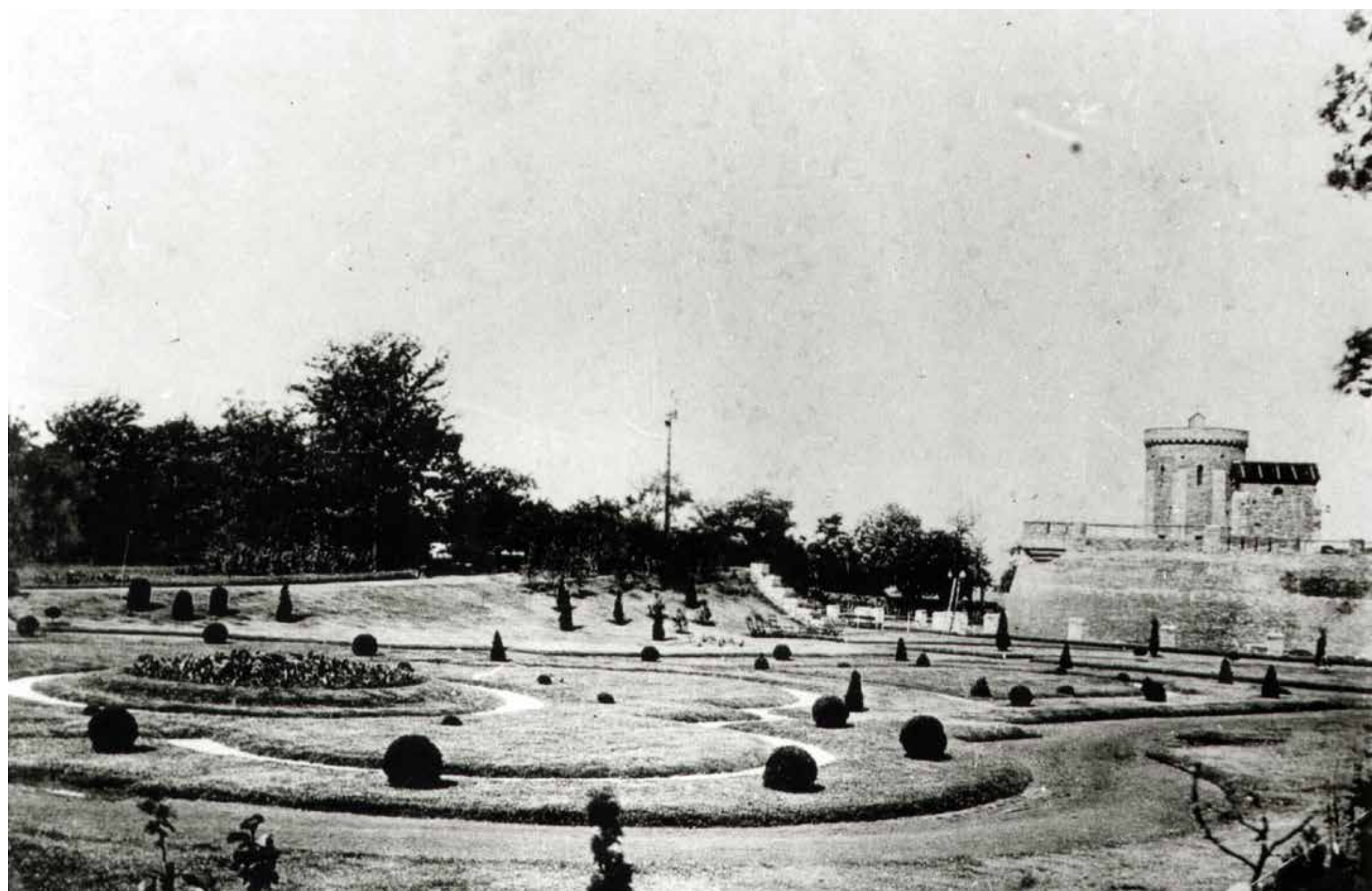
ТРЕЋА ДЕЦЕНИЈА XX ВЕКА THIRD DECADE OF THE 20TH CENTURY

ДАНАС СЕ У ОВОМ ВЕЛИКОМ ПАРКУ НАЛАЗЕ РАЗЛИЧИТИ САДРЖАЈИ: ШЕТАЛИШТА, СПОРТСКИ ТЕРЕНИ, УМЕТНИЧКИ ПАВИЉОН ЦВИЈЕТЕ ЗУЗОРИЋ, МУЗИЧКИ ПАВИЉОН, КАО И ЗООЛОШКИ ВРТ. НА ВЕЛИКОМ КАЛЕМЕГДАНА ПОСТАВЉЕНЕ СУ БРОЈНЕ СКУЛПТУРЕ И СПОМЕНИЦИ, КОЈИ ПОДСЕЂАЈУ НА ВАЖНЕ ИСТОРИЈСКЕ ТРЕНУТКЕ, АЛИ И ИСТАКНУТЕ ЛИЧНОСТИ СРПСКЕ УМЕТНОСТИ И КУЛТУРЕ, ПОПУТ КОМПОЗИТОРА СТЕВАНА МОКРАЊЦА, ВАЈАРА СИМЕОНА РОКСАНДИЋА, ТЕ КЊИЖЕВНИКА РАДОЈА ДОМАНОВИЋА, ВОЈИСЛАВА ИЛИЋА И БОРЕ СТАНКОВИЋА. СТОГА ЈЕ КАЛЕМЕГДАН СВОЈЕВРСНО ПРЕДВОРЈЕ БЕОГРАДСКЕ ТВРЂАВЕ, А ЊЕГОВА ИСТОРИЈА НЕРАСКИДИВО ЈЕ ВЕЗАНА ЗА ИСТОРИЈУ БЕОГРАДА.