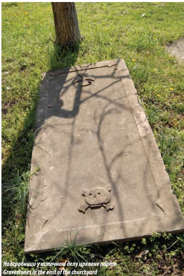
Надгробници у источном делу црквене порте Gravestones in the east of the churchyard

century. The throne icons on the iconostasis include: Saint Sava, Mother of God and child Jesus, Jesus Christ and Saint John the Baptist, while the upper sections of the iconostasis show the common depictions of the Great Feasts, apostles and scenes from the Old and New Testament.