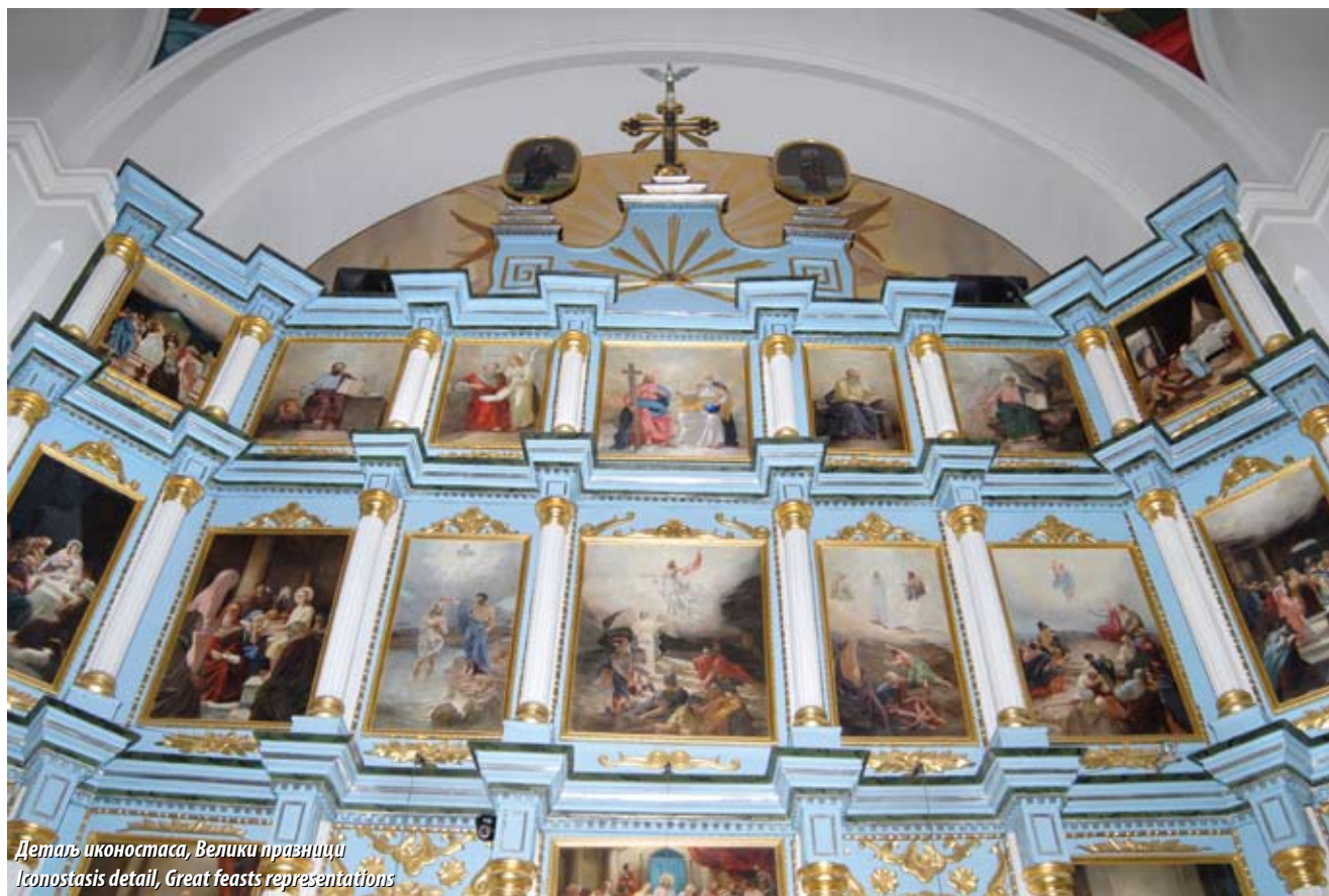
Детаљ иконостаса, Велики празници Iconostasis detail, Great feasts representations

In the name origin of the old settlement Palež, a several possible options emerge for consideration: paljus (wetland) or palus (kolje in english) used to build homes on the wetlands; another possibility is the name of the Pannonian goddess Pales, whose name was also the inspiration for naming the ancient Roman and later Slavic settlement in the area of Vodenički breg, on the right bank of the Sava river and in the plain near the confluence of Kolubara and Tamnava. During the Middle Ages and the reign of King Dragutin, this region belonged to the Grabovac Monastery. Up until the first Church of the Holy Spirit was constructed in 1824, Palež inhabitants prayed