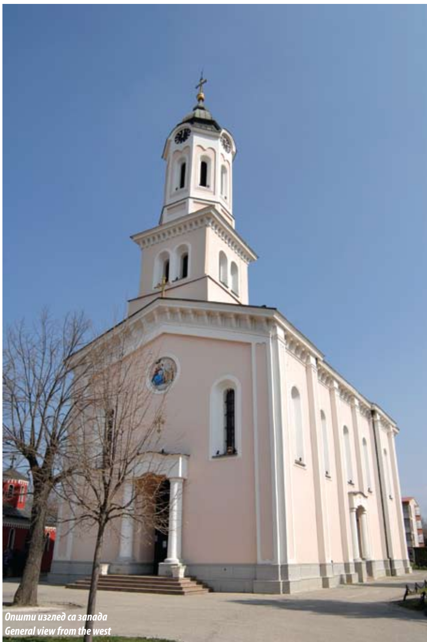
Opшти изглед са запада General view from the west

Црква Светог Духа је једнобродна грађевина без куполе, са споља петостраном апсидом на источној и предњом и унутрашњом припратом на западној страни. Изведена је по плановима Министарства грађевина Кнежевине Србије, као типска црква, слична