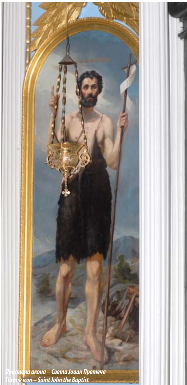
Престона икона – Свети Јован Претеча Throne icon – Saint John the Baptist

near the bell tower's top and the pilasters, indicate a variety of styles in the architectural modeling and decoration, by the use of elements of baroque classicism and romanticism. The church is vaulted with diagonal semicircular vaults. A dark green marble cladding was recently (2007) applied on the walls, up to the height of 3–3.5 m. The wall paintings on the church vaults and side walls, depicted by Ukrainian-Russian painter Yuriy Matichev in the period from 2004 to 2013, have been assimilated with the church iconostasis (from 1937), with the elements of West European baroque iconography, introduced in Serbian baroque painting of the 18 th century. The same style is applied for the recently elaborated mosaic patronal representation of the Holy Trinity, in a circular medallion on the western façade, depicting the Christ, the dove of the Holy Spirit as well as the God the Father.