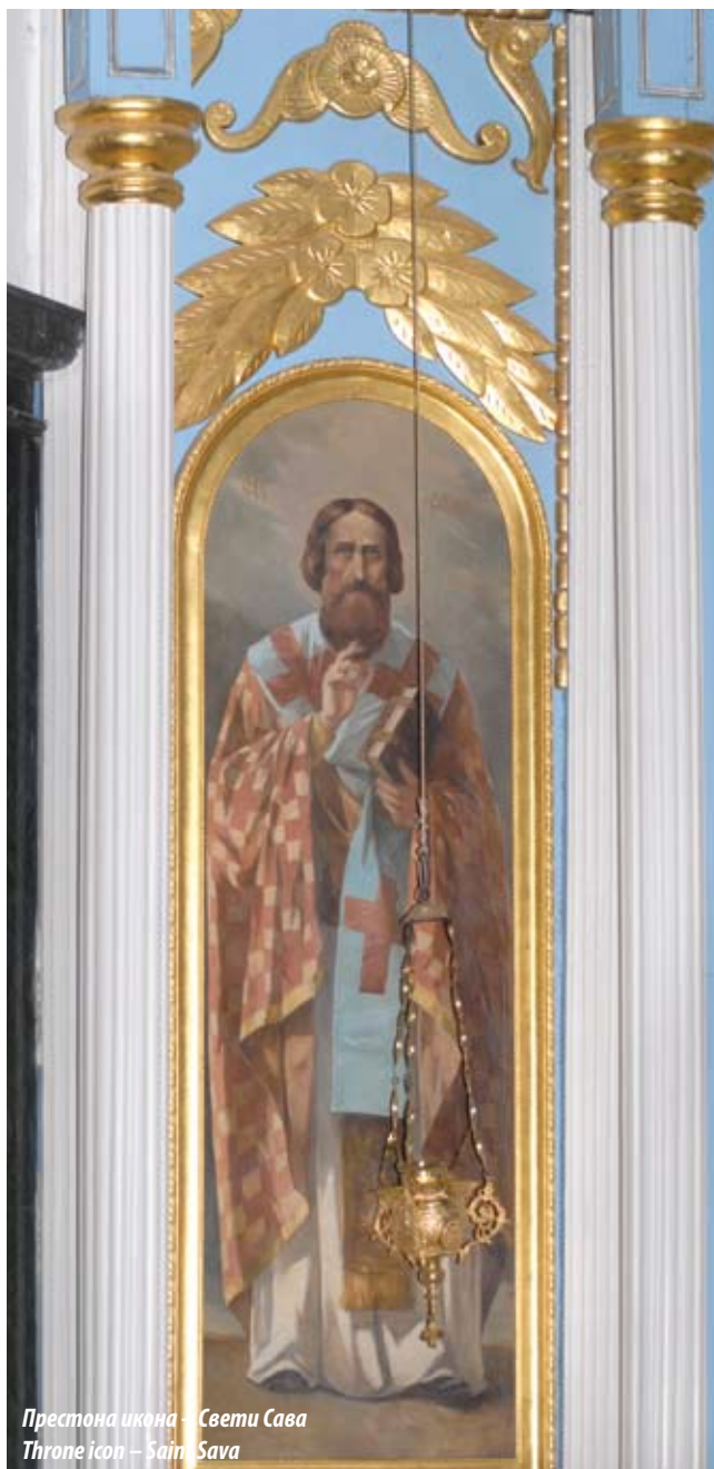
Престона икона – Свети Сава Throne icon – Saint Sava

The lateral facades between the widows are vertically divided by pilasters. Under the cornice and the cornice of the bell tower base, there is a series of consoles forming friezes which, together with the shallow arcades