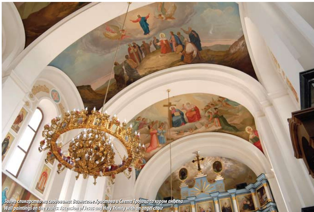
Зидно сликарство на сводовима: Вавнесење Христово и Света Тројица са хором анђела Wall paintings on the vaults: Ascension of Jesus and Holy Trinity with an angel choir

У пореклу назива старог места Палеж је неколико могућих имена: паљус (мочварно земљиште) или палус (коље) на коме су због таквог земљишта грађене куће, али и име панонске богиње Палес, по којој је названо и античко римско насеље, касније словенско на локалитету Воденички брег на десној обали Саве и на равници код ушћа река Колубаре и Тамнаве. У средњем веку, у време владавине краља Драгутина, овај крај је припадао манастиру Грабовац. Све до изградње прве цркве Светог Духа 1824. године, житељи Палежа су користили најближу цркву у селу Бреска, које је раније постојало на