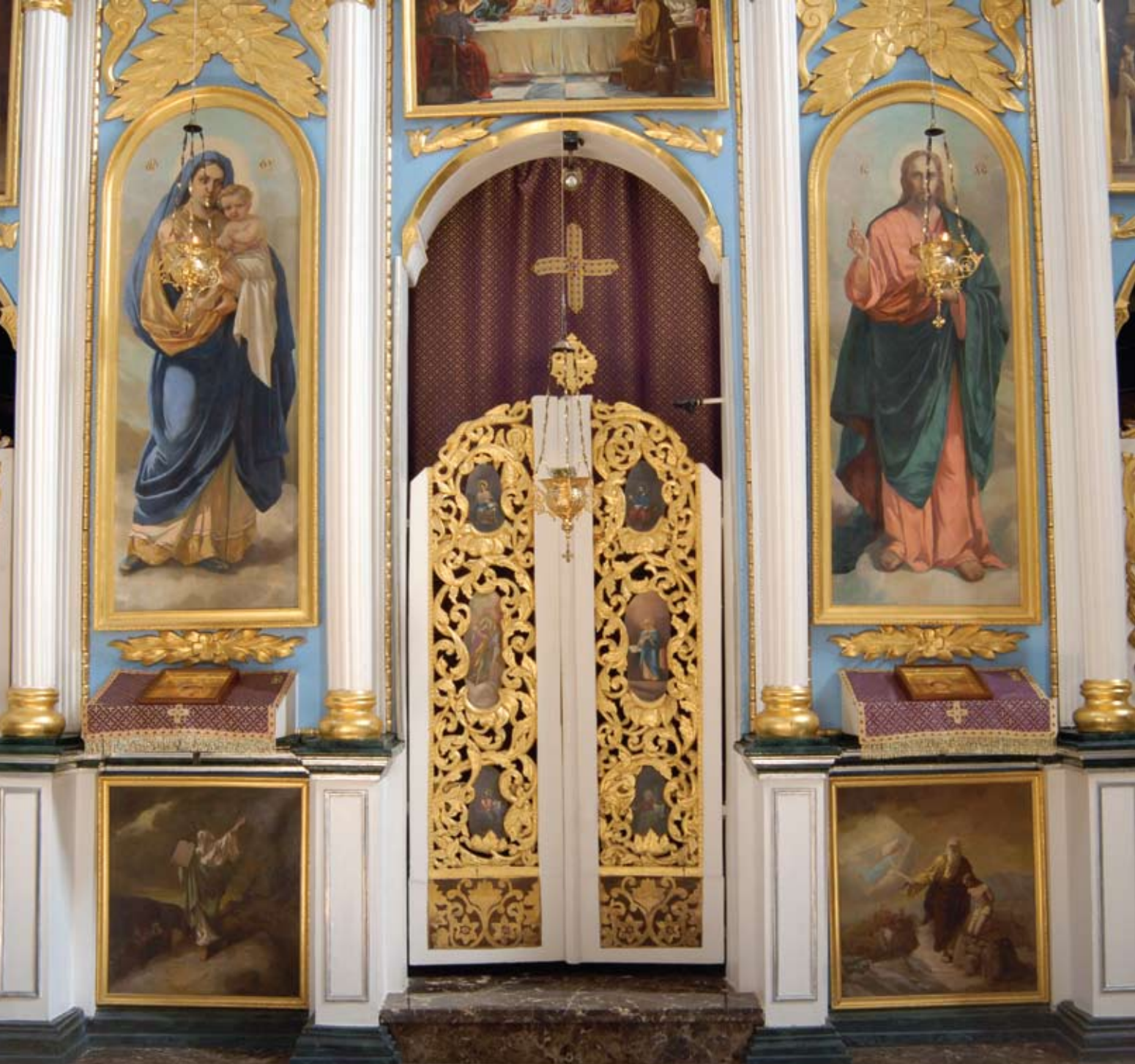
Деталь иконостаса, царские двери и престолы иконы Богородице и Христа Iconostasis detail, Holy doors and throne icons of Mother of God and Christ