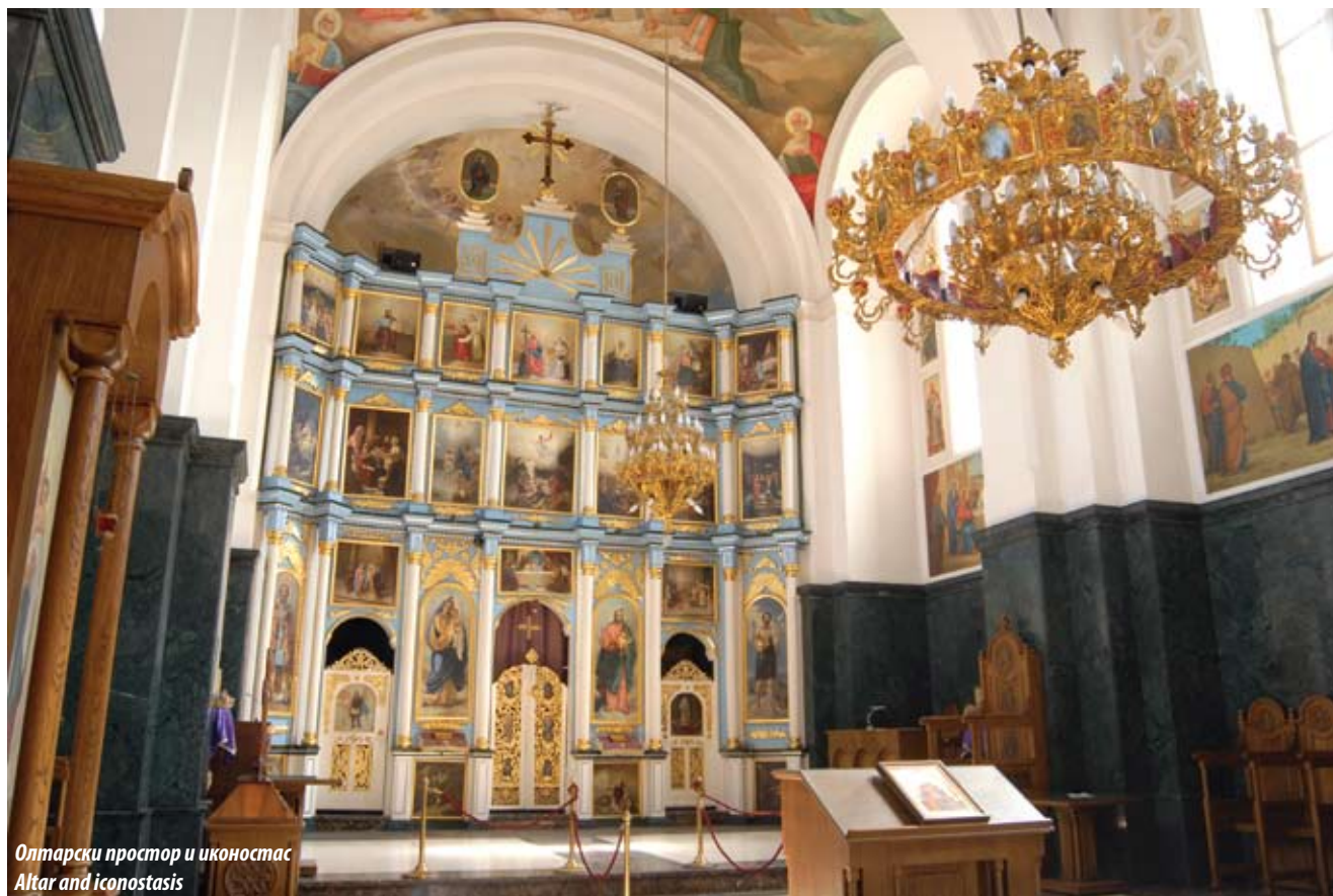
Олтaрски простор и иконостас Altar and iconostasis

многим сакралним грађевинама на територији Београда грађеним 60-их и 70-их година XIX века. Изразито је монументална, у основи је димензија 25x11 м, висина са звоником је 42 м, док је у унутрашњости висина 13 м. Над предњом припратом издиже се звоник са кубичним постољем и веома издуженим осмостраним тамбуром. Сви отвори на цркви су залучени, а на кубичном постољу куполе су и удвојени. На првом спрату звоника постављен је сатни механизам, а на врху испод калоте на све четири стране посебно су истакнути сатови залученим поткровним венцем и декорацијом стилизованих слепих аркадица. Појава сата на звонику потврђује изузетан значај ове цркве и посебно прометност раскршћа путева на коме је изграђена.