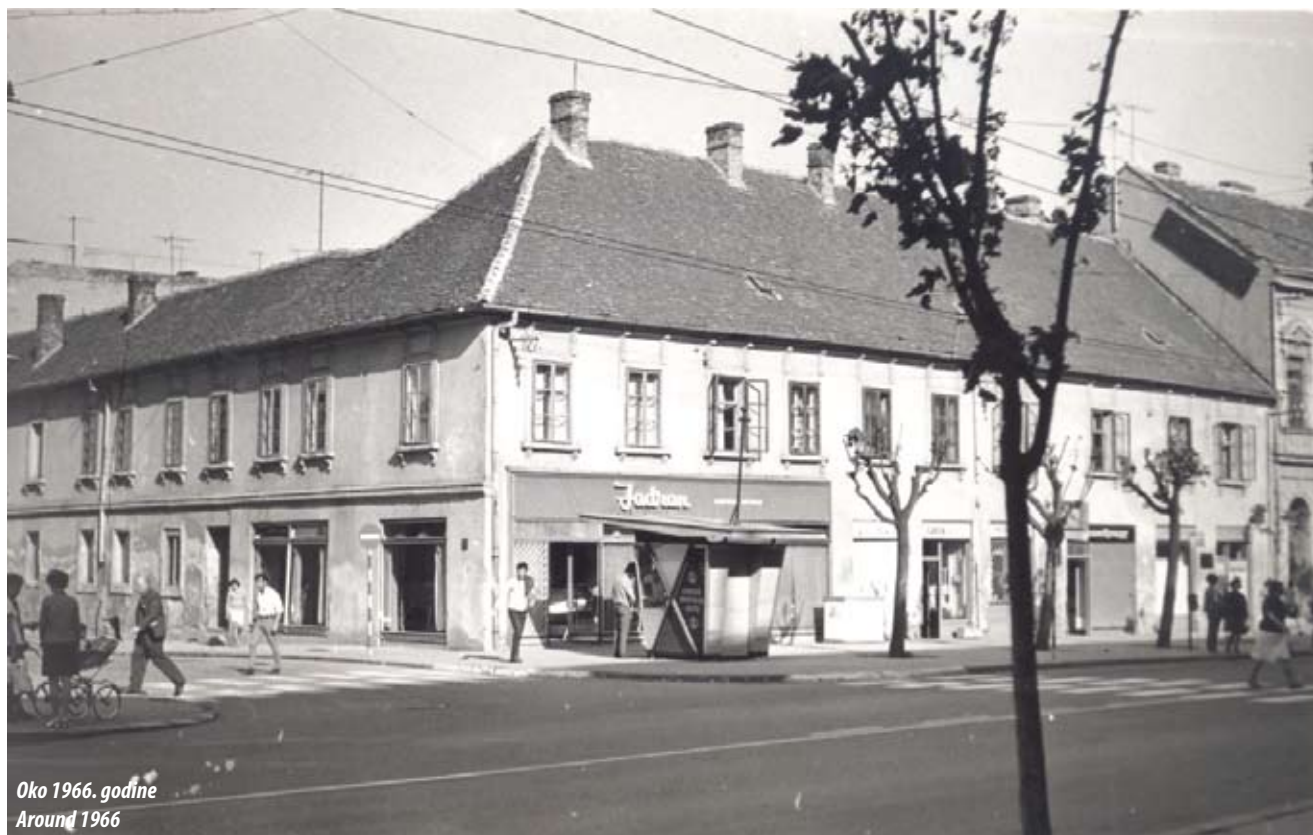
Okolo 1966. godine Around 1966

In the last decades of the 18th century, the building of Glavna straža (the City Guard) building and two houses were built in Glavna street no. 70 in Zemun, one of which was the property of the Zemun builder Jakob Vanja. The house is located on the corner of today's Glavna and Davidovićeva streets (before the Kanalska street), across the former Post Office building. The building conditioned the future regulation of Davidovićeva and part of Glavna streets 1 . This house, subsequently numbered 171 2 , is the birth place of Dimitrije Davidović 3 , the first Serbian journalist, law student, historian, diplomat and a statesman 4 , in the family of the Zemun merchant Gavrilo (David) Protić and his wife