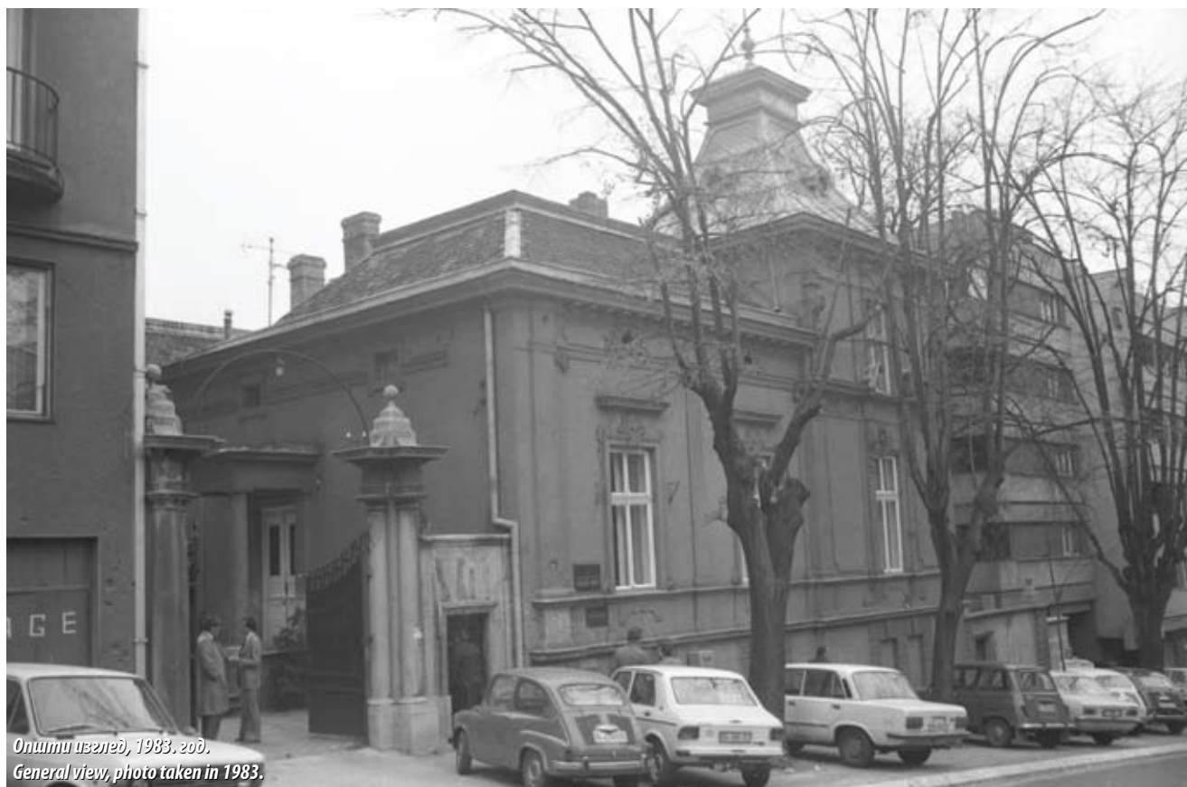
Општи изглед, 1983. год. General view, photo taken in 1983.

The significance of residential architecture in Belgrade at the transition from the 19th century to the 20th century is a known fact. Even though today it represents a minor segment of the construction fund, it carries a significant historical heritage that has its role in the constitution of the city's character and testifies to its past and development. From such perspective, we do not necessarily observe only individual architectural, stylistic or wider, ambient and urban values, but the architecture itself, as utilitarian art equally displays an important element of the overall social, economic and cultural image of the time. The house of the architect Jovan Ilkić brings about an individual segment of such architectural fund,