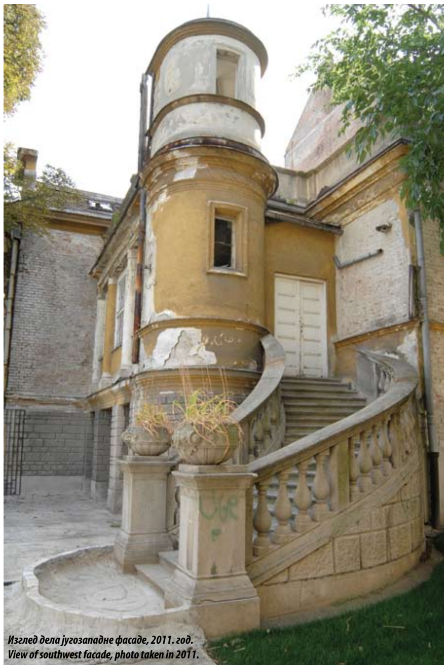
Изглед дела југозападне фасаде, 2011. год. View of southwest facade, photo taken in 2011.

Ипак, у овом сегменту архитектонског фонда Београда имена Александра Бугарског, Константина Јовановића и Јована Илкића заузимају најистакнутије место. Репрезентативне куће угледних грађана пројектоване су и подизане као приземне и једносратне, а касније се јављају и двосратне вишепородичне зграде, по угледу на средњоевропску академистичку традицију.