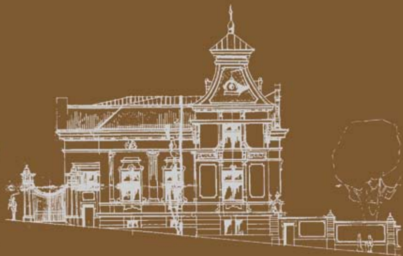
Улична фасада, план Павла Илкића из 1925. год. Street facade, design by Pavle Ilkić from 1925.