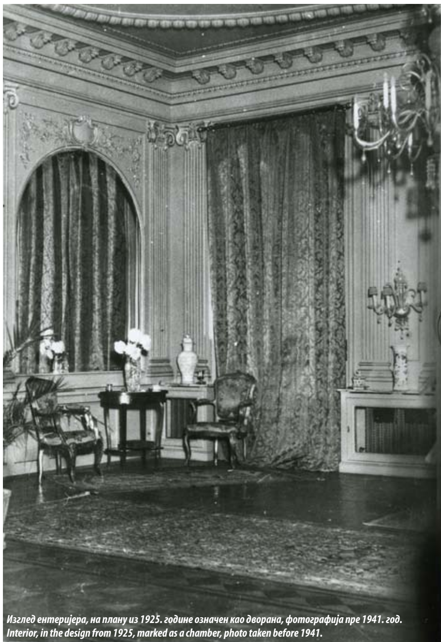
Изглед ентеријера, на плану из 1925. године означен као дворана, фотографија пре 1941. год. Interior, in the design from 1925, marked as a chamber, photo taken before 1941.

The timeframe in which Ilkić delivered his works, covers the dynamic period of Belgrade's development when a number of Serbian architects educated in Budapest, Vienna, Munich and Zurich appeared. This first generation of authors of the academic style concurrently incorporated the contemporary European architectural aspirations, giving a remarkable push to the transformation of Belgrade following the example of European capitals. Considering the limited financial capacities, apart from a few exceptions, primarily the