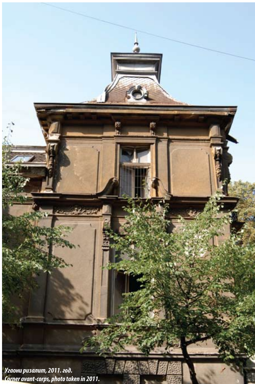
Угаони ризалит, 2011. год. Corner avant-corps, photo taken in 2011.

public buildings of a profane function - not many monumental or representative works of academism were created for the housing needs of wealthy citizens in this period. Nevertheless, in this segment of Belgrade's architectural fund, the names of Alexander Bugarsky, Konstantin Jovanović and Jovan Ilkić have the most prominent place. Representative houses of prominent citizens have been designed and built both as ground floor houses, and single story houses and later on, two-storey and multi-storey buildings were introduced, following in the footsteps of the Central European academic tradition.