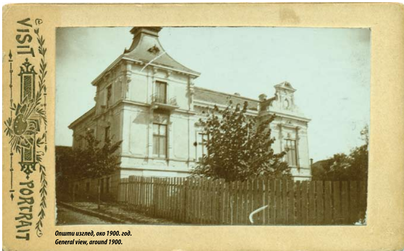
Opština изглед, око 1900. год. General view, around 1900.

Рад архитекте Јована Илкића обележила је плодна делатност на пољу сакралне и профане архитектуре, с великим бројем реализованих стамбених и неколико значајних јавних објеката, подигнутих у највећем делу на простору Београда. Својим укупним опусом сврстава се у ред најзначајнијих аутора српског академизма у периоду од 1884. до 1914. године. У његовим остварењима читава се пре свега ауторска концепција академизма, која превазилази оквире строгих академских стереотипа. Као ученик професора Теофила Ханзена и његов сарадник на реализацији зграде Бечког парламента, био је добро упознат са историјским стиливима. Карактеристична је разноврсност његових пројектних решења и вештина еkleктичног компоновања тема и мотива, који по свом стилском опредељењу у највећем делу представљају евокације ренесансних и барокних пластичних детаља, а међу београдским архитектама Илкић је словио за најбољег познаваоца барокне архитектуре. Поред