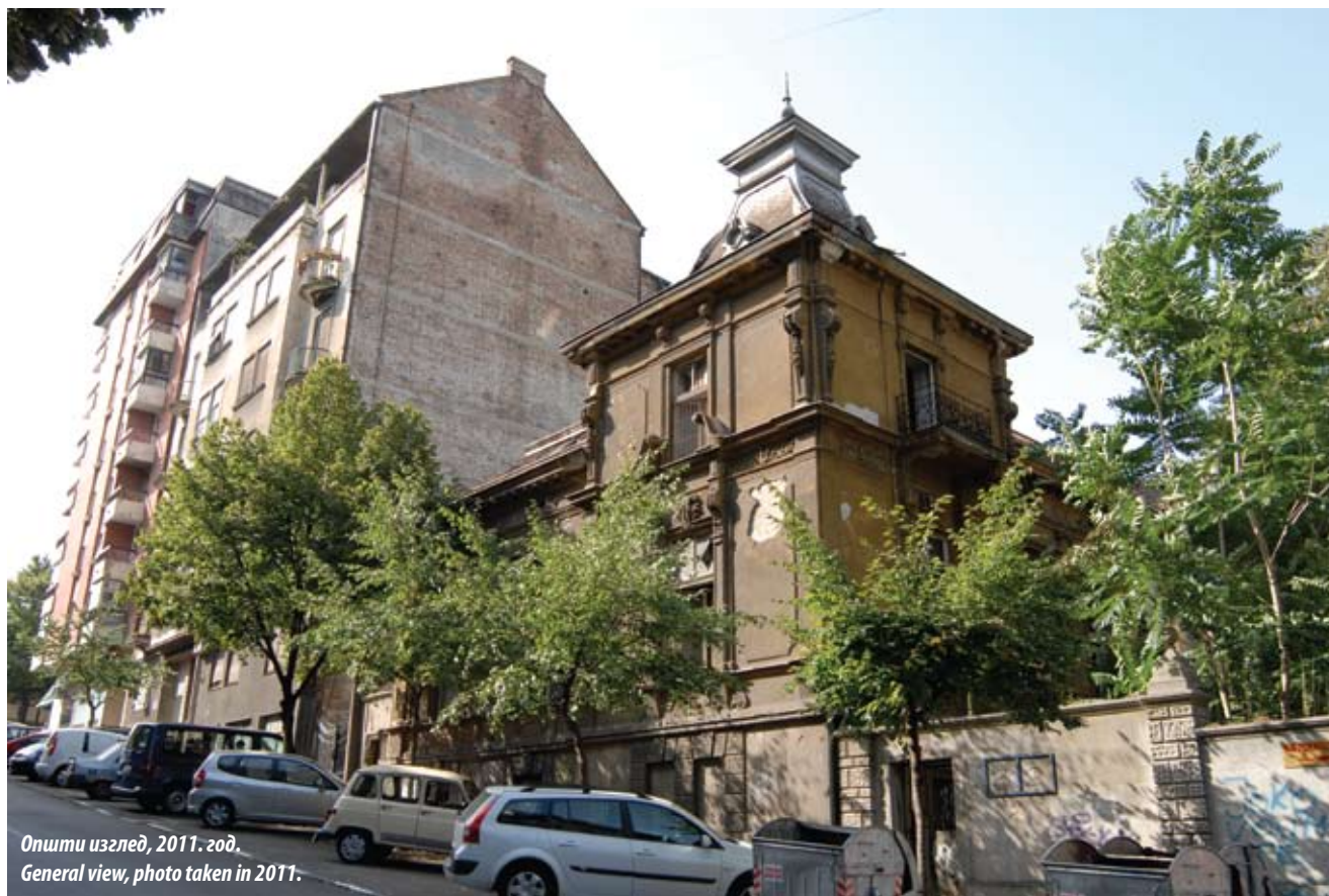
Општи изглед, 2011. год. General view, photo taken in 2011.

Значај стамбене архитектуре Београда на прелазу из XIX у XX век не треба посебно наглашавати. Данас, иако мањина у укупном грађевинском фонду, она представља значајно историјско наслеђе, које учествује у конституисању карактера града и сведочи о његовој прошлости и развоју. Кроз ту призму не морамо посматрати искључиво појединачне архитектонске, стилске или шире, амбијенталне – урбанистичке вредности, већ сама архитектура као утилитарна уметност такође нуди и важан елемент сагледавања укупне социјалне, економске и културне слике једног времена.