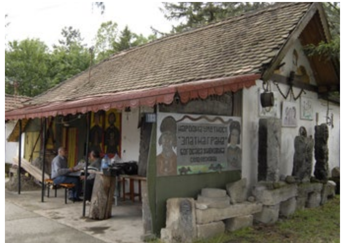
Сл. 2 / Улаз у комплекс