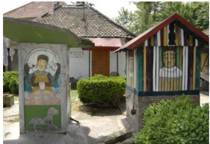
Сл. 5 / Чесма и бунар