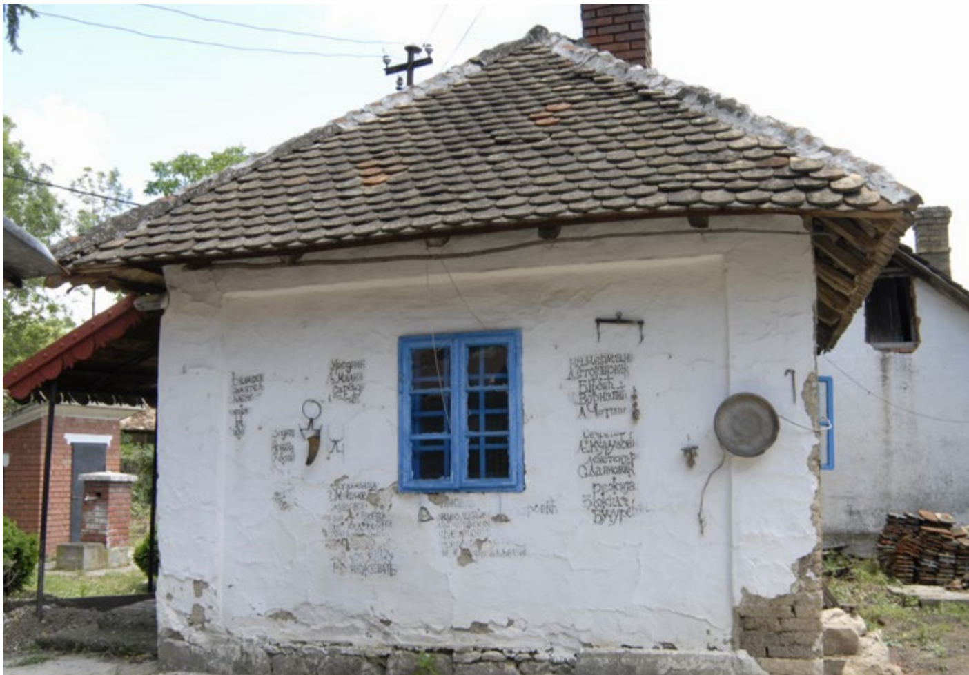
Сл. 3 / Родна кућа – одјавна шпица за емисију о уметнику

бар, сушара, две хлебне пећи, два млекара, вајат, трпезарија на отвореном, чесма и бунар, камена композиција за седење.