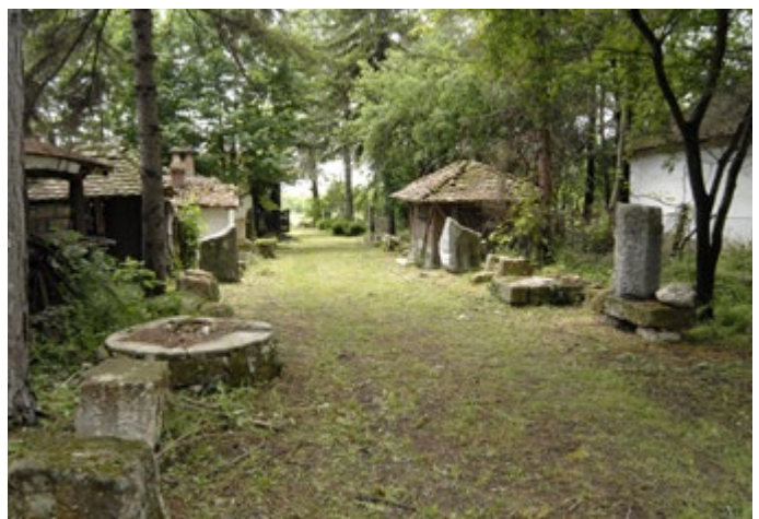
Сл. 6 / Стаза са вајалима и скулптурама