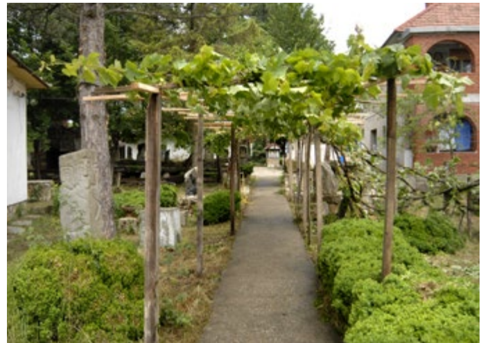
Сл. 4 / Главна стаза са кућом за становање у икозadini

Он има меморијалну вредност као родна кућа једног од највећих наивних уметника Србије. Посебна ауторска вредност се огледа у чињеници да се у оквиру споменика културе, како на отвореном простору тако и у ентеријеру, налази велика уметничка збирка Богосава Живковића, у којој су и нека од његових највреднијих дела. Као сведочанство припадности елитном уметничком простору, у време сложених кретања на ликовној сцени ондашње Југославије и света – од фигуративности до апстрактног израза, од експресионизма преко енформела до фантастике и надреал-