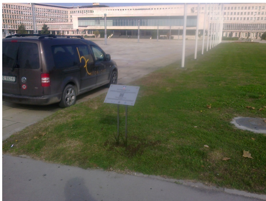
Пример: Палата Србија

За штампу на непровидном клириту Наручилац доставља Пружаоцу услуге у дигиталној форми дизајн табле који садржи: QR код са називом културног добра на српском и енглеском језику, као и кратак текст на српском и енглеском језику.