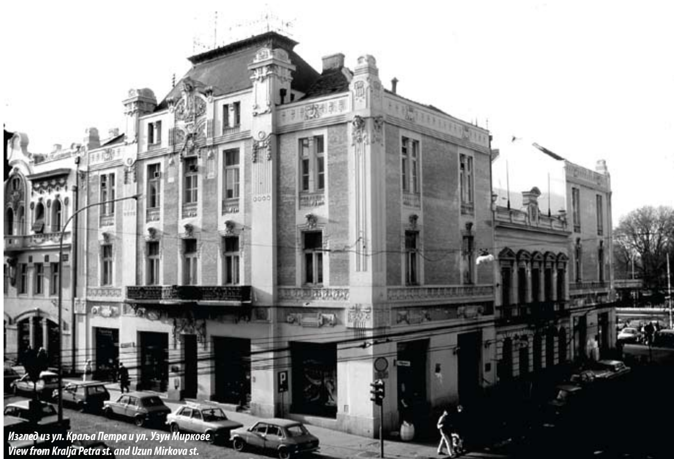
Изглед из ул. Краља Петра и ул. Узун Миркове View from Kralja Petra st. and Uzun Mirkova st.

The Building of the Merchant Stamenković is much better known by its apt popular name: 'The House with Green Tiles' because its unusual façade covered with green ceramic tiles is what makes it stand out from its surroundings even at a cursory glance. Its location at the corner of Kralja Petra and Uzun Mirkova streets was not a random choice. Kralja Petra Street was the main commercial street in Belgrade for a long time, and it was a matter of prestige to have a shop or an office there. Stamenković intended the ground floor for shops and the upper floors for living accommodation,