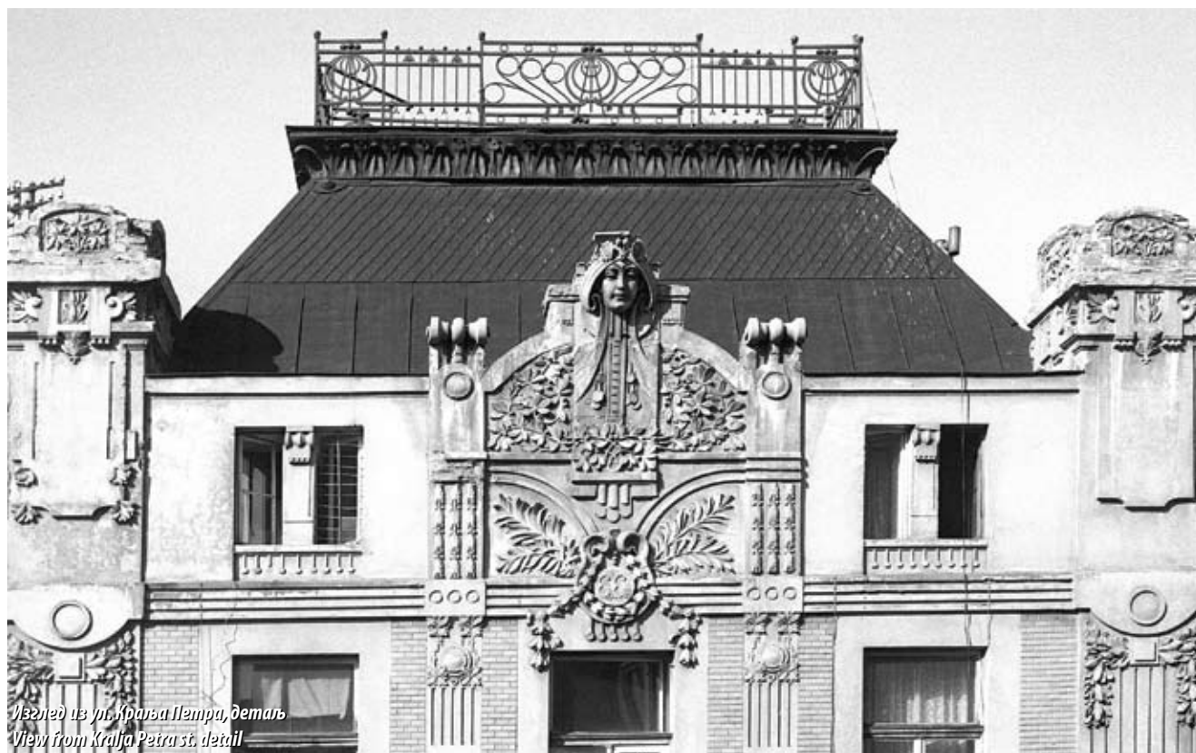
Изглед из ул. Краља Петра, детаљ View from Kralja Petra st. detail