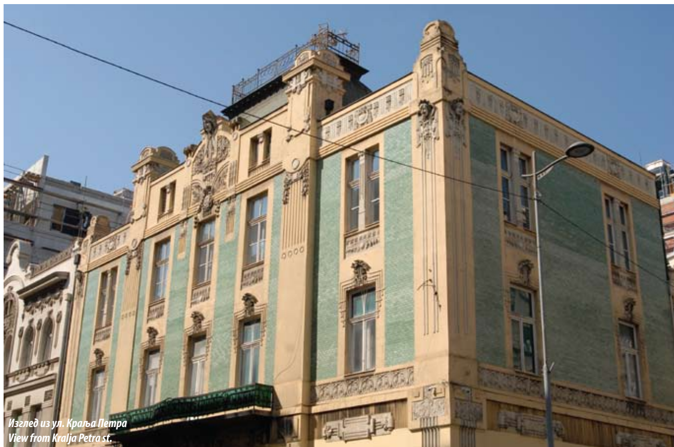
Изглед из ул. Краља Петра View from Kralja Petra st.

до тада незамисливом одсуству кровног венца које је додатно истакло тежњу ка вертикализму. Вертикална подела главне фасаде постигнута је наглашеним пиластрима с карактеристичним, рељефно обрађеним, завршетком и декорацијом у виду женских глава, од којих се наниже спуштају траке геометријског профила. Ови пиластри су употребљени на угловима блока и на главној фасади окренутој Улици краља Петра. Средишњи ризалит фасаде истакнут је порталом изнад којег су балкони са оградом од кованог гвожђа, а завршава се у зони крова декоративно обрађеном атиком и пирамидалним кубетом. Већим делом слободне површине фасаде су покривене зеленим керамичким плочицама, по чему спада у ретке у Београду с хроматском фасадом и којима и дугује свој популарни назив.