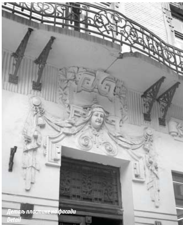
Детаљ пластике на фасади Detail