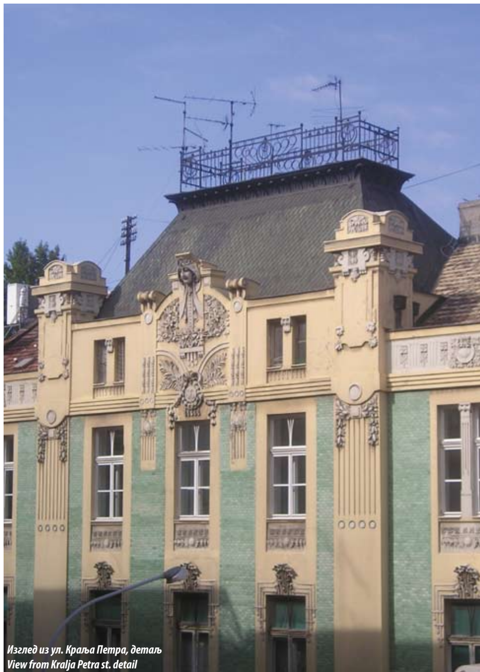
Изглед из ул. Краља Петра, детаљ View from Kralja Petra st. detail