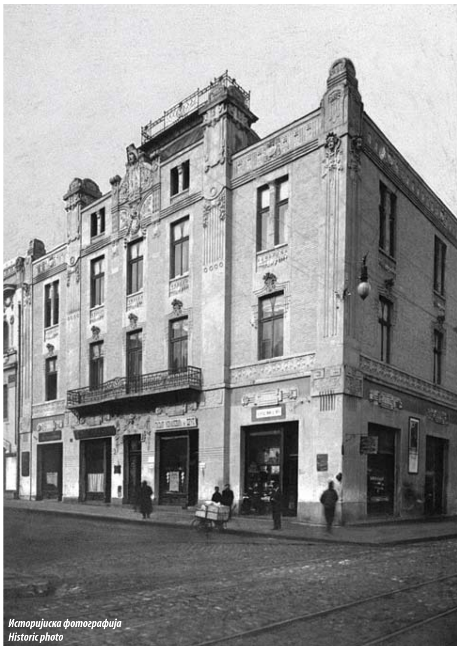
Историјска фотографија Historic photo