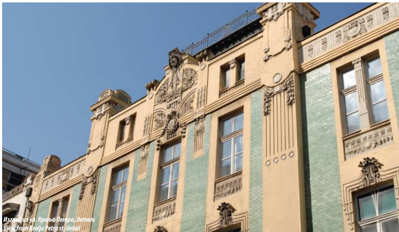
Изглед из ул. Краља Петра, детаљ View from Kralja Petra st. detail

floors and an attic. It was built of brick bound with lime mortar. The upper floors are covered with beam ceilings, and the basement, the ground floor and the landings feature segmental (Prussian) vaults. The gable roof is covered with beavertail tiles.