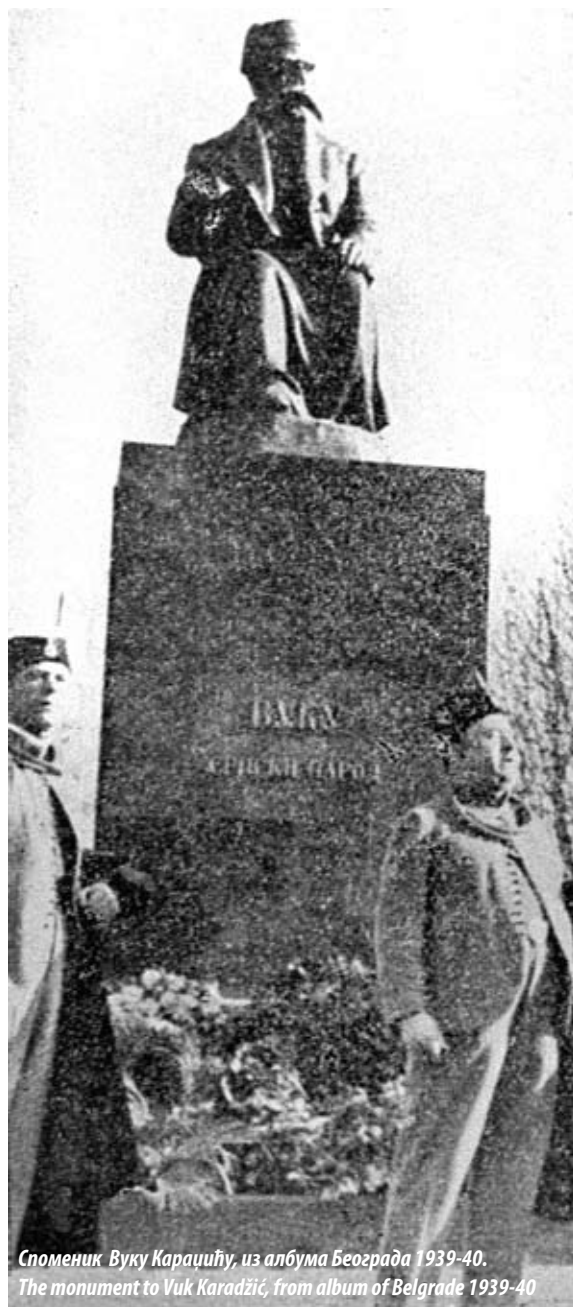
Споменик Вуку Караџићу, из албума Београда 1939-40. The monument to Vuk Karadžić, from album of Belgrade 1939-40