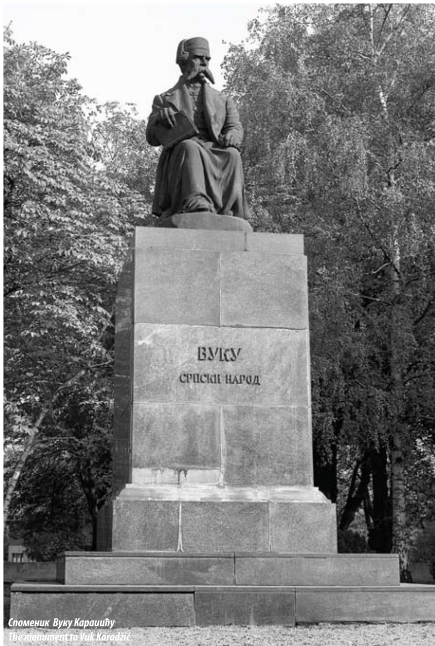
Споменик Вуку Караџићу The monument to Vuk Karadžić