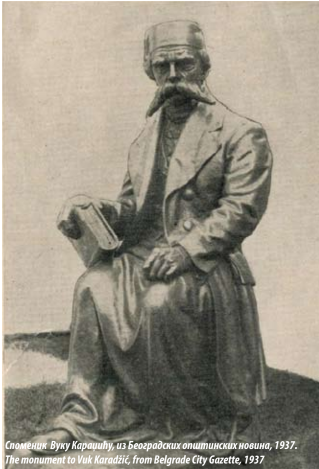
Споменик Вуку Караџићу, из Београдских општинских новина, 1937. The monument to Vuk Karadžić, from Belgrade City Gazette, 1937