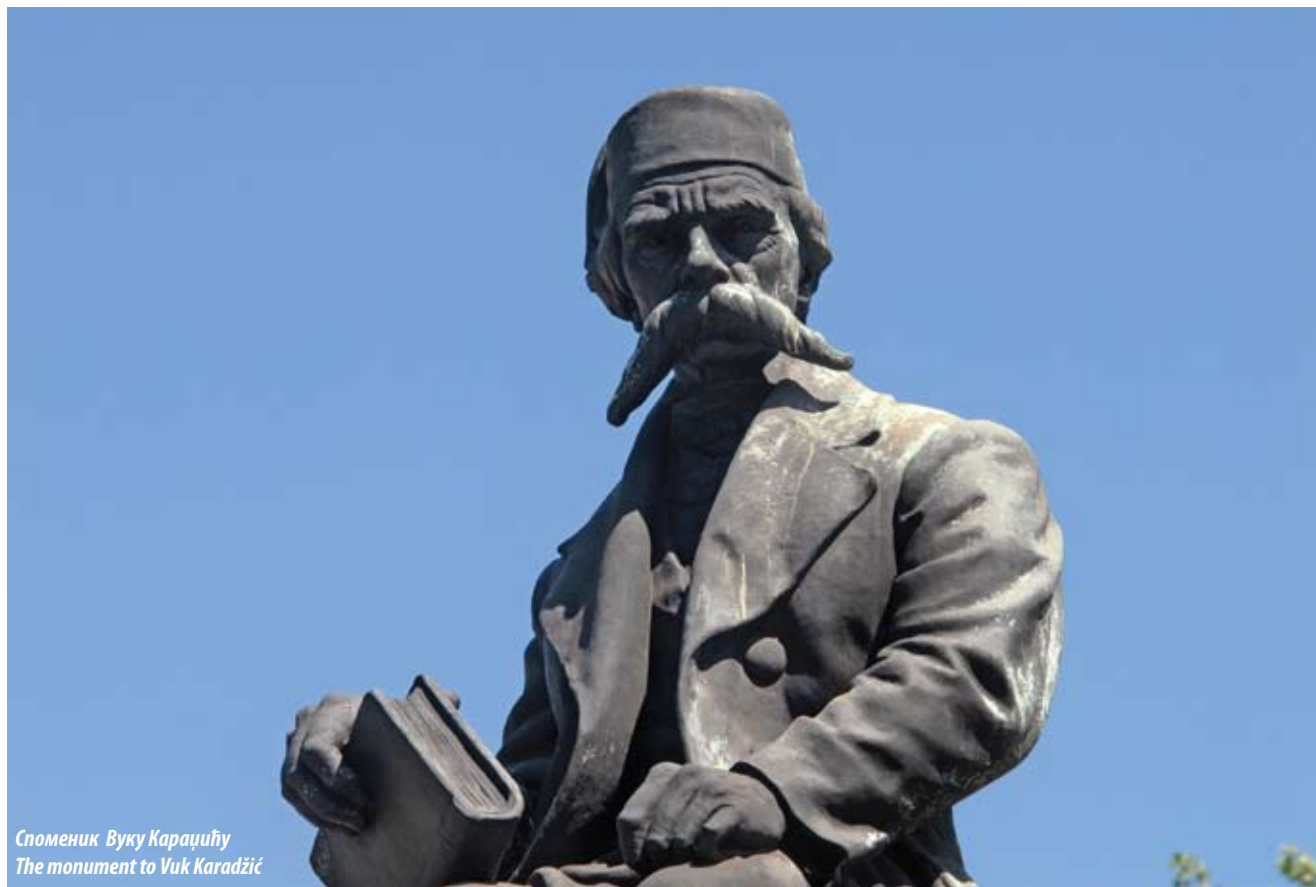
Споменик Вуку Караџићу The monument to Vuk Karadžić