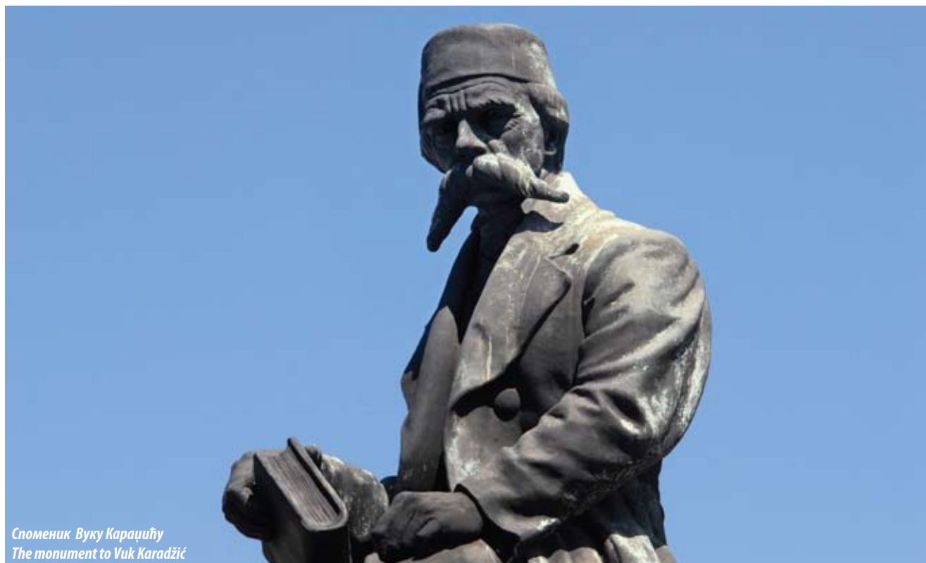
Споменик Вуку Караџићу The monument to Vuk Karadžić

The monument to Vuk Karadžić at the corner of Ruzveltova Street and Kralja Aleksandra Boulevard, a work of the prominent Serbian sculptor Djordje Jovanović, was unveiled on 7 November 1937 on the occasion of the 150th anniversary of Vuk's birth.