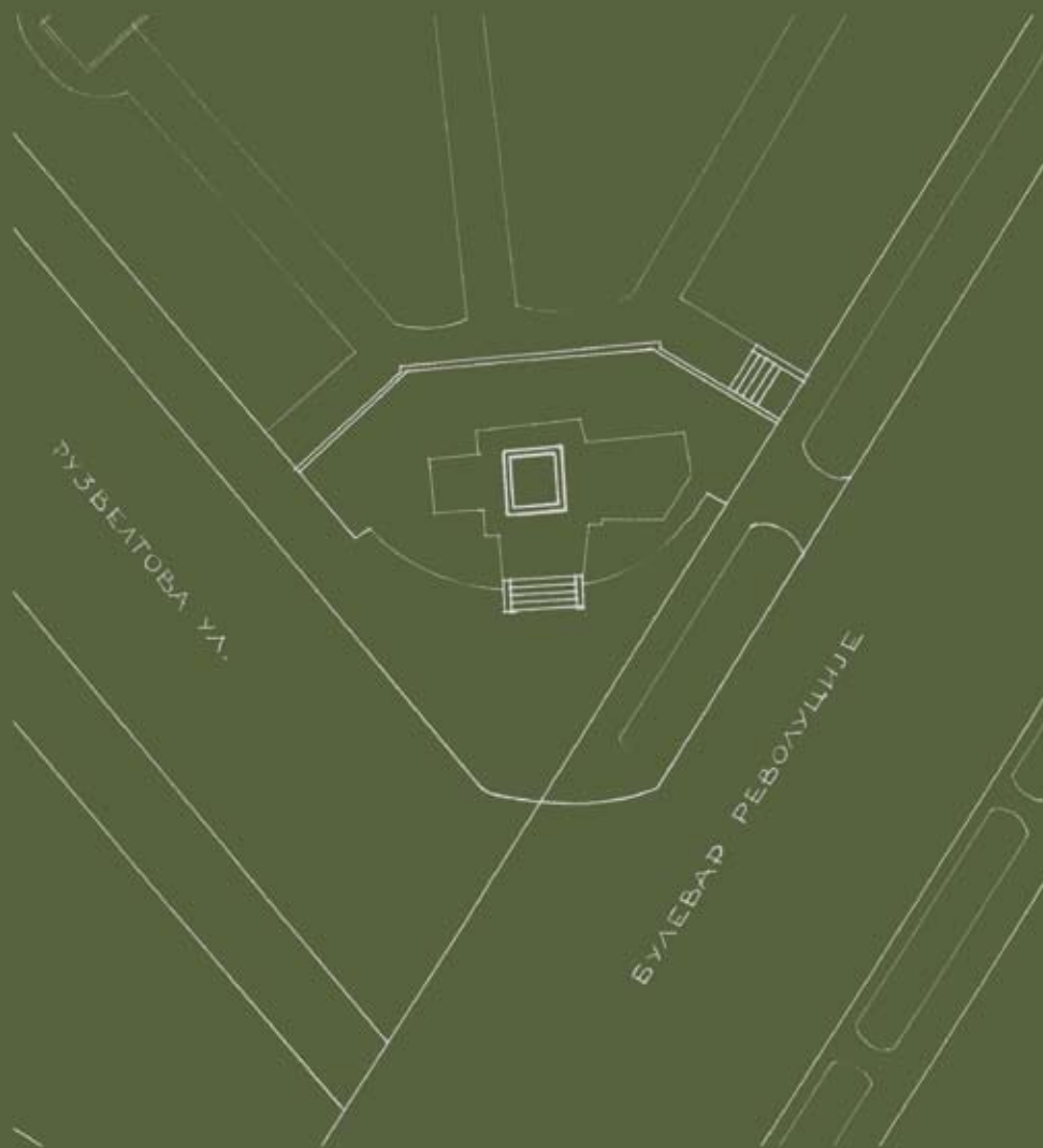
Позиција споменика Position of the monument