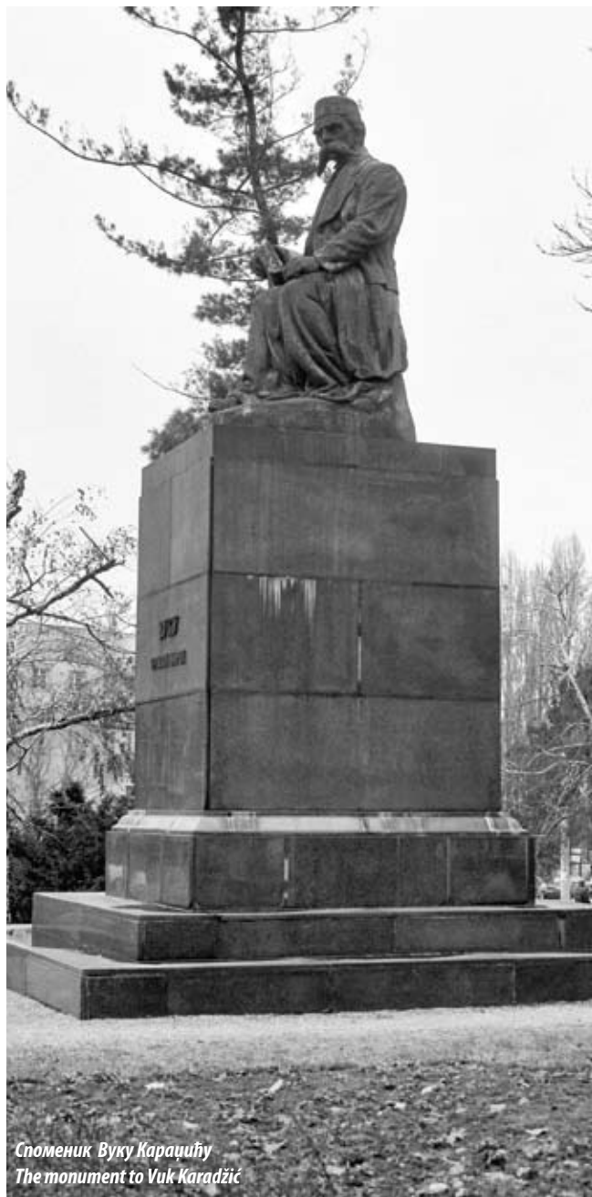
Споменик Вуку Караџићу The monument to Vuk Karadžić