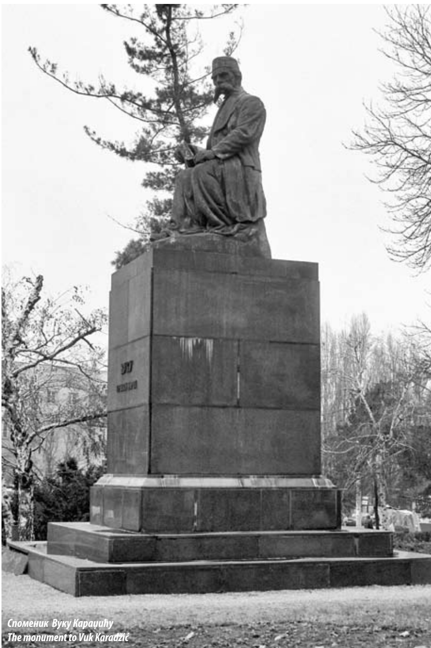
Споменик Вуку Караџићу The monument to Vuk Karadžić

There ensued the crafting of the pedestal and the preparation of the site. The Committee on the Commemoration of the 150th Anniversary of the Birth of Vuk Karadžić set the dates for the commemoration for 6, 7 and 8 November 1937. The unveiling ceremony was scheduled