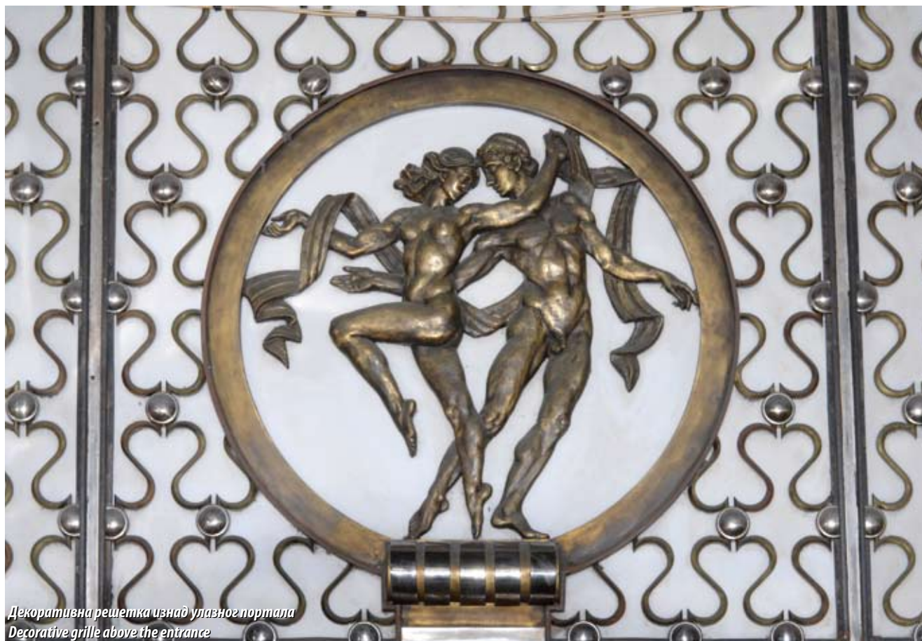
Декоративна решетка изнад улазног портала Decorative grille above the entrance