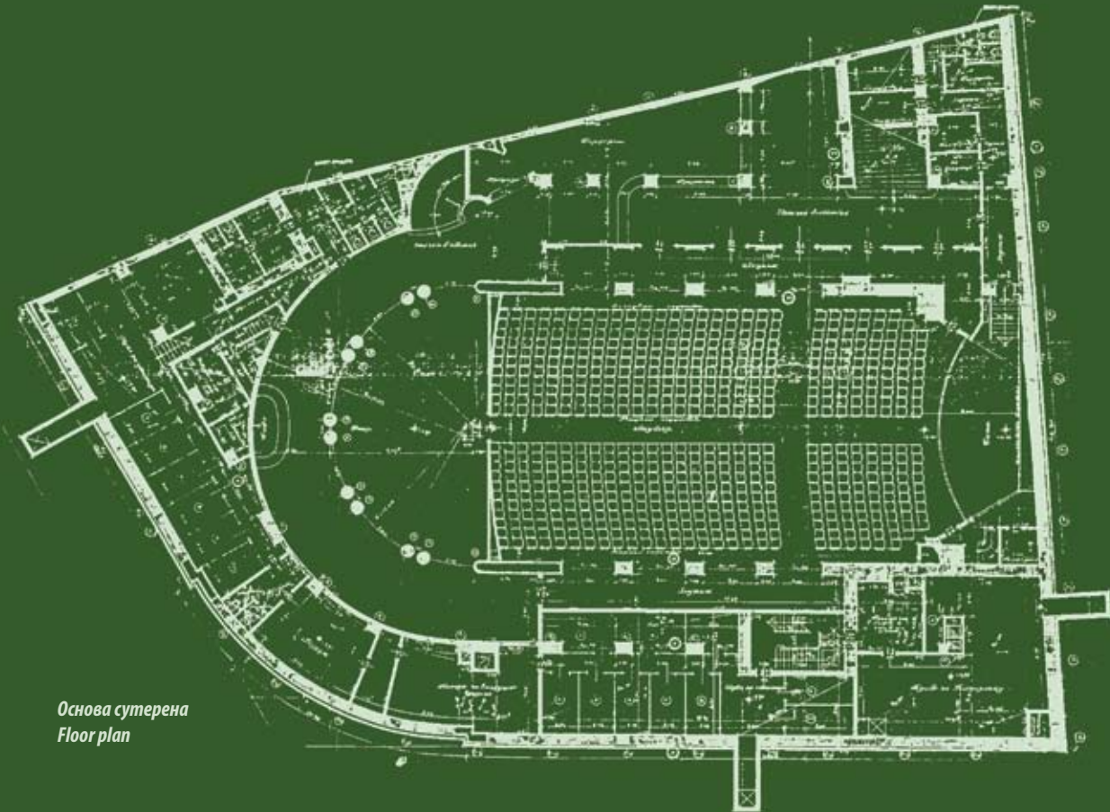
Основа сутерена Floor plan