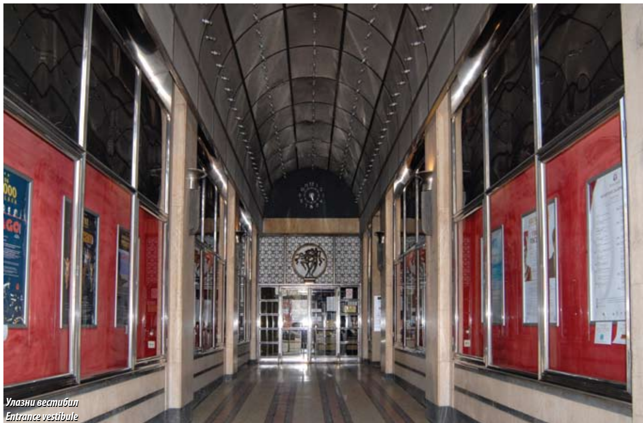
Улазни вестибил Entrance vestibule

У строгом центру Београда, на месту где се Теразије отварају према Тргу Николе Пашића, 1939. године изграђена је Палата Пензионог фонда чиновника и служитеља Народне банке Краљевине Југославије. Подигнута је на месту Урошеве пивнице и Шишкове кафане, у тадашњем амбијенту Теразија, који је обухватао хронолошки, висински и стилски сасвим неуједначен грађевински фонд. Ова зграда је међу старим Београђанима позната као палата „Београд“. Назив је произашао из тадашњег назива биоскопа који је радио у оквиру палате, у сали у сутерену и приземљу, а чији простор данас заузима Позориште на Теразијама.