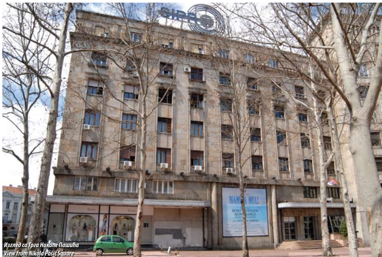
Изглед са Трга Николе Пашића View from Nikola Pašić Square

The building of the Pension Fund of the Clerks and Servants of the National Bank of the Kingdom of Yugoslavia is located in the heart of downtown Belgrade, at the point where Terazije opens out to Nikola Pašić Square. It was built in 1939 on the site of former Uroš's Alehouse and Šiško's Tavern, in an architectural landscape which was heterogeneous in style, date and height. Older generation of Belgraders still popularly call it Beograd Palace, after the name of the basement-level cinema which is now home to the Theatre-on-Terazije.