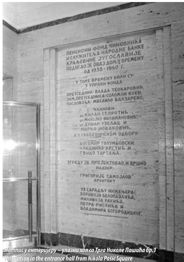
Напис у ентеријеру – улазни хол са Трга Николе Пашића бр.1 Inscription in the entrance hall from Nikola Pašić Square

На залученој континуалној фасади према Теразијама доследно је спроведена академска, строга хијерархија зона. Перфорирана је мирним и уједначеним ритмом троделних прозорских отвора у зони спратова и четвороделних у зони мезанина и петог спрата. Двоструки плитки пиластри са сведеним базама и капителима протежу се висином прва четири спрата. Угаону партију у највишој зони одређују два картуша. Низ локала у приземљу, са широким