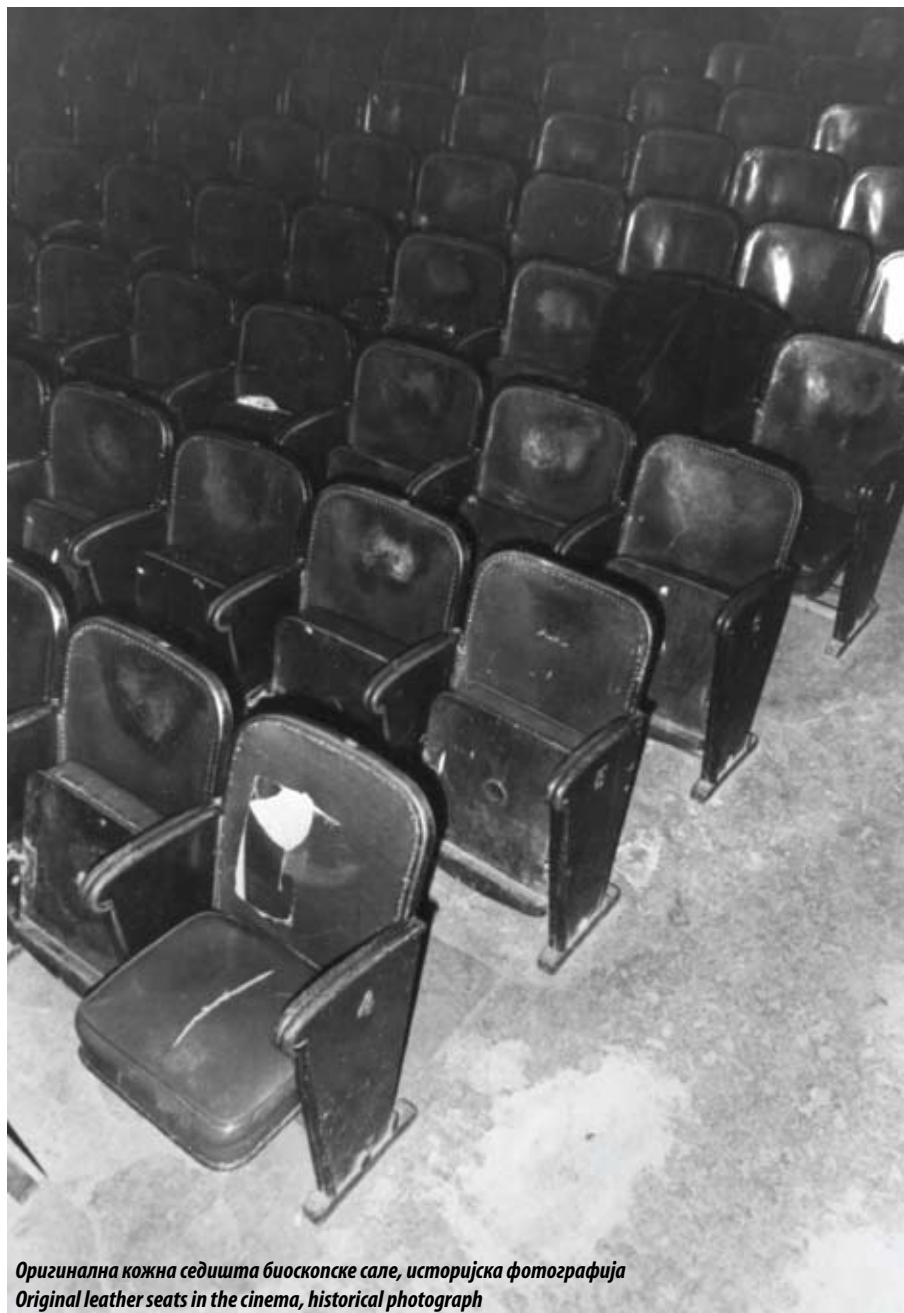
Оригинална кожна седишта биоскопске сале, историјска фотографија Original leather seats in the cinema, historical photograph

a relief composition in stucco, "Dancing in the Water", depicting young female figures in a gentle dancing motion, one holding a musical instrument, two reclining in the sun. There is also a scene of the birth of Venus and a nymph riding a sea horse. All of them convey the idea of art and the beauty it brings. Clear but gentle outlines, soft movements, marine motifs, stylised wave line, create a poetical airy scene.