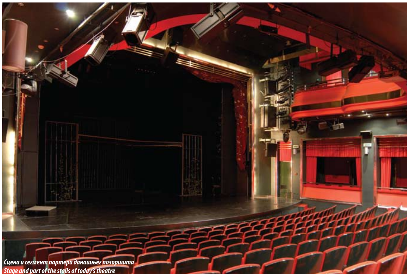
Сцена и сегмент партера данашњег позоришта Stage and part of the stalls of today's theatre

way to modernism, and Art Deco had already been well established. The tenets of those styles are observable in Samojlov's design for the Pension Fund building, not as a random choice of ineptly assembled elements, but as a carefully thought-out and creatively unified whole.