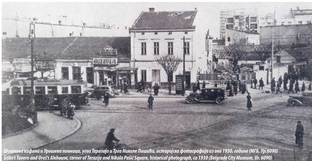
Шишкова кафана и Урошева пивница, угао Теразија и Трга Николе Пашића, историјска фотографија из око 1930. године (МГБ, Ур. 6090) Šiško's Tavern and Uroš's Alehouse, corner of Terazije and Nikola Pašić Square, historical photograph, ca 1930 (Belgrade City Museum, Ur. 6090)

the air in the auditorium. The acoustic design of the auditorium based on its funnel-like shape and the use of special materials for the walls enabled an even distribution of sound to every seat on both levels.