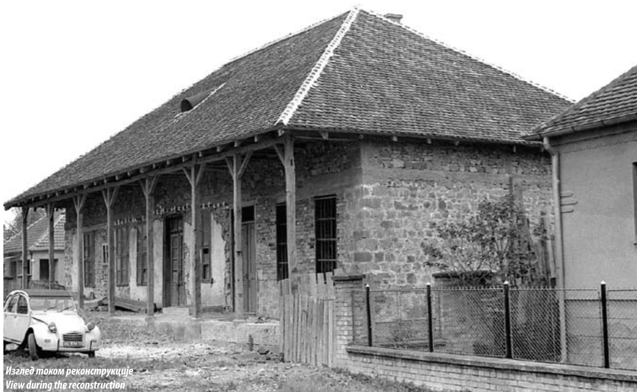
Изглед током реконструкције View during the reconstruction

На двама аустријским картама београдске околине, једној из 1722. и другој из 1788. године, Остружница је лоцирана, као и данас, у доњем току Остружничке реке са кућама ушореним уз некадашњи главни друм. Према наведеним картама, рекло би се да је центар села био на истом месту, на почетку Карађорђевог улице.