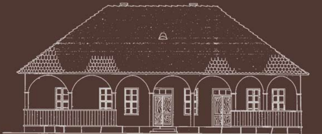
ИЗГЛЕД ОА УЛИЦЕ Р-1:50