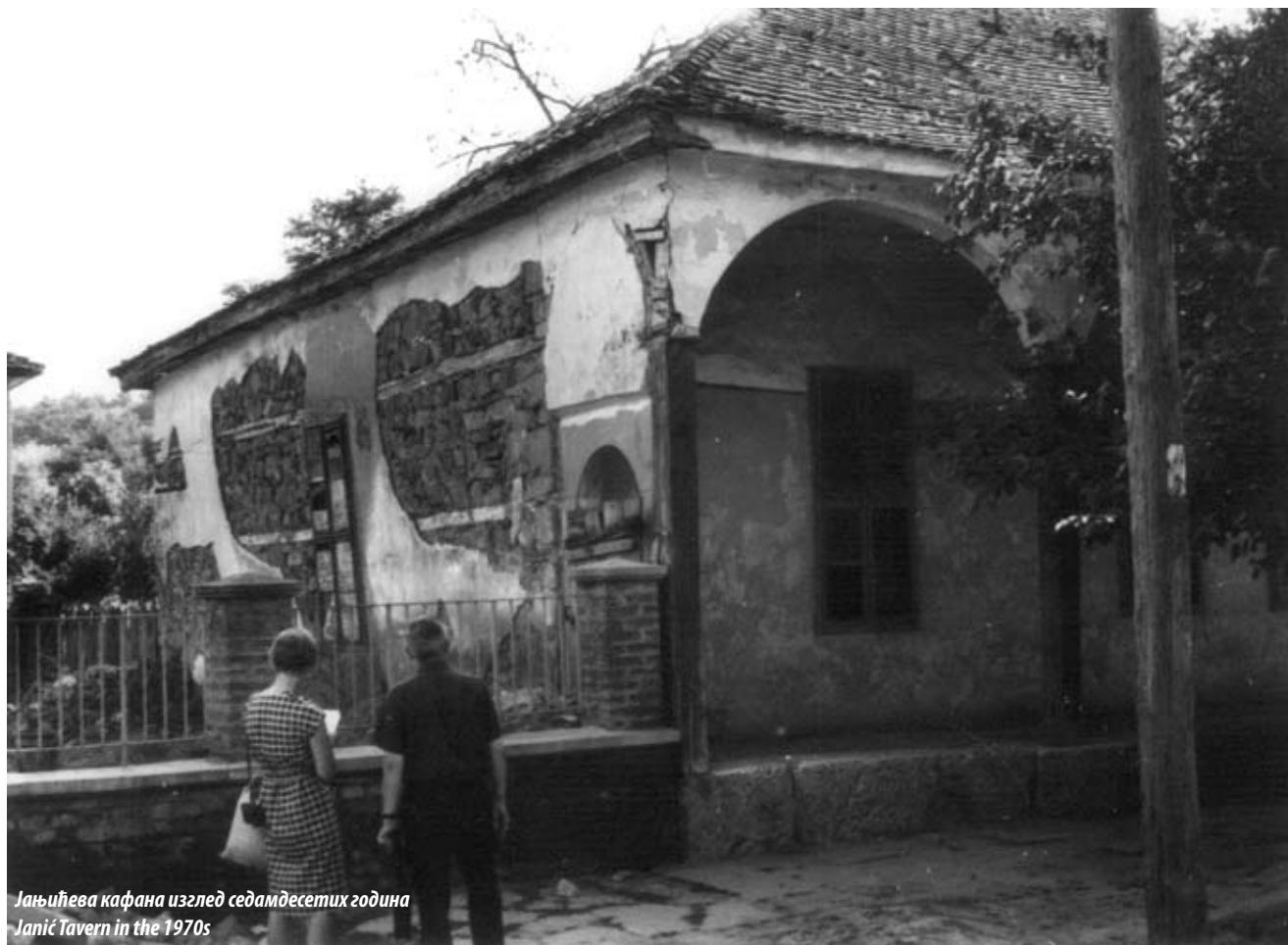
Јањићева кафана изглед седамдесетих година Janić Tavern in the 1970s

Two Austrian plans of Belgrade, of 1722 and 1788 respectively, show Ostružnica on its present-day location in the lower course of the river and with its houses aligned along the former main road. As it appears from the maps, the village centre was exactly where it is today, at the beginning of Karadjordjeva Street.