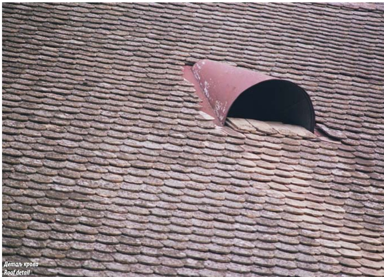
Детаљ крова Roof detail

in the District (nahije) of Belgrade. It is also associated with the early beginnings of parliamentary life in Serbia because it was there that, on 21 March 1804, the first national assembly convened by Karadjordje was held. The elementary school opened in 1805, one of the first with instruction in Serbian in the District of Belgrade, has been operating for more than two hundred years. A petition to the Ottoman Sultan was signed there in 1806.