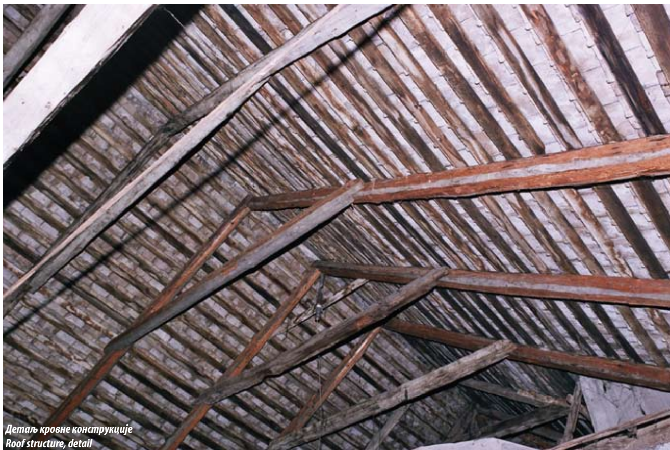
Детаљ кровне конструкције Roof structure, detail

structurally consolidated and restored it to its original appearance in compliance with the requirements laid down by the Cultural Heritage Protection Institute of Belgrade. He did most of the work himself and all at his own expense.