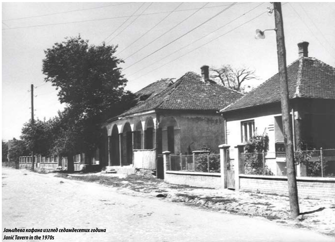
Јањићева кафана изглед седамдесетих година Janić Tavern in the 1970s

The tavern belongs to the traditional Morava house type, and is an example of a representative form of vernacular architecture favoured by the well-to-do classes, notably merchants, in small towns and villages across Serbia.