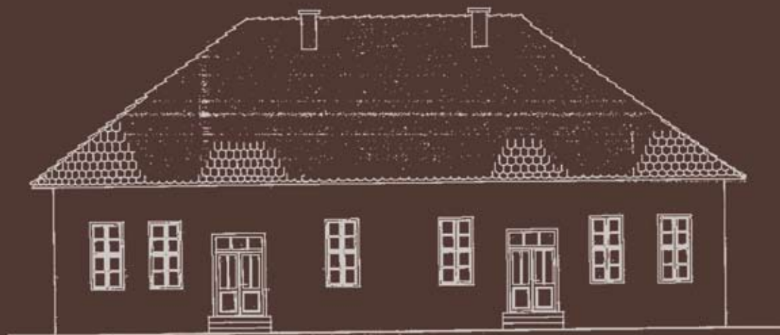
ИЗГЛЕД ИЗ ДВОРИЩА Р-1:50