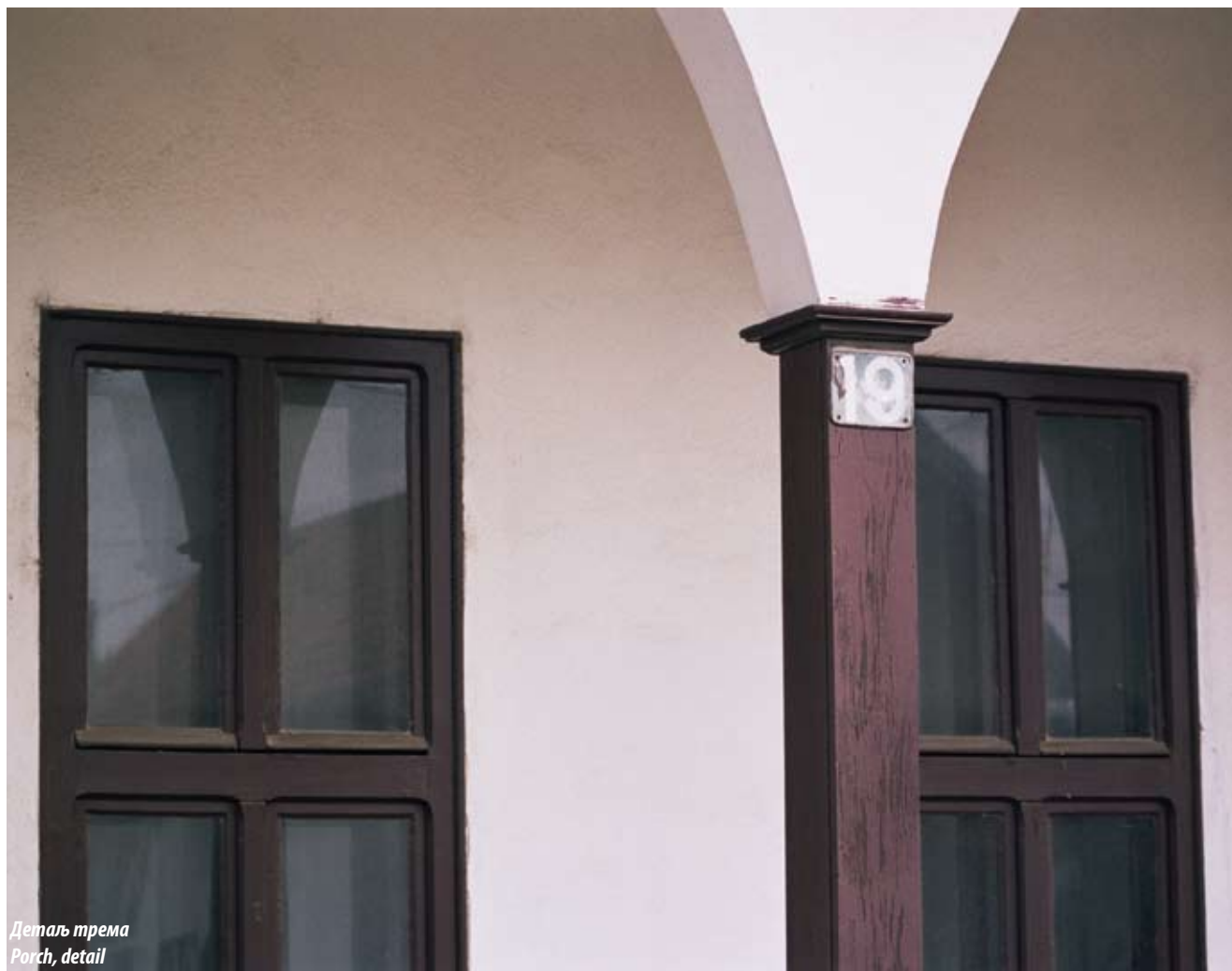
Детаљ трема Porch, detail

црепом. Прозори су дупли двокрилни. Спољна улазна врата на главној уличној фасади су дупла, док су унутрашња једнокрилна пуна дрвена. Подови су од опеке и дашчани. Плафони су рађени од летава и обрађени лепом.