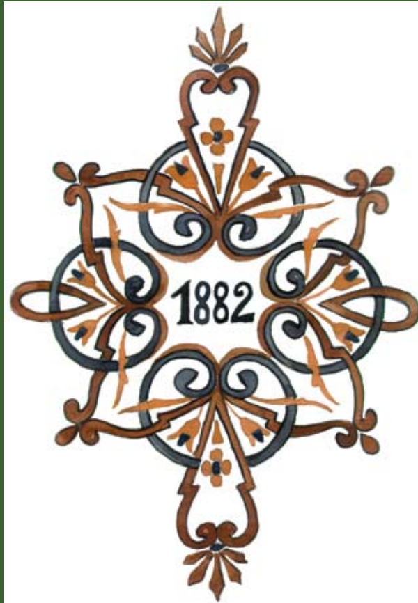
Мозаик у подухола Дома породице Павловић са годином изградње Lobby mosaic with construction year