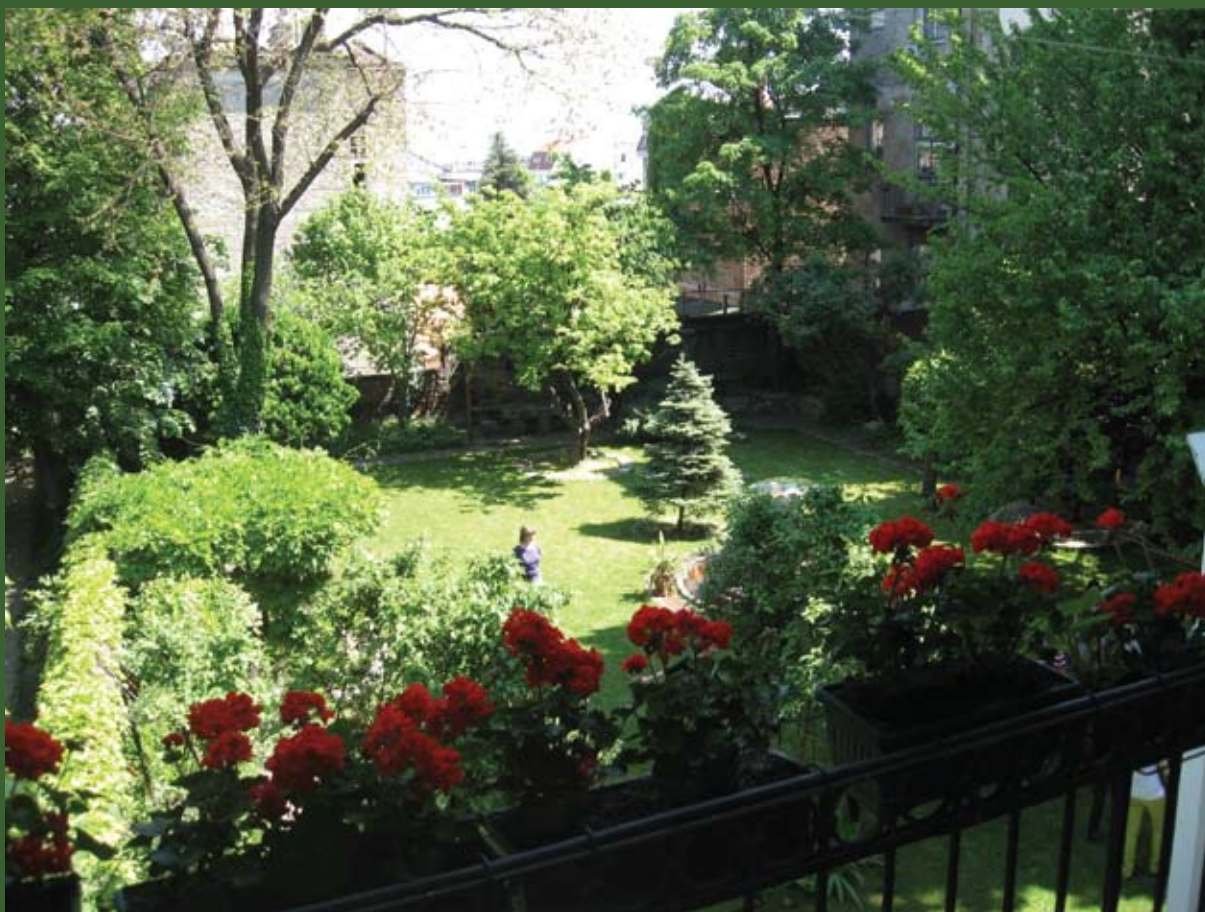
Данашњи изглед баште Дома породице Павловић Today's appearance of the garden of Home of Pavlovic family