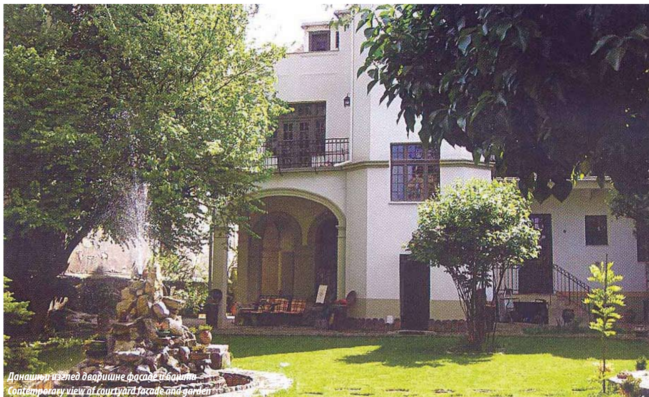
Данашњи изглед дворишне фасаде и баште Contemporary view of courtyard facade and garden

Културно наслеђе не чине само градови, њихова здања – куће и улице или музеји са уметничким предметима – већ и људи и њихова дела. Данас, захваљујући и сачуваним породичним збиркама и архивама, можемо реконструисати слику живота како појединца тако и целог друштва. Писана документа и извори, давно заборављени употребни предмети и усмена предања власника и потомака у аутентичном амбијенту најстаријих домова угледних српских породица постају на тренутак живописна илустрација прошлих времена. У свеобухватном сагледавању развоја државе и друштва, споменици културе су чувари и путокази у осветљавању урбане историје, културе и обичаја, страдања и слободе једног народа.