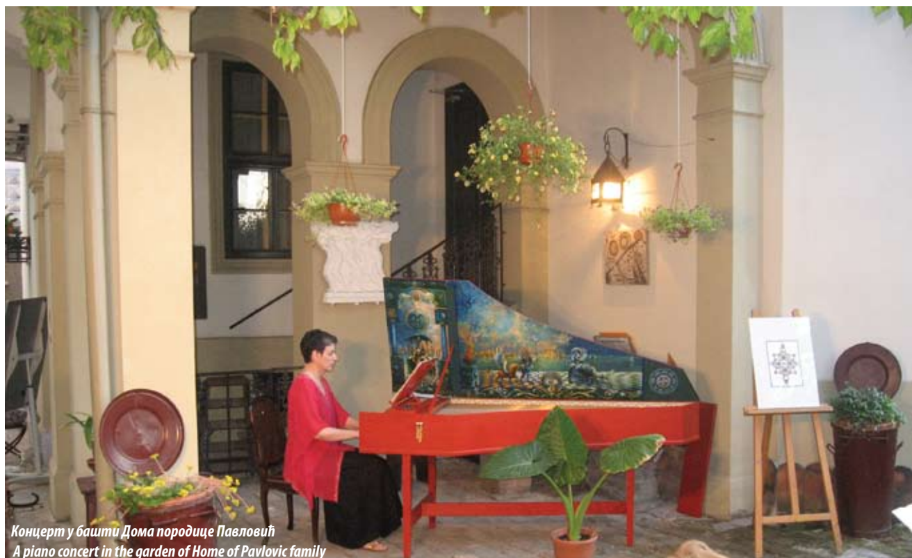
Концерт у башти Дома породице Павловић A piano concert in the garden of Home of Pavlovic family

It is not only cities with their buildings and streets or museums with their art collections but also people and their works and actions that cultural heritage is made up of. Preserved family collections and archives make it possible for us today to reconstruct the life of both individuals and societies. Written documents and sources, long-forgotten everyday objects and oral family histories related by owners or their descendants in the authentic setting of the oldest homes of distinguished Serbian families provide a fleeting yet vivid glimpse of times past. For those seeking to build a comprehensive picture of the development of a state and society, cultural heritage monuments stand as guardians and signposts in their effort to shed light on the urban history, culture, customs, tribulations and freedom of a nation.