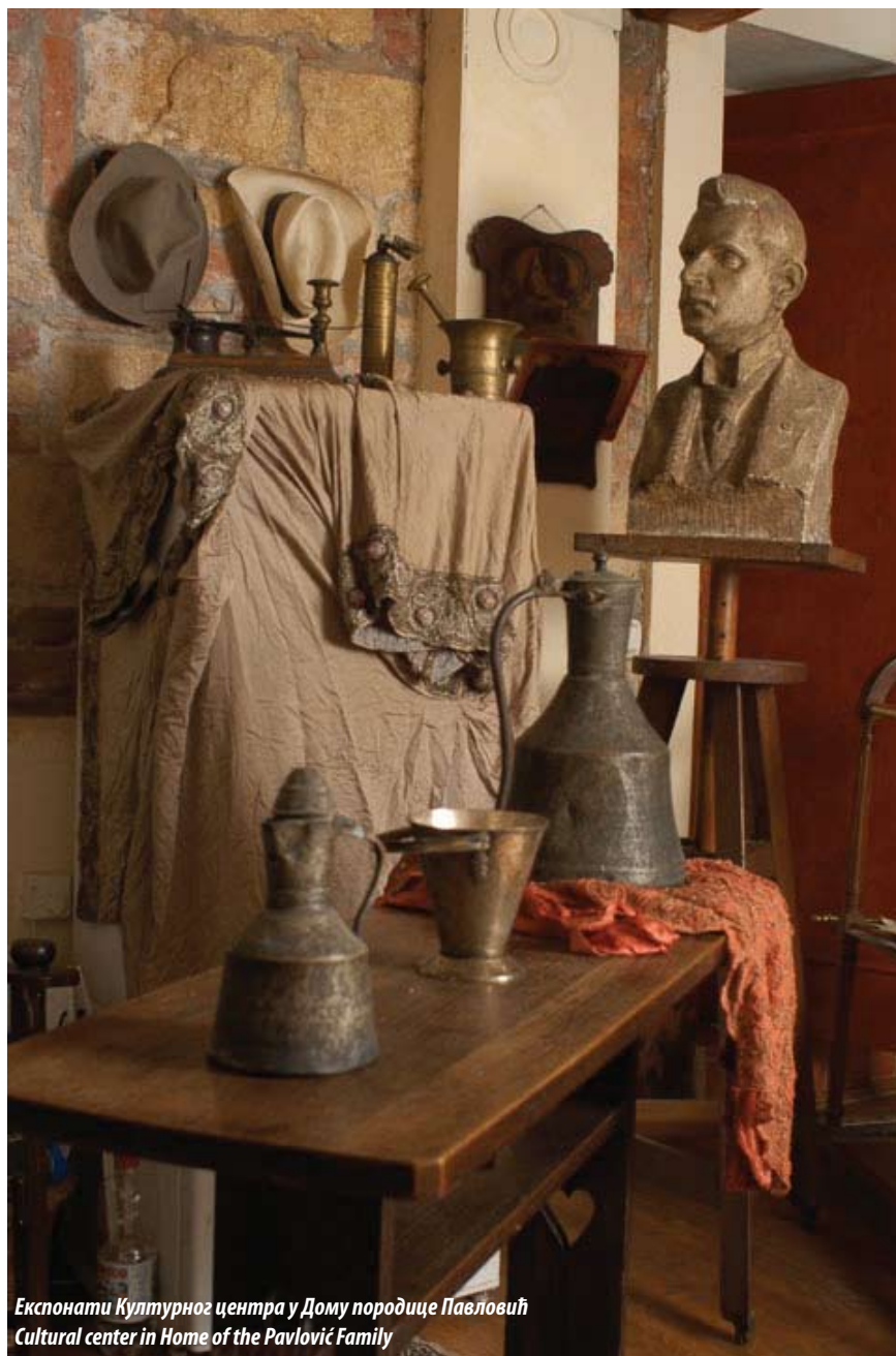
Експонати Културног центра у Дому породице Павловић Cultural center in Home of the Pavlović Family