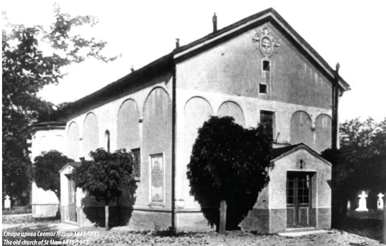
Стара црква Светог Марка 1835-1942 The old church of St. Mark 1835-1942