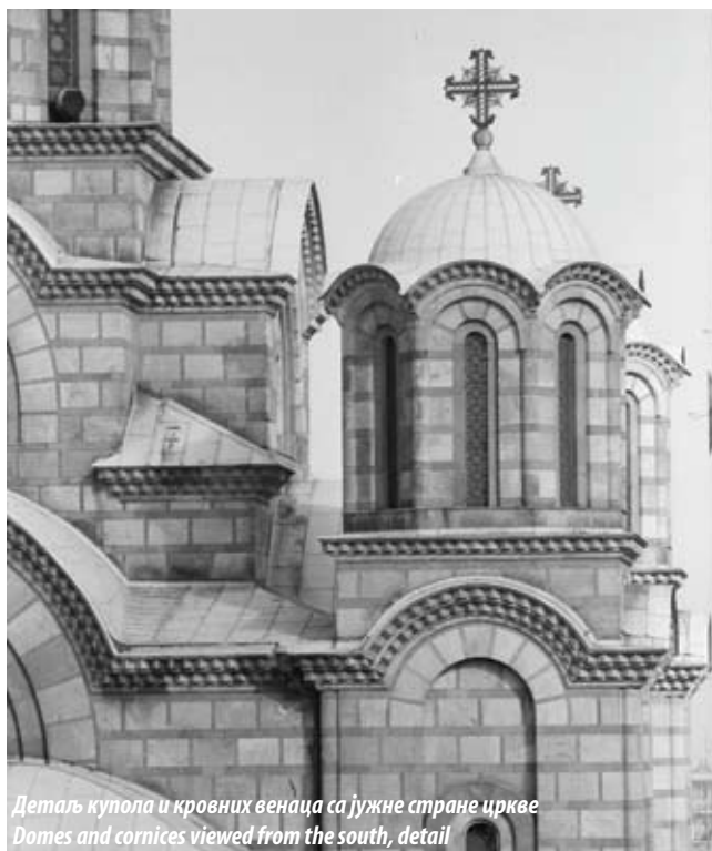
Детаљ купола и кровних венаца са јужне стране цркве Domes and cornices viewed from the south, detail

Црква Светог Марка од подизања до данас доминира амбијентом и околним грађевинама и захваљујући доброј сагледивости у визурама издваја се у силуети Београда. Због посебних архитектонских и урбанистичких квалитета, Црква Светог Марка у Београду утврђена је за споменик културе Решењем Завода за заштиту споменика културе града Београда бр. 1509/1 од 20. 10. 1975. године.