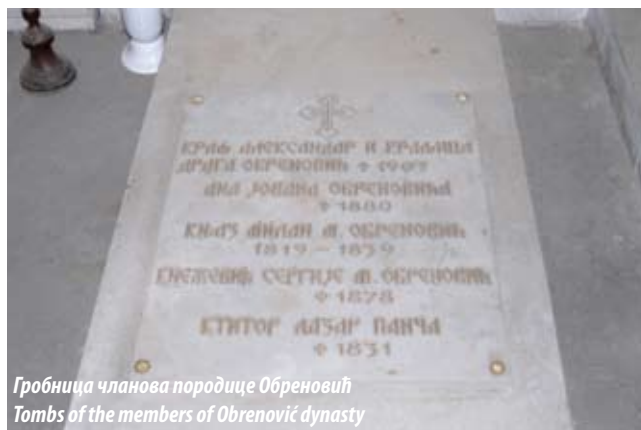
Гробница чланова породице Обреновић Tombs of the members of Obrenović dynasty

The church is encompassed with four arched porticos, two in front of the north and south entrances, and two flanking the main entrance surmounted by a tall bell tower and accessed by a wide flight of stairs. The porticos and the narthex have groin vaults, while the rest of the church is covered with barrel vaults. The church is a reinforced concrete structure. The vaults are supported by four massive reinforced concrete columns coated with a red polished plaster finish. Despite large spans, the vaults are only 8 cm thick but double, the concrete roof surfaces are covered with copper, and the interior walls are coated with cement plaster. As reported by the civil engineering expert Miroslav Kasalo of Ljubljana University charged with revising the bill of quantities, this was “the first church building on the model of Byzantine architecture executed in reinforced concrete”, with a central heating system and electrically operated church bells, an apt combination of Serbo-Byzantine heritage and modern technology.