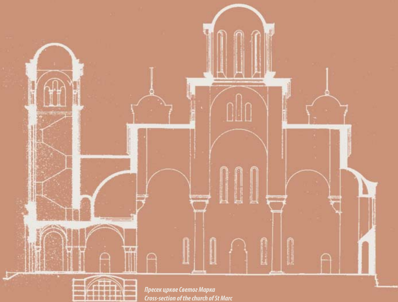
Пресек цркве Светог Марка Cross-section of the church of St. Marc