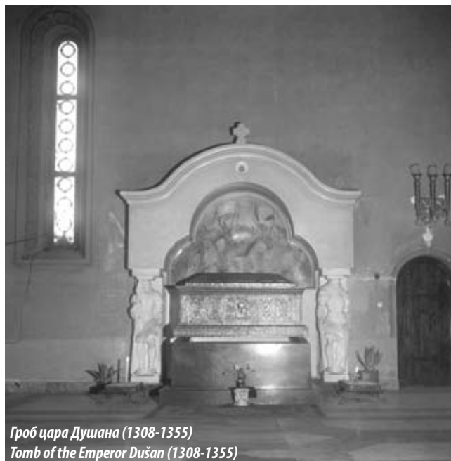
Гроб цара Душана (1308-1355) Tomb of the Emperor Dušan (1308-1355)

Цркву Светог Марка обухватају четири аркадна трема, два испред бочних улаза, са севера и југа, а друга два угаона трема фланкирају главни улаз у грађевину, који је формиран кроз звоник и којем се прилази широким степеништем. Аркадни тремови и припрата засведени су крстастим сводовима, док су остали сводови цркве полуобличасти. Конструкција цркве је армиранобетонска. Сводове