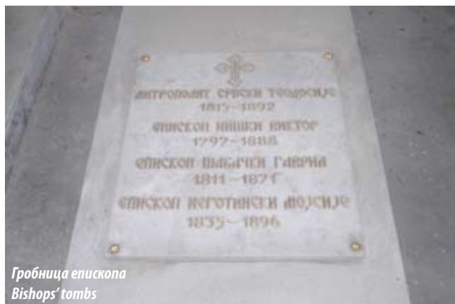
Гробница епископа Bishops' tombs