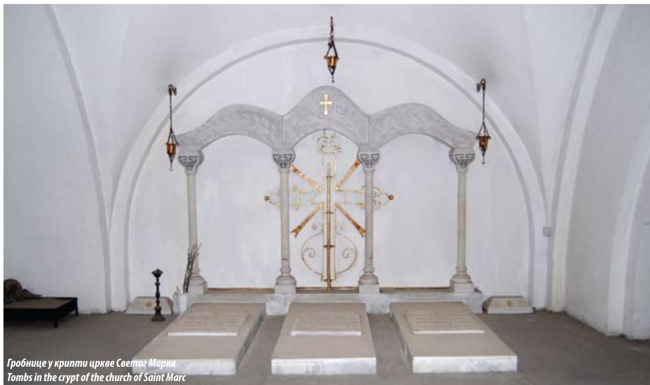
Гробнице у крипти цркве Светог Марка Tombs in the crypt of the church of Saint Marc

echoing the architectural ideas of the Byzantine capital, Constantinople. The Krstić brothers, while pursuing contemporary methods of architectural construction, complied with the requirement for a spacious five-domed church on an oblong plan with a narthex and a bell tower over the west entrance, fashioning it in the so-called Serbo-Byzantine style that perpetuated the traditions of medieval Serbian church architecture.