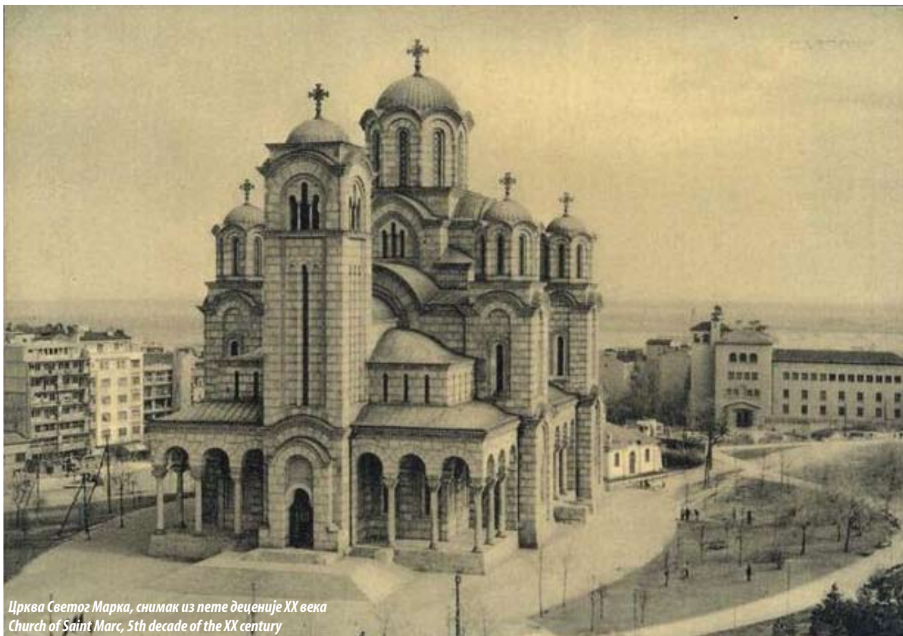
Црква Светог Марка, снимак из пете деценије XX века Church of Saint Marc, 5th decade of the XX century

The church of St Mark's still dominates its surroundings as it has done ever since its construction, constituting a landmark that stands out prominently in the cityscape. For its architectural and townscape merit, it was designated as a cultural heritage property (CHPBI Decision no. 1509/1 of 20/10/1975).