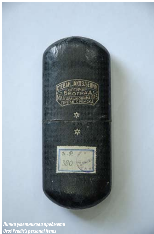
Лични уметнички предмети Uroš Predić's personal items