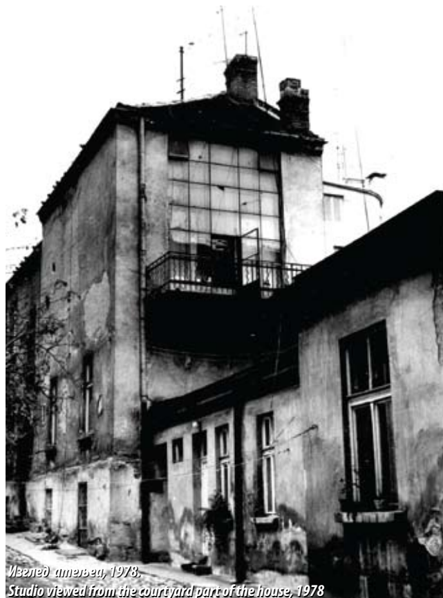
Изглед атељеа, 1978. Studio viewed from the courtyard part of the house, 1978