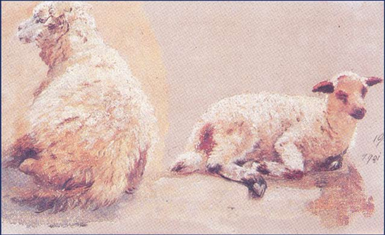
Јагањци, 1901. Lambs, 1901