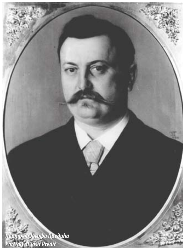
Портрет Јосифа Предића Portrait of Josif Predić

На месту данашње зграде Радио Београда, на раскршћу путева који су водили ка Палилули и Ташмајдану, током друге половине 19. века подигнута је друмска механа „Код два голуба“. Приликом именовања београдских улица 1872. године, то је постао први званичан назив данашње Светогорске улице. Крајем 19. века, на простору који је до шездесетих година био потпуно ненасељен, постепено се граде куће и развија живот надомак строгог центра престонице. Данас се тако дуж прометне Светогорске улице, поред новијих здања, налазе куће многих знаменитих личности с краја 19. и почетка 20. века: