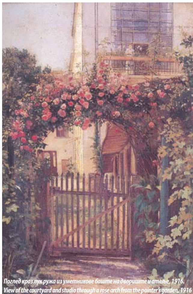
Поглед кроз лук ружа из уметникове баште на двориште и атеље, 1916. View of the courtyard and studio through a rose arch from the painter's garden, 1916

to the National Museum in Zrenjanin for safekeeping, where they still are. The house of the merchant Josif Predić was designed by Nikola Nestorović, a leading architect of the period. It is a two-storey house built in 1908 on a long and very narrow lot. Given the shape and size of the lot, the rooms were aligned on its longer axis, with the main drawing room at the street-facing end. The painter's studio above a flat was added to the courtyard side of the newly-built house. Apart from a balcony overlooking the garden, its exterior is plain. Unlike it, the street front of the house was decoratively shaped. Like the "Department Store" in Kralja Petra Street, Moscow Hotel in Terazije and the "House with Green Tiles" in Uzun Mirkova Street, the