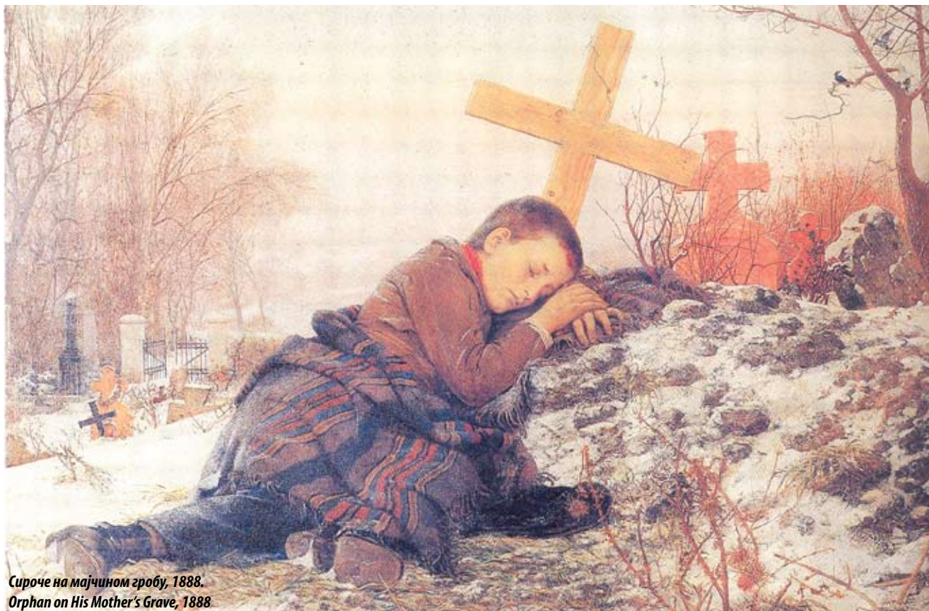
Сироче на мајчином гробу, 1888. Orphan on His Mother's Grave, 1888