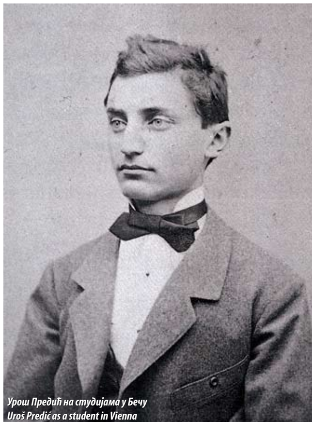
Урош Предић на студијама у Бечу Uroš Predić as a student in Vienna