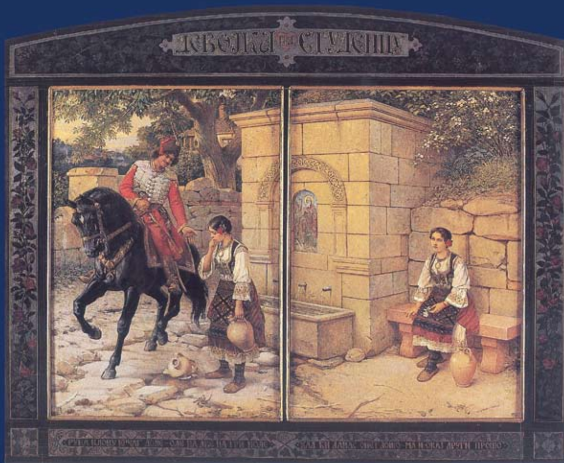
Девојка на студенцу, 1918 – 1936. Girl at the Well, 1918 1936