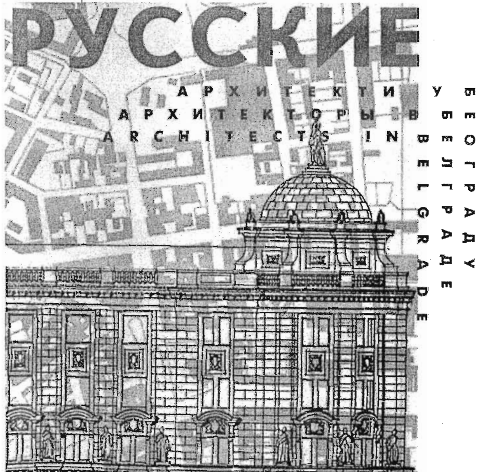
Насловне стране каталога