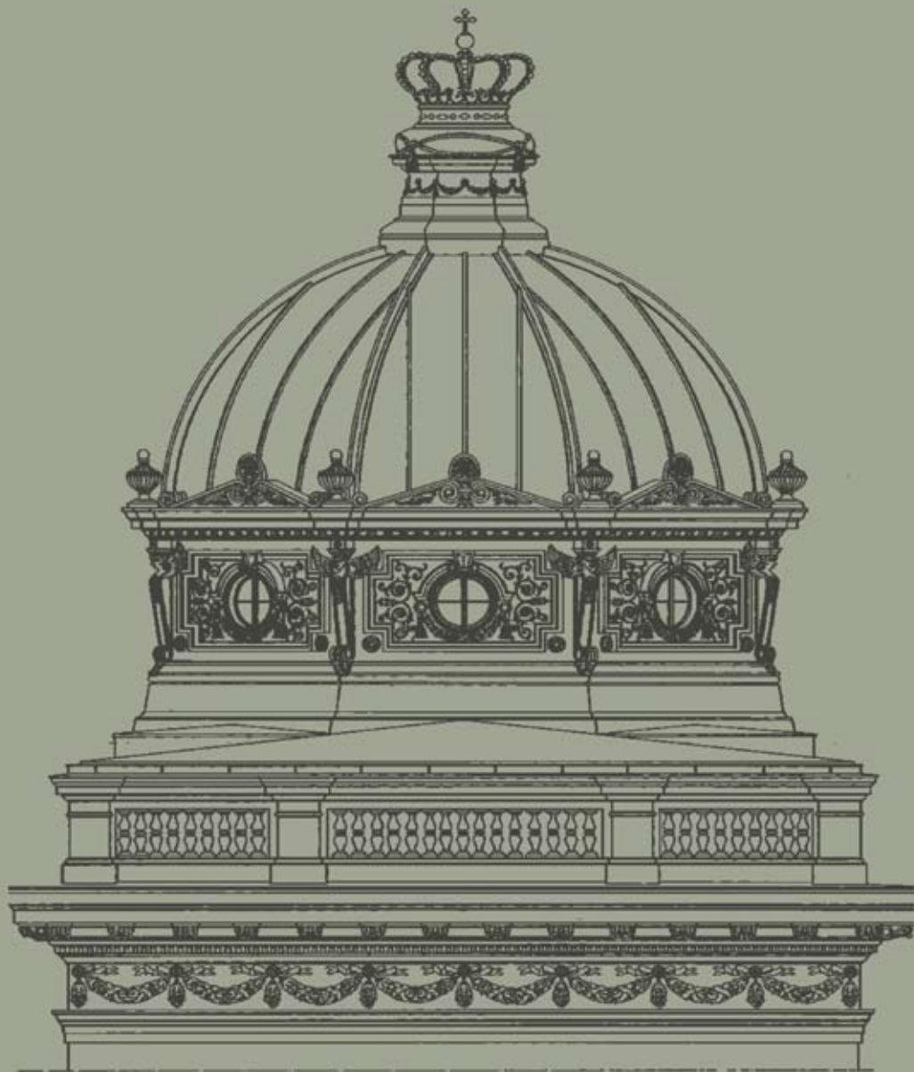
Цртеж реконструкције куполе Reconstruction of the dome, drawing