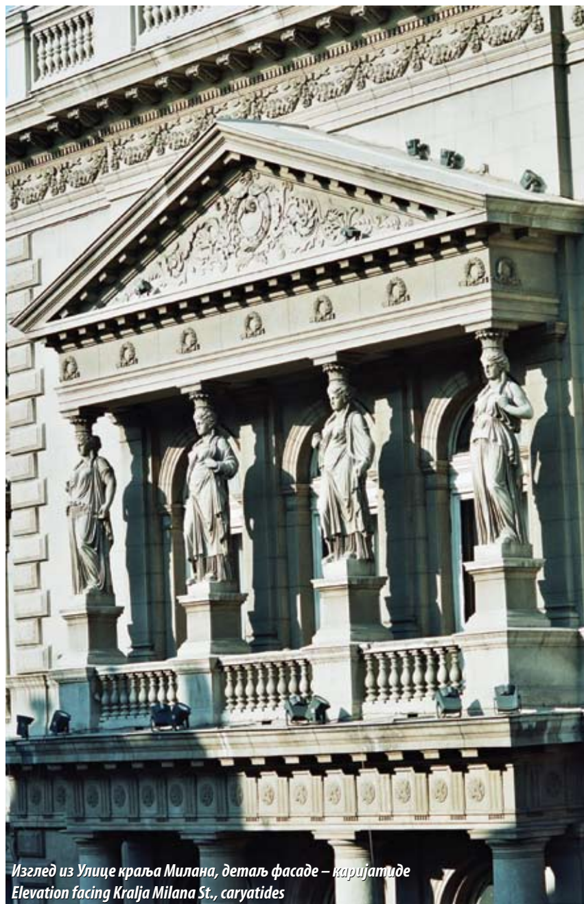
Изглед из Улице краља Милана, детаљ фасаде – каријатиде Elevation facing Kralja Milana St., caryatides