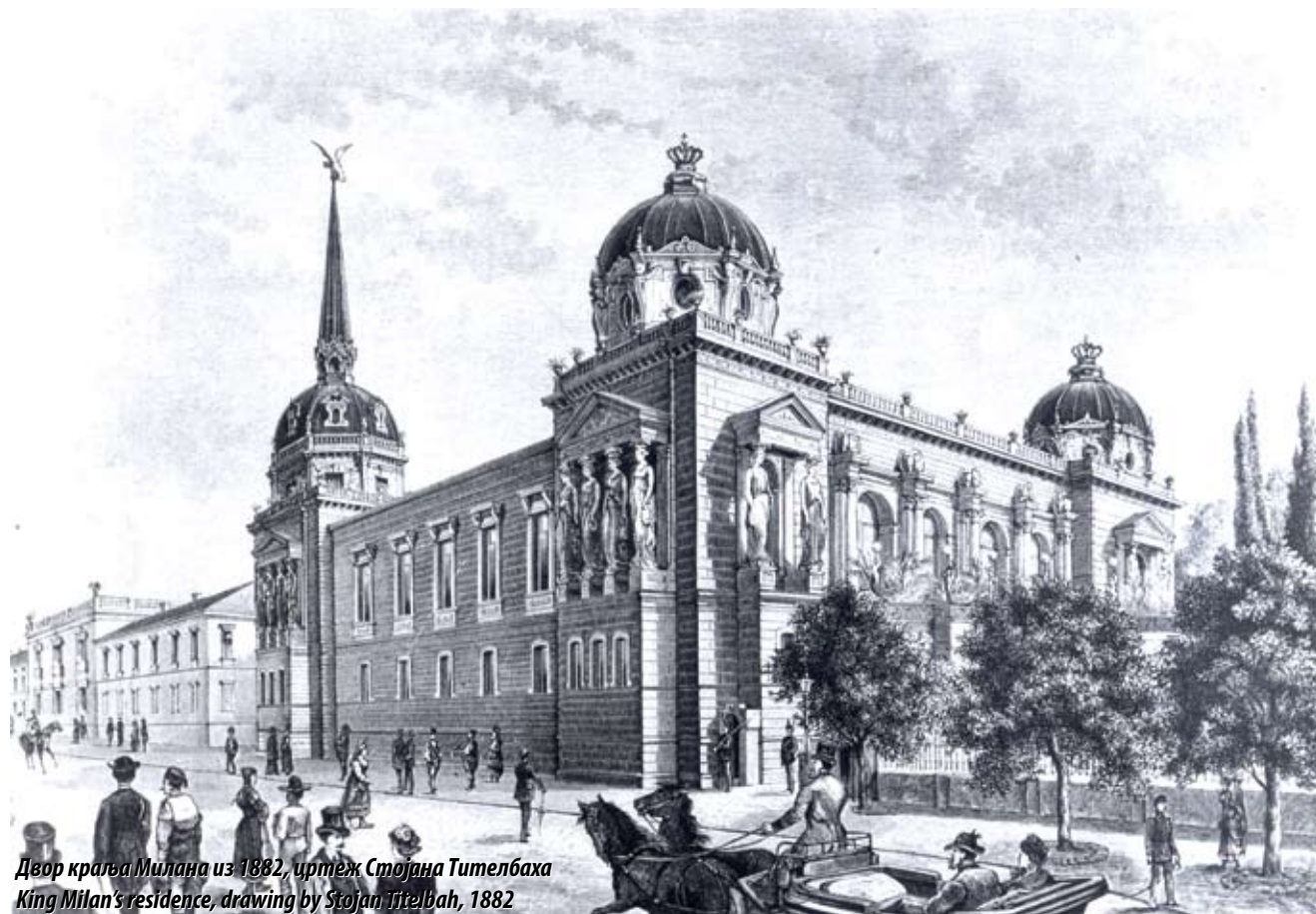
Двор краља Милана из 1882, цртеж Стојана Тителбаха King Milan's residence, drawing by Stojan Titelbah, 1882

Стари двор, једно од најрепрезентативнијих здања Београда, заједно са зградом Новог двора данас представља сведочанство првог дворског комплекса у Србији и симбол владавине две династије, Обреновић и Карађорђевић.