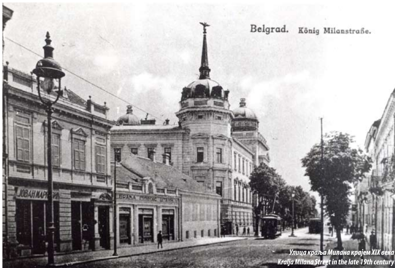
Улица краља Милана крајем XIX века Kralja Milana Street in the late 19th century

око баште је подигнута ограда а остатак мочваре је исушен и башта изнова уређена. Претварању у репрезентативније уређен „вернакуларни врт“ посветила је пажњу још кнегиња Персида Карађорђевић. Дворска башта била је подељена на „врт“, окренут ка Улици краља Милана који је чинио репрезентативни део дворске целине и на „парк“ у задњем делу ограђен зиданом оградом. У средишњем делу парка налазио се базен са скулптуром девојке с крчагом у руци, израђеном у Бечу. Од средине 19. века око Старог конака, као стожера будућег комплекса, подигнут је читав низ грађевина: Мали дворца, двор престолонаследника (зграда Министарства иностраних и унутрашњих послова), зграда дворске страже и неколико помоћних објеката према Дворској (данас Улица Драгослава Јовановића) и улицама Кнеза Милоша и Крунској. Ниједна од наведених грађевина није сачувана до данас.