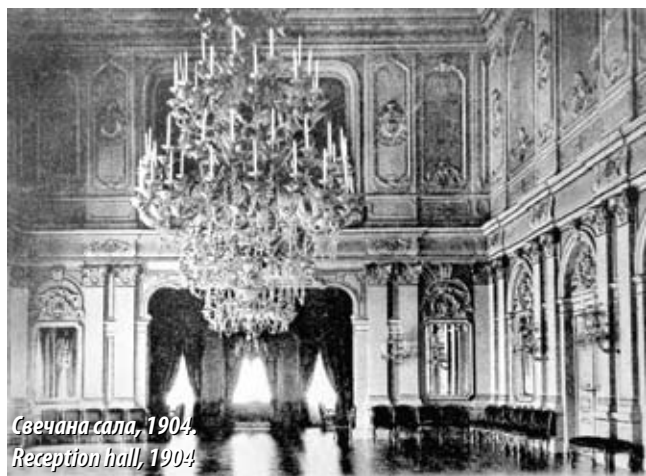
Свечана сала, 1904. Reception hall, 1904

The new concept of the palace complex gave the façade of the Old Palace facing the garden and the planned right wing, the residence of the Crown Prince, the significance of the main façade. This façade, and the one facing Kralja Milana Street, was more lavishly treated than the other two. Its symmetry was emphasised by the central position of the main entrance, the horizontal division into three sections and the arrangement of decorative elements: balconies, Ionic and Corinthian columns, pairs of caryatides, plastered decoration and two domes topped by royal crowns. The large pediment above the caryatides featured the new coat-of-arms of the Kingdom of Serbia, which is believed to have been the first time that the coat-of-arms of the Kingdom was publicly displayed on a building. The portion of the building at the corner of Kralja Milana and Dragoslava Jovanovića streets was reminiscent of a tower covered with a dome that tapered into a tall spire topped by a double-headed eagle. The use of this symbol suggests a direct connection between the erecting of the palace and the proclamation of the kingdom. The less assuagingly treated garden-facing elevation was dominated by a projecting end bay featuring the three-sided apse of the palace chapel on the upper floor.