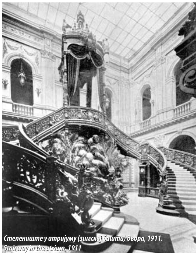
Степениште у атријуму (зимској башти) двора, 1911. Stairway in the atrium, 1911