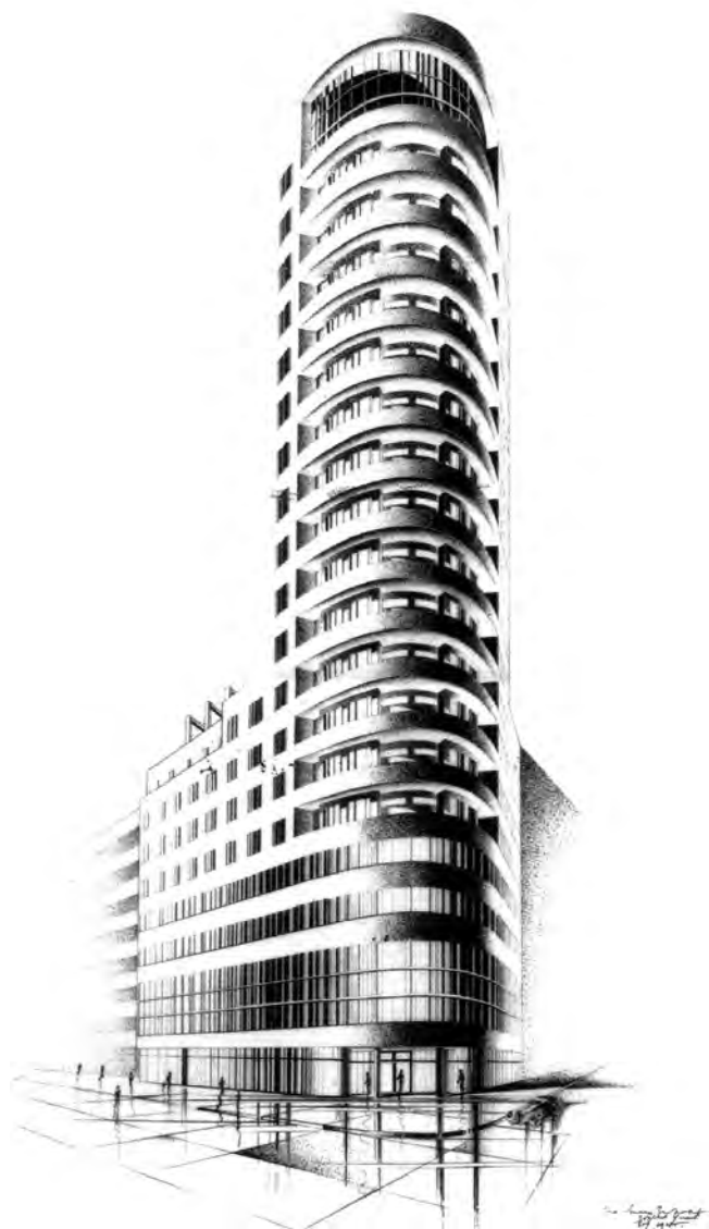
Сл. 7, 8. Робне куће Пејердорф и Шокен