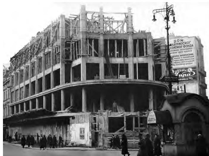
Сл. 2. Палаћа »Албанија« у изградњи