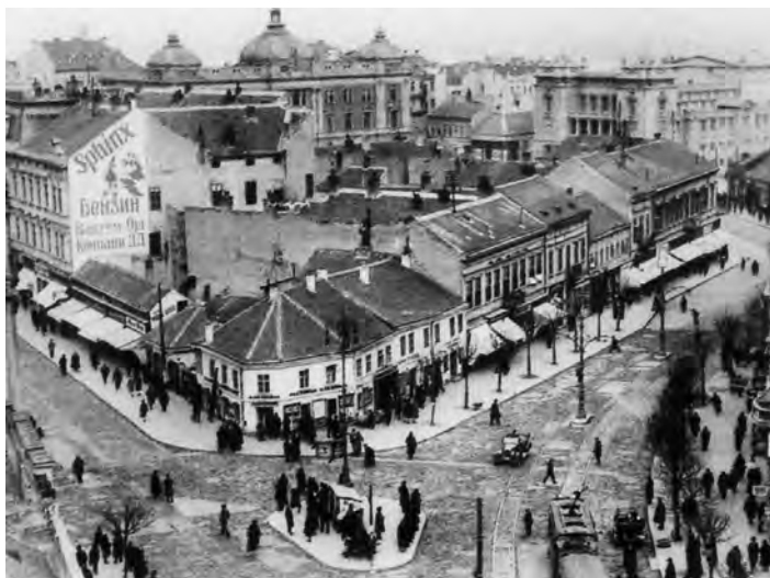
Сл. 1. Кафана »Албанија«