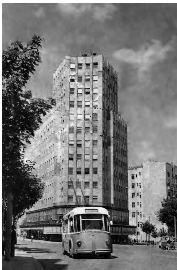
Сл. 4. Палаћа »Албанија«, 1947. година

шавају једну зграду у некој споредној улици... Знатан број наших познатих архитеката није учествовао на овом конкурс... Један од главних разлога је уобичајено укидање прве награде... Затим слободно давање извођења зграда и врло често неугодни састави жирија, односно неправедне оцене нацрта. На конкурсима дешавало се укидање прве награде и када су нацрти били задовољавајући. На тај начин је сопственик хтео да има одрешене руке коме ће да да извођење радова... Међу архитектурама се скоро са математичком тачношћу зна, ако учествује тај и тај архитекта, да ће добити награду, без обзира на успешно решење задатка... Иако се за одлуку жирија за зграду »Албаније« то не може рећи, ипак ранији такви поступци утицали су на одсуство многих архитеката на овом конкурс. Жири за зграду »Албаније« иако није погрешно у оцени, он је учинио другу погрешку што је укинуо прву награду...» 12