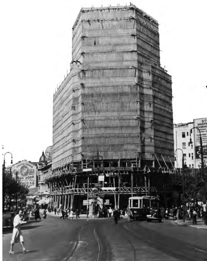
Сл. 3. Палаћа »Албанија« у току изградње

шавају једну зграду у некој споредној улици... Знатан број наших познатих архитеката није учествовао на овом конкурс... Један од главних разлога је уобичајено укидање прве награде... Затим слободно давање извођења зграда и врло често неугодни састави жирија, односно неправедне оцене нацрта. На конкурсима дешавало се укидање прве награде и када су нацрти били задовољавајући. На тај начин је сопственик хтео да има одрешене руке коме ће да да извођење радова... Међу архитектурама се скоро са математичком тачношћу зна, ако учествује тај и тај архитекта, да ће добити награду, без обзира на успешно решење задатка... Иако се за одлуку жирија за зграду »Албаније« то не може рећи, ипак ранији такви поступци утицали су на одсуство многих архитеката на овом конкурс. Жири за зграду »Албаније« иако није погрешно у оцени, он је учинио другу погрешку што је укинуо прву награду...» 12