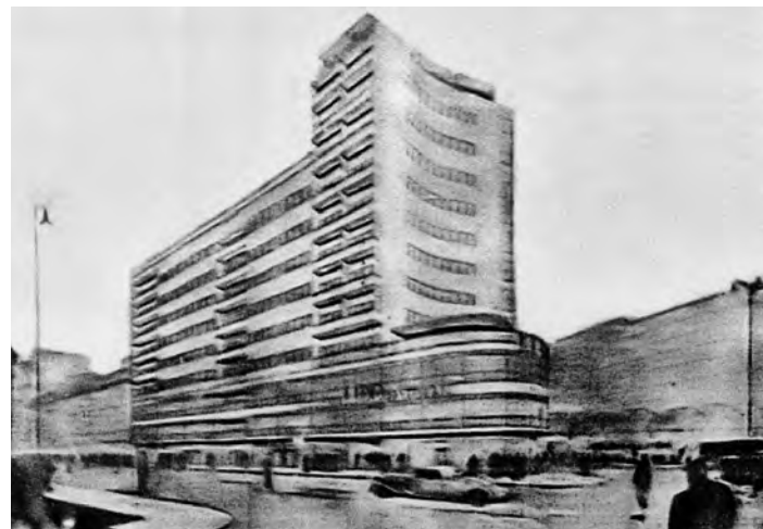
Сл. 5. Идејни пројекат палате »Албанија« тима Бауер–Хаберле

За рад са знаком 6747 (Бон и Гракалић) наводи се следеће: »Узета релативно висока закупнина од 50 000 динара месечно за иначе врло добро решен мезанин. Испростудирано вентилирање клозета код дућана на углу,