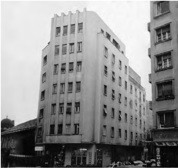
Сл. 11. Угао улица Пој Лукине и Тојличиној венца

тра да су најдоследније примењени на два најзначајнија дела српског модернизма – Брашовановој 46 Државној штампарији и Злоковићевој Дечјој клиници. 47