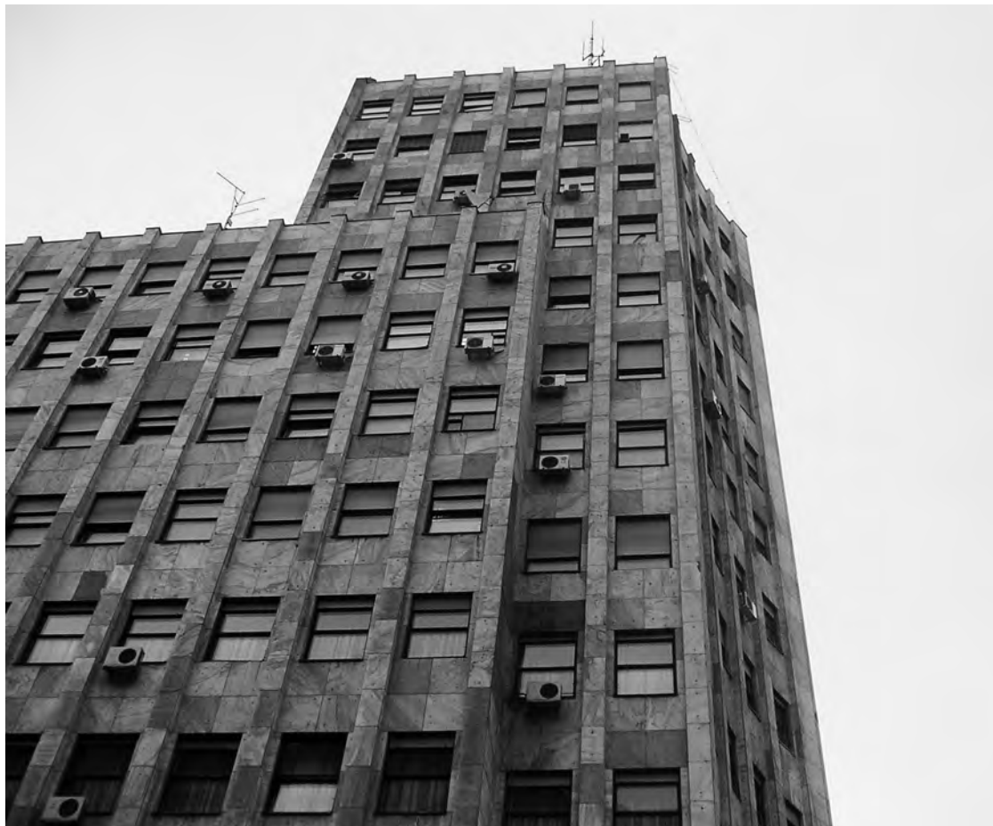
Сл. 12. Детаљ фасаде

спрат и према углу је конкаван, те се тек од тога поста-мента на горе развија права основа, која је према углу конвексна... Модерна архитектура на овој згради дошла је до свог пуног израза, јер ова зграда испуњава све њене услове..., а тако исто задовољава и естетску страну, иако нема ниједног орнамента нити каквог скулптуралног украса; озбиљна је и кокетна у исто време... Она представља заиста јединствен пример савременог стварања у области архитектуре у свету уопште... 54 Доста година касније »Албанија« и даље представља непресушни извор инспирације, па 1987. године излази чланак, конципован у похвалном маниру: »... На принципу конвексног (приземље и мезанин) и конкавног (спратови), постигнута је, чини се, идеална форма која затвара урбани амбијент Теразија... Палата »Албанија« је тако од, прерата, »највеће зграде на Балкану, остала и дан данас велика, али не више по броју спратова, већ по комплексном смислу свога једноставног концепта.« 55 Поводом смрти архитекте Бранка Бона (2001. године) арх. Михајло Митровић је у »Политици« објавио некролог. Том приликом је арх. Митровић, уместо закључка, цитирао арх. Милутина Борисављевића, који је био »великан српске архитектуре и пионир европске архитектонске