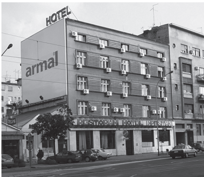
Сл.1. Хотел „Пошта“ -данашњи изглед