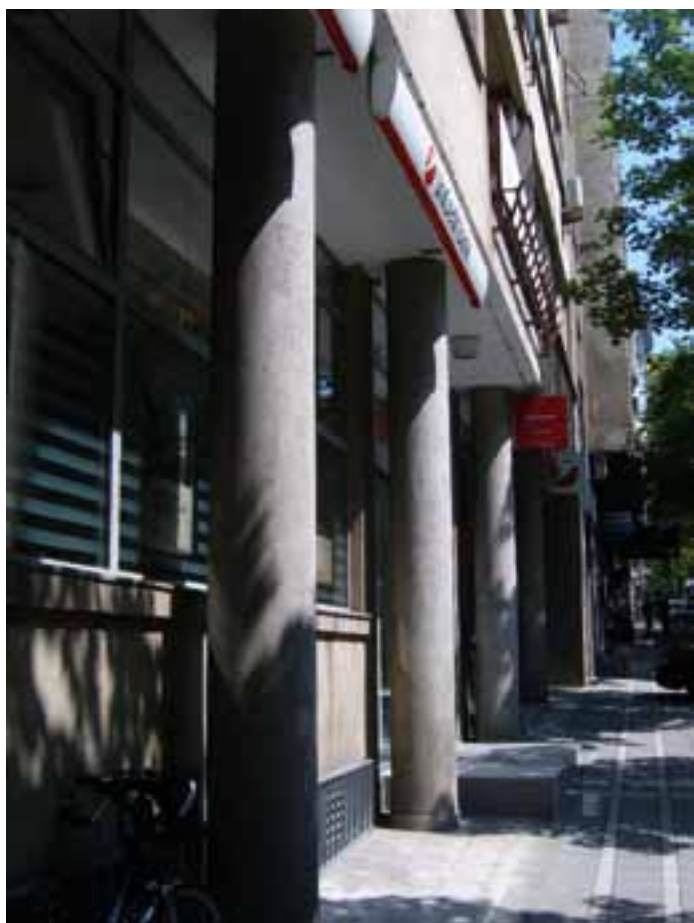
Сл. 4. Колонида приземља, изглед из 2011.

водоравним ритмовима пуног и празног, у које је уклопљена и вертикала степенишних лођа, што се од приземља ка врху благо сужава. Захваљујући лођама и преовлађујућем стакленом парапету, на обема фасадама је задуго било решено питање унутрашњег осветљавања и проветравања.