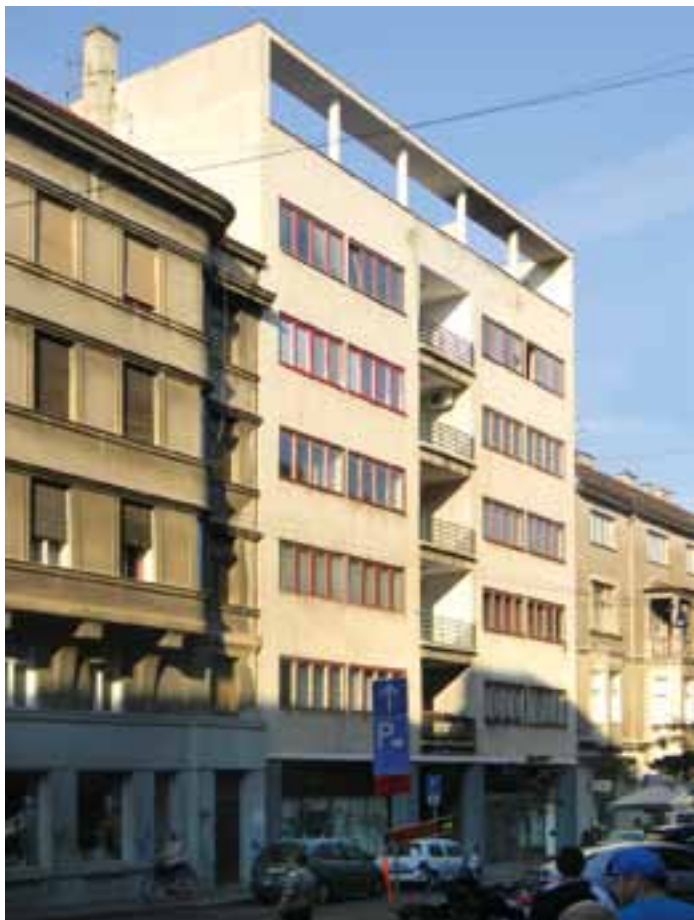
Сл. 5. Д. Иблер, Најамна стамбено-пословна зграда „Wellich“, Загреб, изглед из 2011.

Сукоб хоризонтала и вертикала, који су у великој мери експлоатисали београдски модернисти, на pročелу Новинарског дома није био пренаглашен, док је на дворишној страни потпуно изостао. Према категоризацији до сада систематизованих метода интерполација у домаћој архитектури, Вајсманова се може сматрати екстремнијим обликом контрастног уклапања, или блажим видом екстраполације. 56