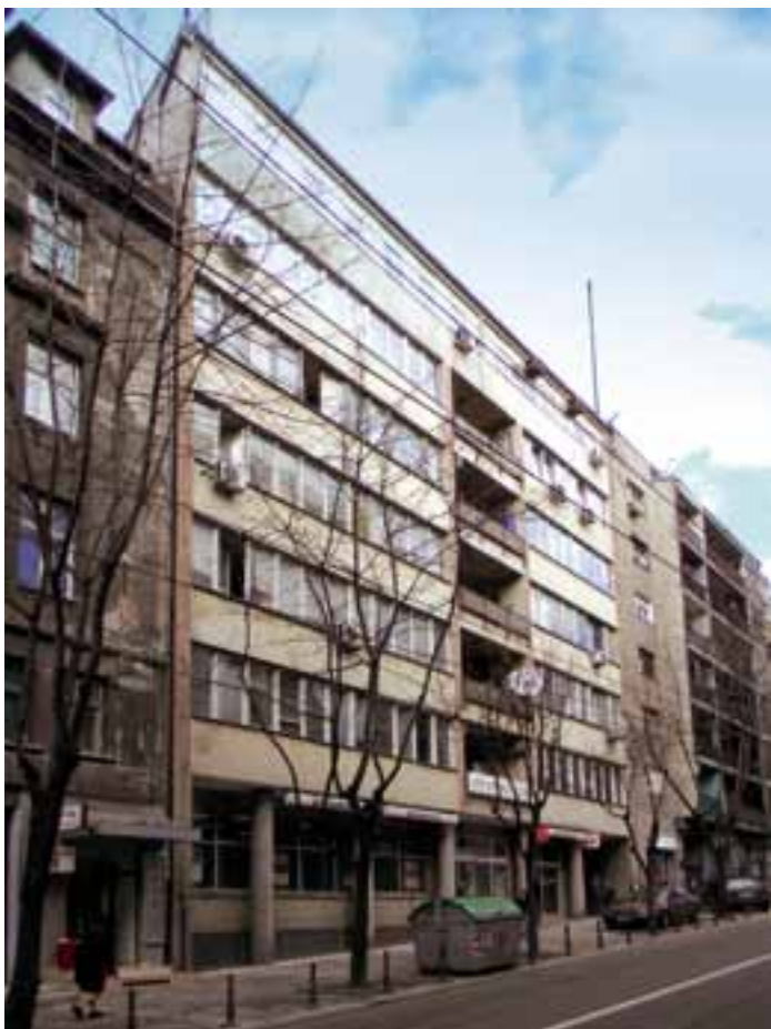
Сл. 3. Прочеље, изглед из 2011.

Прозори у становима и канцеларијама првобитно су били дрвени, типа „крило на крило“ ( Verbundfenster ), споља прекривени дрвеним „Esslingen“ засторима. Прозори застакљеног степеништа, видљивог са фронта, инкорпорирани су у гвоздену конструкцију с централним једноструким остакљењем и бочним крилом за отварање. Кровни покривач је изграђен у форми бетонске плоче.