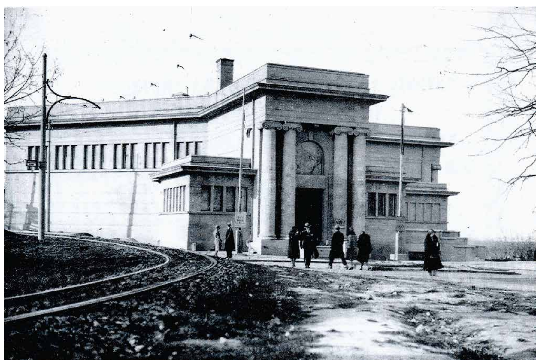
1928. ГОДИНА YEAR 1928