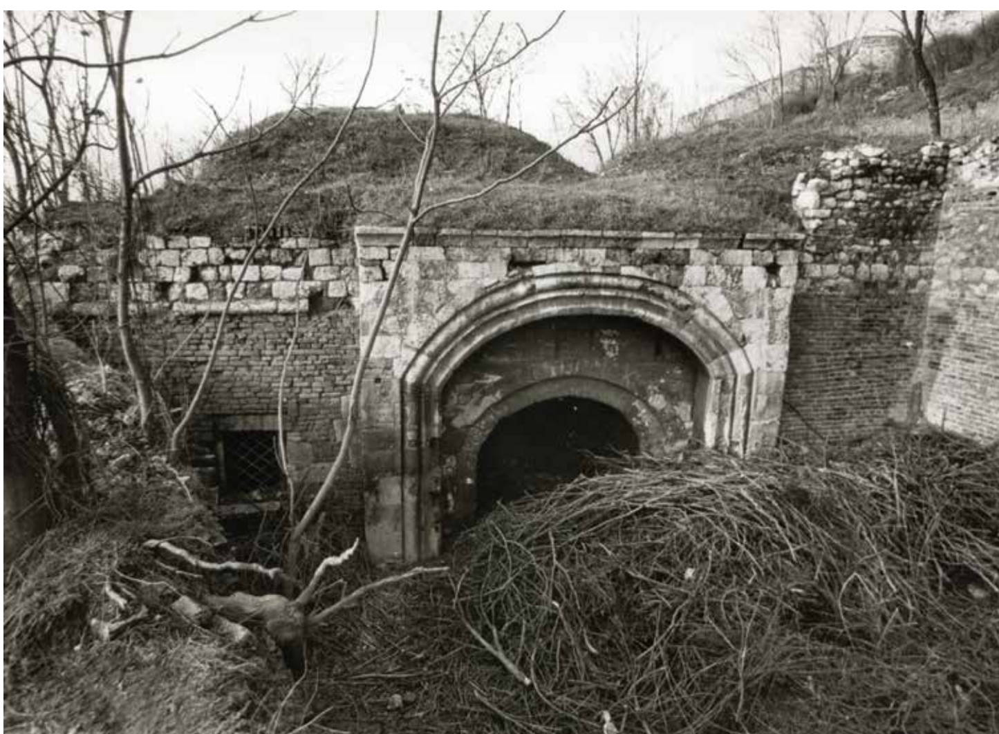
1980. ГОДИНА YEAR 1980

FOR WORKS AFTER 1740, AUSTRIAN FORMAT BRICK WAS USED ALMOST EXCLUSIVELY, MEASURING 30 X 17 X 7 CM AND JOINED TOGETHER WITH GOOD-QUALITY WHITE LIME MORTAR, WHILE THE FAÇADES WERE MADE FROM CUT STONE. THE SOUTHERN FAÇADE IS NOTABLE ONLY FOR ITS PROFILED OUTER ARCH AND ITS SIMPLE PILASTERS, WITH THE SCULPTURAL DECORATION LIMITED TO SMALL ROSETTES IN STONE. THE FAÇADE OF THE DARK GATE, CONTAINS NICHE, EMPTY AT PRESENT BUT FORMERLY IN ALL LIKELIHOOD DISPLAYING PANEL WITH THE SULTANS' TUGHRA. THE ONLY SUCH PANEL PRESERVED TO THIS DAY IS THE ONE ABOVE THE MIDDLE ARCH OF THE DANUBE PORT GATE.