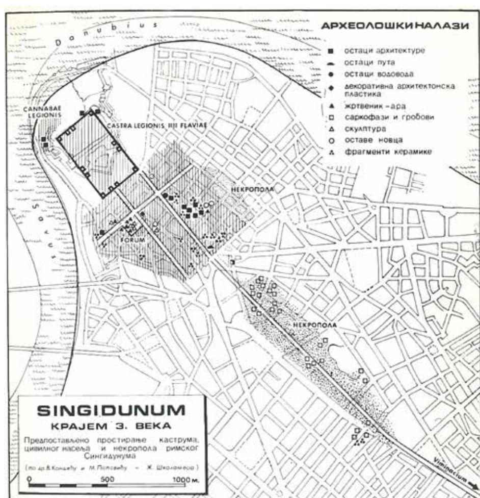
МАПА СИНГИДУНУМА КРАЈЕМ 3. ВЕКА MAP OF SINGIDUNUM, END OF THE 3RD CENTURY

WITHIN THE MEDIAEVAL NORTHEASTERN RAMPART OF THE UPPER TOWN, TRACES OF THE ROMAN FORTIFICATION WITH A RECTANGULAR TOWER BUILT WITH SANDSTONE BLOCKS CAN STILL BE SEEN. THE ROMANS TOOK OVER WHAT IS NOW BELGRADE IN THE BEGINNING OF THE 1ST CENTURY AD, AND RULED IT FOR FOUR CENTURIES. THE ROMAN MILITARY CAMP IN SINGIDUNUM WAS THE FIRST STONE FORTIFICATION EVER BUILT ON THE TERRITORY OF PRESENT-DAY BELGRADE. FROM THE TIME OF THE ROMAN CONQUEST TO ITS DESTRUCTION IN 441 BY THE HUNS, SINGIDUNUM WAS ONE OF THE MOST IMPORTANT CENTRES OF THE ROMAN PROVINCE OF MOESIA. AROUND THE YEAR 91 IT BECAME THE HEADQUARTERS OF THE LEGIO IV FLAVIA. THE CASTRUM WAS BUILT ON THE UPPER TOWN'S PLATEAU, ENCOMPASSING A LARGE PART OF TODAY'S KALEMEGDAN PARK. RECTANGULAR IN PLAN, IT WAS SOME 568 X 430 METERS LARGE. BUILT AS ONE OF THE STRONGEST ROMAN FORTIFICATIONS ALONG THE MIDDLE DANUBE, ON THE LIMES BETWEEN UPPER MOESIA AND BARBARICUM, SINGIDUNUM WAS TO PRECLUDE INCURSIONS BY THE BARBARIANS TO THE BALKAN PROVINCES. YET, ITS DESTRUCTION BEGAN IN THE MIDDLE OF THE 5TH CENTURY, DUE TO ATTACKS BY VARIOUS TRIBES, NOTABLY THE HUNS. ACCORDING TO HISTORICAL ACCOUNTS, AFTER THE DISSOLUTION OF THE HUNNIC STATE SINGIDUNUM WAS LEFT DEMOLISHED AND UNPROTECTED FROM CONQUESTS BY OTHER TRIBES. IN THE 6TH CENTURY, AT THE TIME OF EMPEROR JUSTINIAN, EASTERN ROMAN RULE OVER THE TOWN WAS RESTORED, BUT NOT FOR LONG.