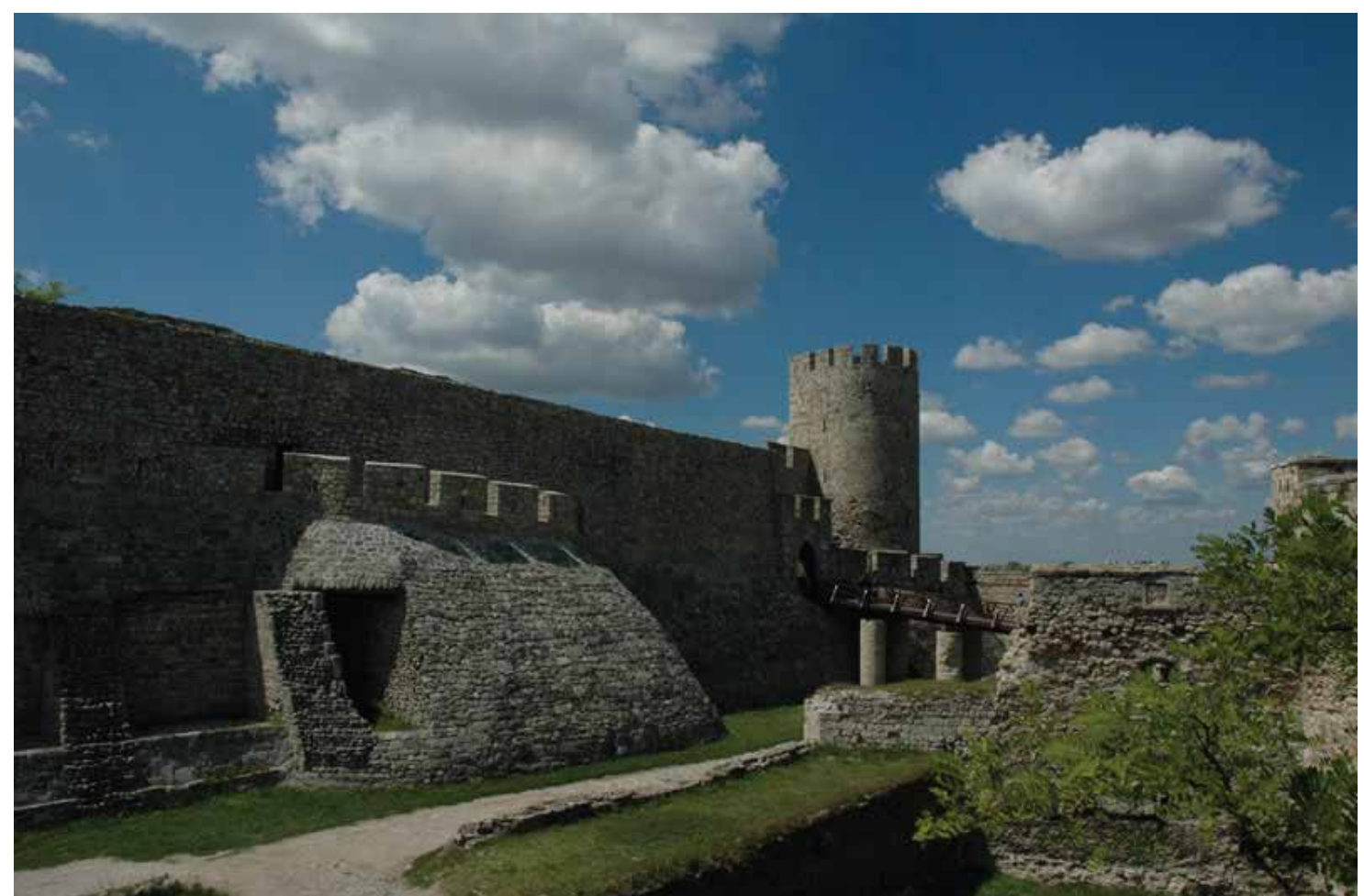
ОСТАЦИ КАСТРУМА У ОКВИРУ СЕВЕРОИСТОЧНОГ БЕДЕМА TRACES OF THE ROMAN CASTRUM WITHIN THE MEDIAEVAL NORTHEASTERN RAMPART