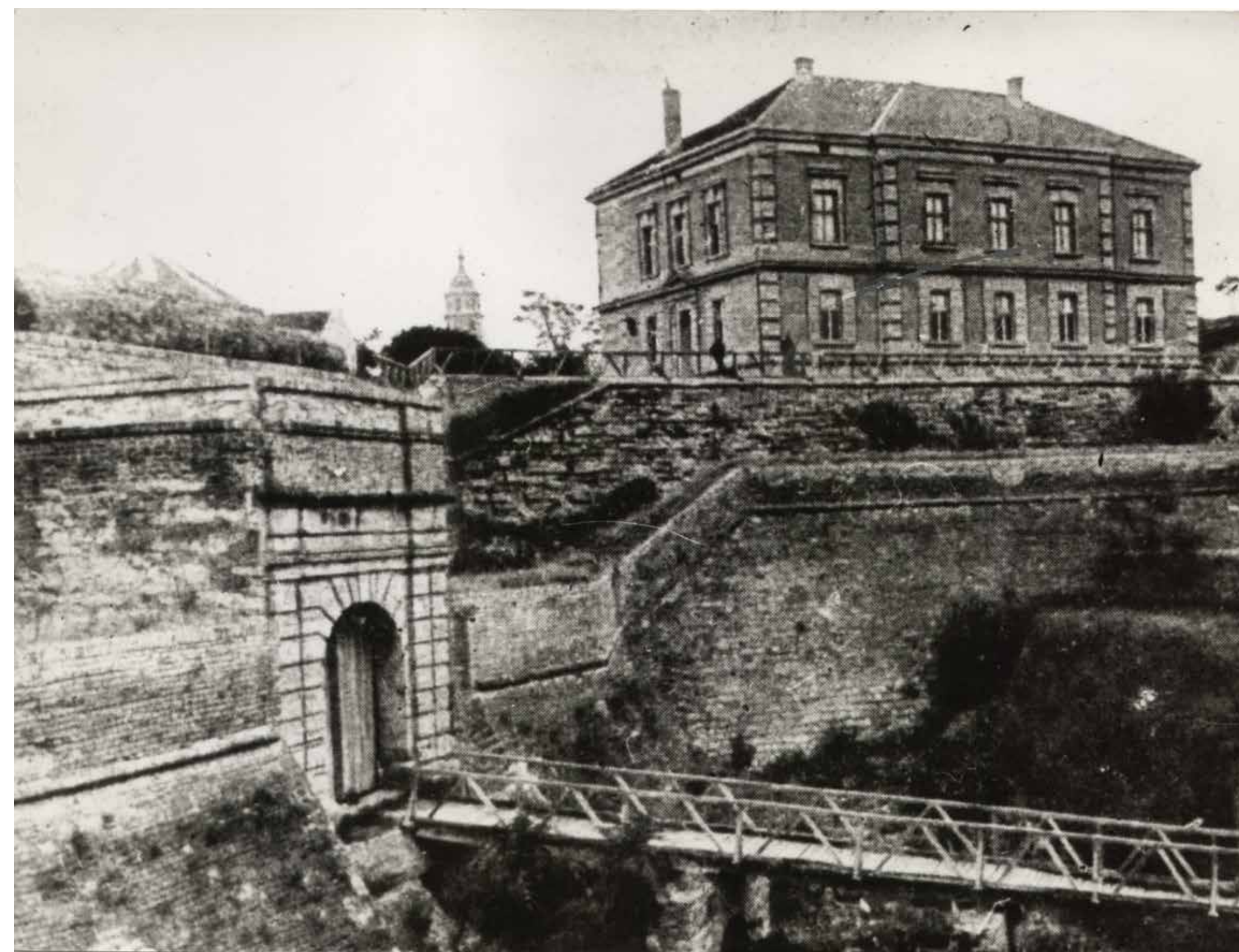
ПРВА ДЕЦЕНИЈА XX ВЕКА FIRST DECADE OF THE 20TH CENTURY