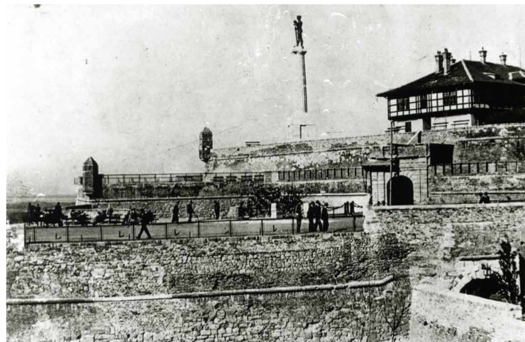
1928. ГОДИНА YEAR 1928