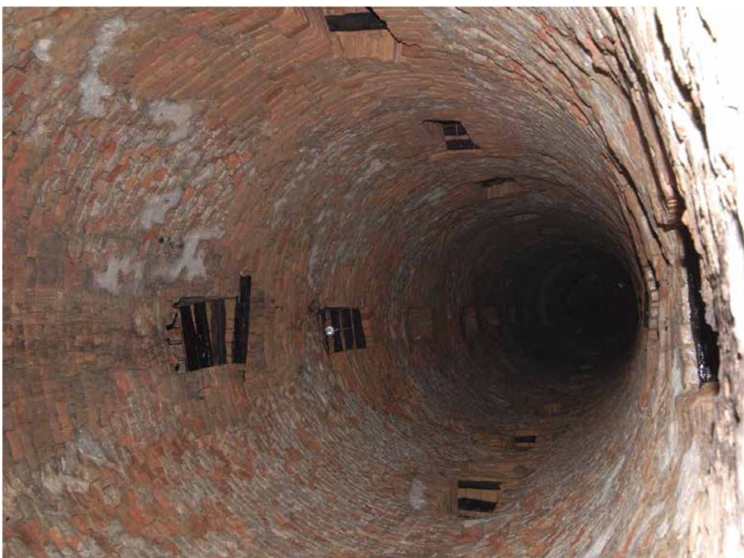
ИЗГЛЕД ЦИЛИНДРА CYLINDER APPEARANCE

DUG DEEP INTO THE GROUND, THE WELL IS APPROACHED THROUGH A CORRIDOR LEADING TO THE TWO-PART SQUARE CENTRAL ROOM. ITS MIDDLE PART, ACCOMMODATING THE WELL ITSELF, IS COVERED BY A CALOTTE, AND THE SPACIOUS CORRIDOR AROUND ITS PERIMETER IS ROOFED WITH A BARREL VAULT. NEXT TO THIS ROOM, LATERALLY TO THE ENTRANCE CORRIDOR, THERE IS ANOTHER ROOM OF THE SAME PLAN, IN WHICH WATER WAS COLLECTED. THE CENTRALLY POSITIONED WELL IS 3.40 METERS IN DIAMETER AND 61.15 METERS DEEP. THERE ARE TWO SPIRAL STAIRWAYS ENCIRCLING ITS WALL. ALL THE WALLS ARE MADE OF AUSTRIAN FORMAT BRICK AND SOME STONE. THERE WERE EIGHT WINDOWS FOR LIGHTING AND VENTILATION. WATER WAS POSSIBLY DRAWN WITH A PUMP LAID IN THE WELL, WHICH HAS NOT BEEN PRESERVED. THE 'ROMAN WELL' IS A UTILITARIAN MILITARY EDIFICE REPRESENTING THE MOST ADVANCED FORTIFICATION ARCHITECTURE OF ITS TIME.